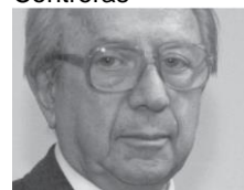
1975 Fernando Léniz Cerda