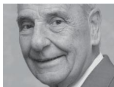
1969 Washington Cañas Lastarria