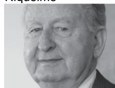
1970 Helios Piquer Meliga