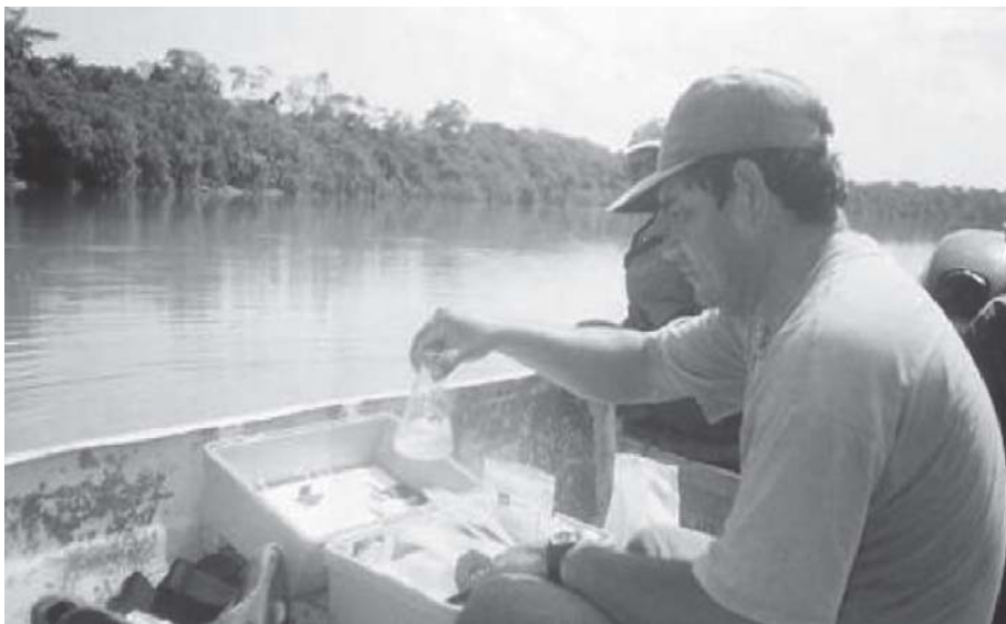
Foto 2. El autor en la cocha Priguisa en el río Yavarí, realizando análisis del agua. Octubre 2002.

El componente íctico está representado por las principales especies: Piaractus brachypomus «paco», Colossoma macropomum «gamitana», Prochilodus nigricans «boquichico», Semaprochilodus theraponura «yaraqui», Potamorhina altamazonica «llambina», Potamorhina latior «yahuarachi», Psectrogaster amazonica «ractacara», Mylossoma duriventris «palometa», Triporthes angulatus «sardina», Myleus rubripinnis «kuruhuara», Hoplias malabaricus «fasaco», Anodus elongatus «yulilla», Cichla monoculus «tucunaré», Astronotus ocellatus «acarahuazú», Satanoperca jurupari «bujurqui», Osteoglossum bicirrhosum «arahuana», Arapaima gigas «paiche», Hypophthalmus edentatus «maparate», Plagioscion squamosissimus «corvina», Leiarius marmoratus «ashara», Pseudoplatystoma tigrinus «tigre zúngaro», Pseudoplatystoma fasciatum «doncella», Rhaphiodon vulpinus «chambira», Hydrolycus scomberoides «huapeta», Acestrorhynchus falcirostris «pez zorro», Sorubim lima «shiripira», y una especie aparentemente abundante y endémica para la zona Chaetobranchus semifasciatus (Cichlidae), considerada registro nuevo para el país (fotos 1,2 ).