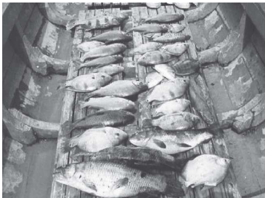
Foto 3. Interrelación con otras especies en el momento de la captura. Octubre 2002.

En el ambiente de captura se encuentra interrelacionado con otras especies como: tucunaré, palometa, boquichico, bujurqui punta shimi, bujurqui acha vieja, llambina, bujurqui vaso, fasaco, acarahuazú, lisa negra (foto 3).