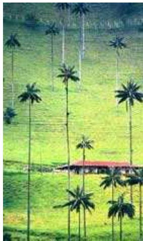
Palma de cera del Quindío (Ceroxilon quindiuense)