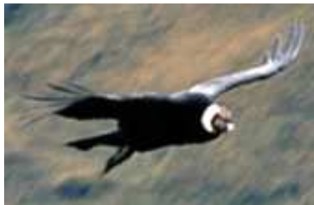
El cóndor (vultus gryplus).