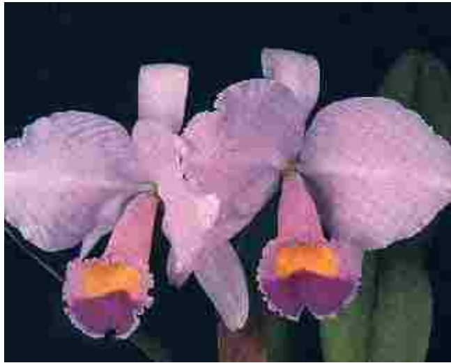
Orquídea (Catleya Trianae)