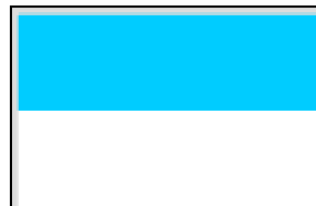
Valle del Cauca