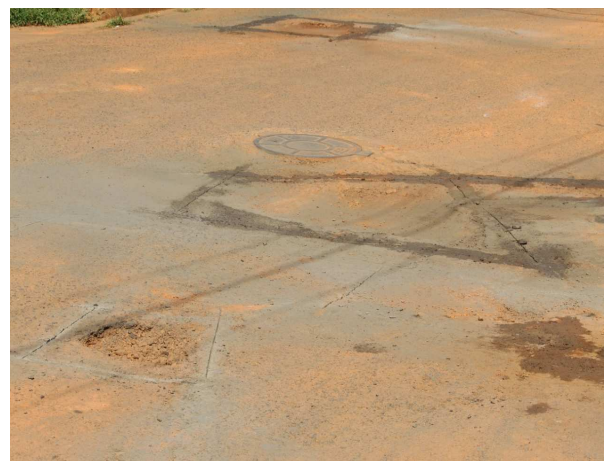
3. Requadro do buraco;