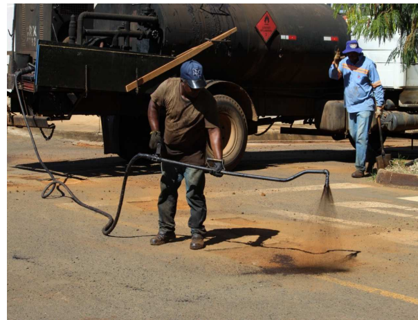
6. Pintura de ligação;