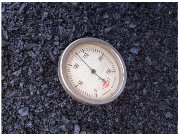
1. Conferência da temperatura do CBUQ (asfalto quente)