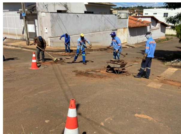
9. Limpeza do entulho.