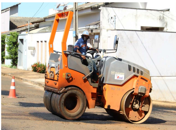
8. Compactação com rolo;