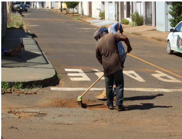
5. Limpeza para aplicação de CBUQ;