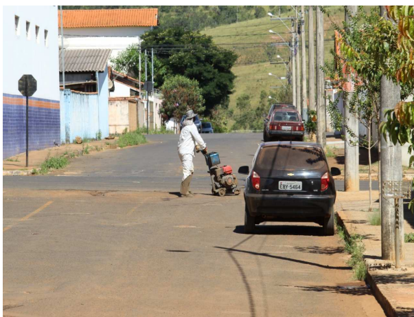
2. Corte do buraco com cortadora de piso;