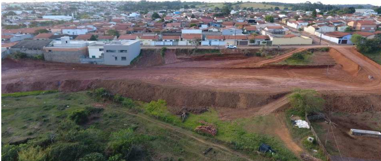
A área destinada a construção de sede da Casa de Maria em Perdizes, fica no bairro Parque das Flores.