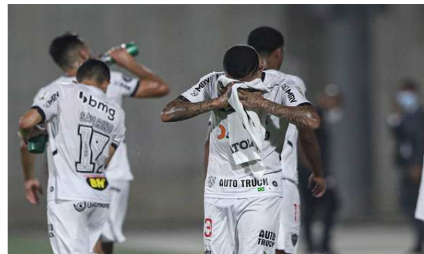
Jogadores do Atlético sofrem com gás lacrimogêneo

O Galo sofreu mais do que devia por esse setor, que carece de uma revisão posicional, já que Guilherme Arana é uma peça ofensiva indispensável, ainda mais com Keno longe de seus dias de brilho no Galo. O América de Cali, bem limitado taticamente, ainda conseguiu acertar a trave no segundo tempo, quando o Alvinegro já estava na frente novamente, após goloço de Arana. Cuca só fez as primeiras substituições depois dos 30 minutos do segundo tempo, quando viu o time perder força de contra-ataque. Mexeu bem, com Tardelli e Vargas aproveitando vacilo do América de Cali, e o chileno encerrando o jogo com o terceiro gol, em belo chapéu no goleiro após passe milimétrico do camisa 9. Fica a classificação merecida do Atlético, que sobra no grupo e terá dois jogos para carimbar a liderança - Cerro Porteño (fora) e La Guaira (em casa), podendo focar com mais tranquilidade na ida e na finalíssima do Campeonato Mineiro, marcadas para os próximos dois fins de semana. - Iremos com força máxima. Mas a força máxima não significa o mesmo 11 que jogou hoje. Eu irei medir, junto com a fisiologia, com a preparação física, todos que estiverem nas melhores condições. Essa será a força máxima - disse Cuca. Eduardo Sasha sequer entrou em campo, assim como Alan Franco, Hyoran, Nathan e Marrony, sendo que o último nem ficou no banco de reservas. Tardelli, Réver, Allan, Vargas e Dodô jogaram menos de 20 minutos. O Galo, classificado na Libertadores, vai forte pra tentar o bicampeonato estadual.