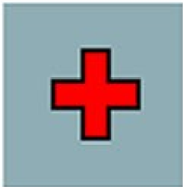
Condición de salud