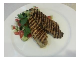
烤雞胸肉扒配沙律