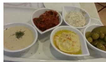
四款不同的醬料及橄欖