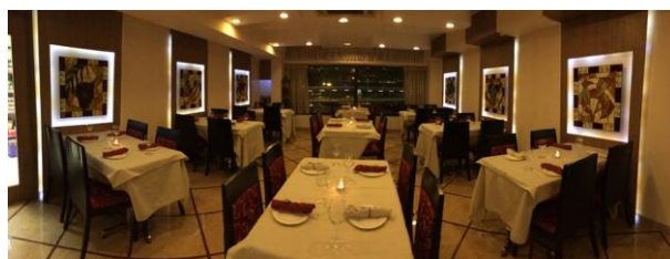
猶太菜餐廳清雅的環境

前陣子筆者有機會去到一間願意招待外來及非猶太裔客人的猶太菜餐廳用膳，那裏環境及氣氛獨特，樓上是猶太教會堂，安息日（星期五下午至星期六）、逾越節期間、住棚節期間都只供猶太人享用，不對外招待。那天晚上，我體驗了猶太人的飲食文化。前菜彼得包（Pita），又稱口袋包，源於中東及地中海區的烤餅，烤的時候麵糰會鼓起來，形成一個中空的麵包，像一個口