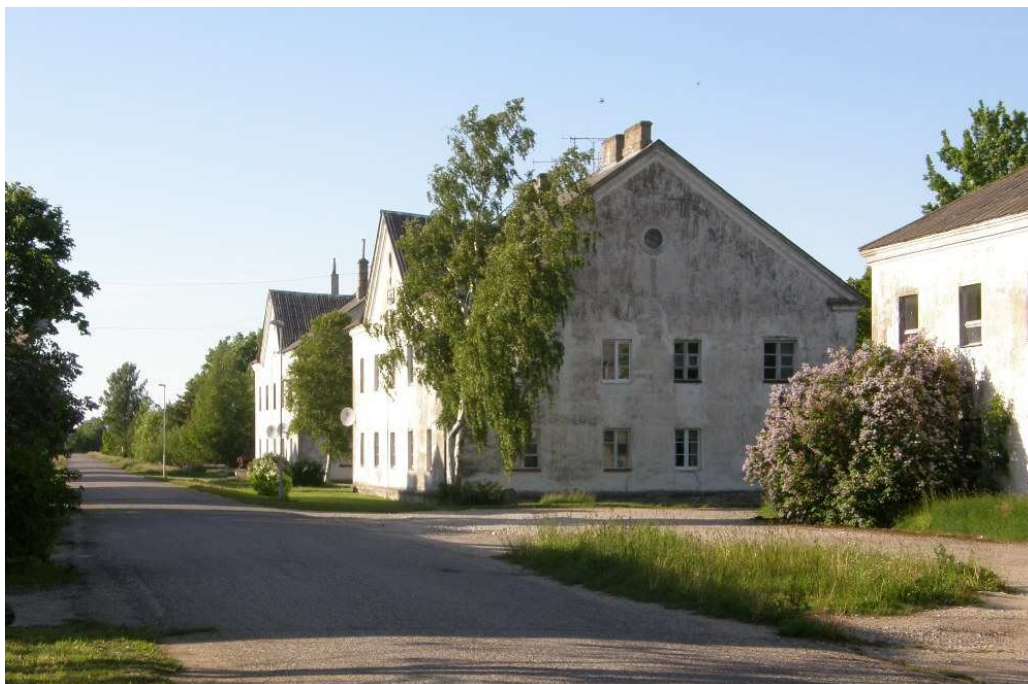
Foto 3. Kõrgessaare sadama tee piirkonna elamud on ühtse stiiliga – elamutel on säilinud algne välisviimistlus ja akende jaotus. Senist lubikrohvi ja akendejaotust tuleb alal säilitada. Otstarbekas oleks tagada hoonele ka ühtne katusekattematerjal ja värv (nt valtsplekkkatus).