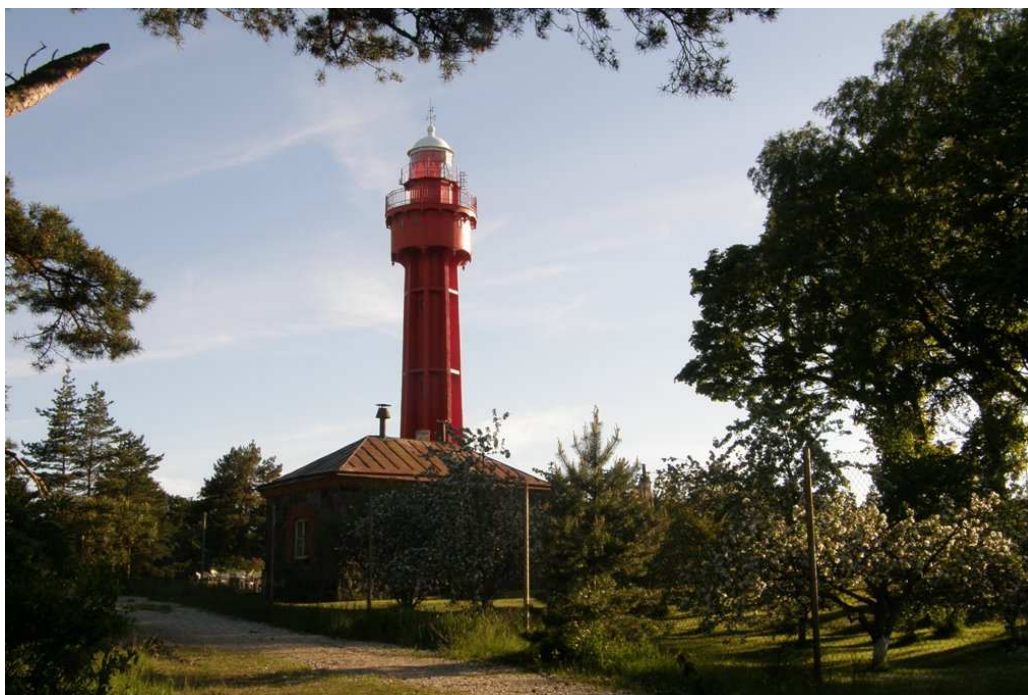
Foto 5. Vaade Ristna tuletornile (rajatud 1874. a).