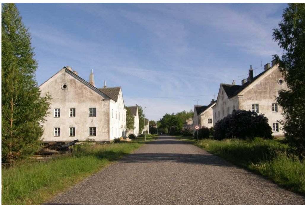
Foto 2. Vaade Kõrgessaare sadama tee piirkonna elamutele Sadama suunalt.