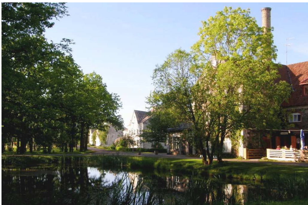
Foto 1. Uueks miljööväärtuslikuks alaks määratud Kõrgessaare sadama tee piirkond on terviklik ala mis algab Viinaköögi hoone juurest.