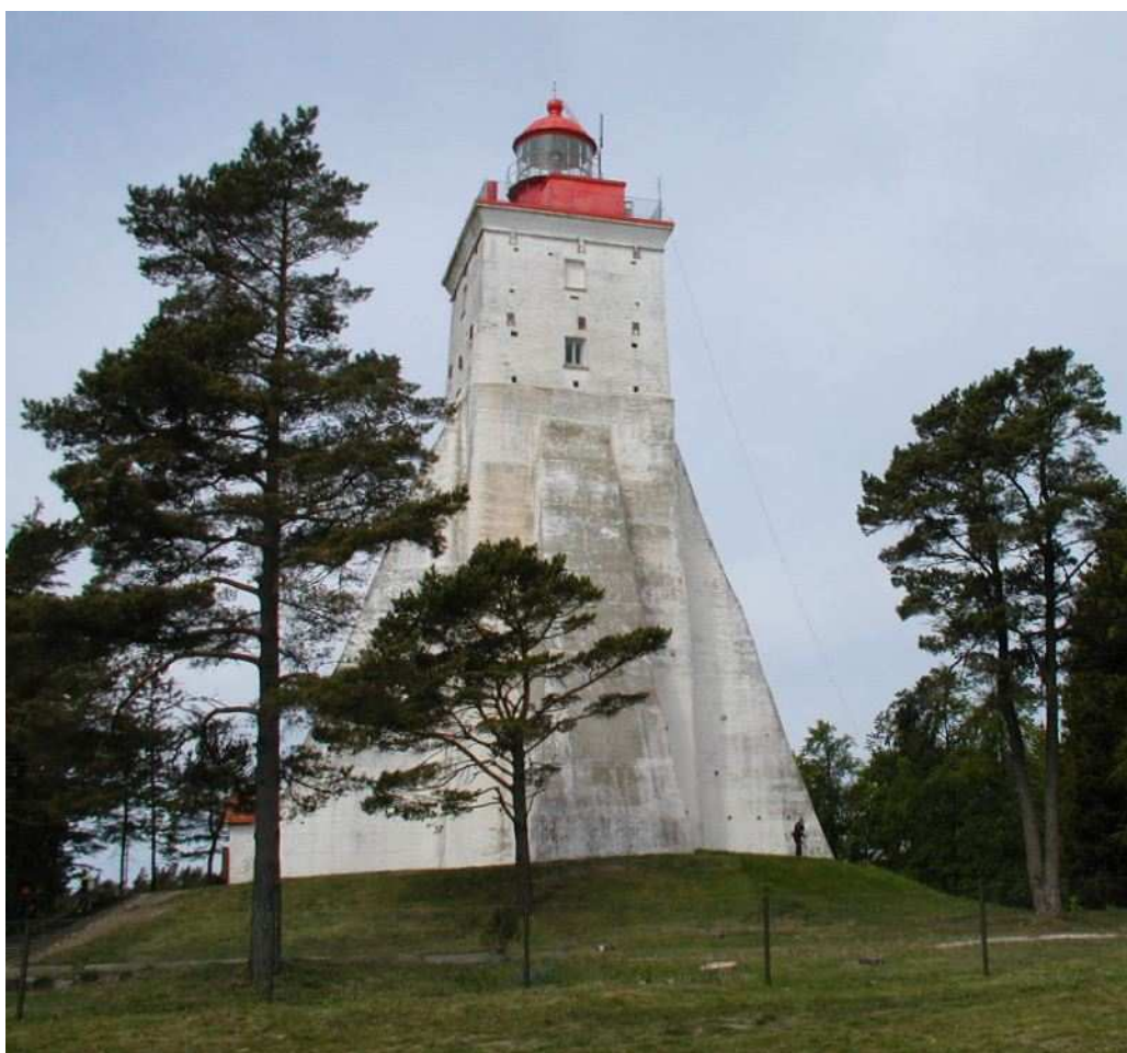
Foto 6. Vaade Kõpu tuletornile (rajatud 1531. a, kõrgusega merepinnast 102 m).