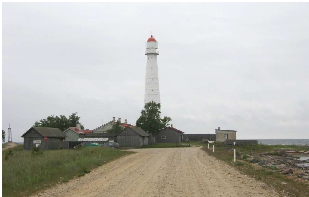
Foto 4. Vaade Tahkuna tuletornile (rajatud 1875. a). Vasakul paistab parv-laeval Estonia hukkunutele pühendatud mälestussammas – metalltorn kellaga.