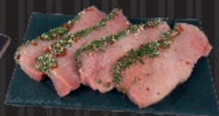
550 g Vikingesteak