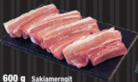
600 g Sakiamerngit Spareribs