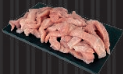
500 g Amitsukujuut Skinkokød i strimler