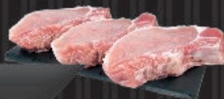
550 g Koteletsit Koteletter