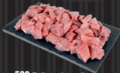
500 g Neqqarinnermit siatassat aggugaaqqat Skinkokød i tern