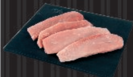
550 g 4 stk. Neqqarinneq siatassaq Skinkeschnitzler