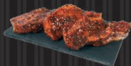
550 g 4 stk. Koteletsit simersiat Marinerede svinekoteletter