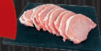
480 g Koteletsit Fadkoteletter