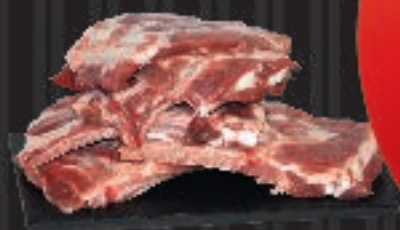
800 g Najungasut Ribben