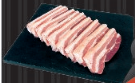
550 g Puulukimineq kitsigaq Svinebryst i skiver