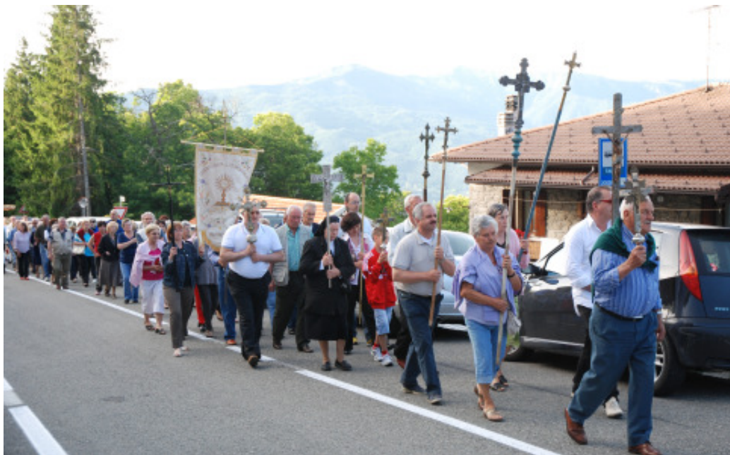
Rimagna: la festa del "Corpus Domini" nel 2009 con la partecipazione del Vescovo Mons. E.nrico Solmi e delle parrocchie dell'Unità Pastorale