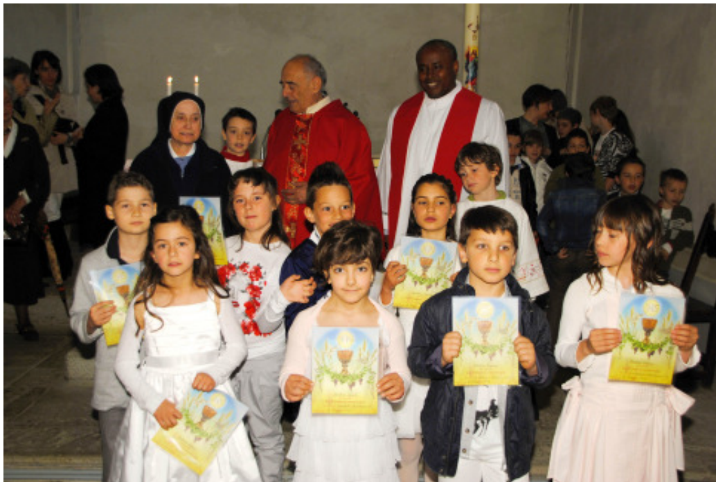
I bambini della Prima Comunione con i sacerdoti e la loro catechista