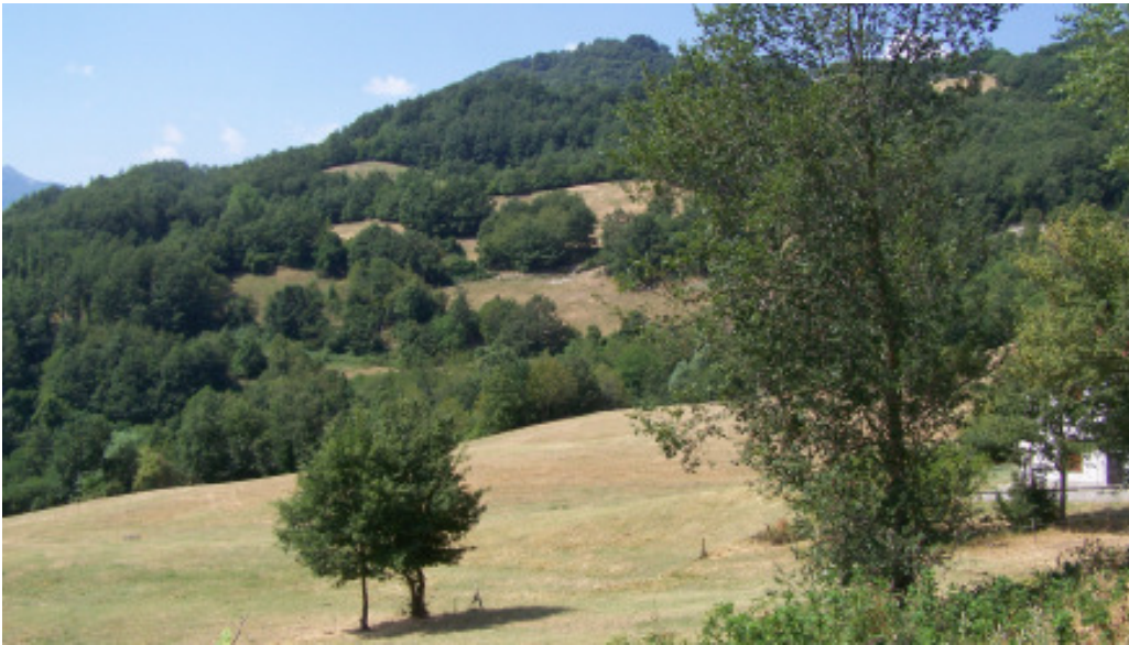
Uno scorcio “di natura” sui prati e i pascoli di Vaestano