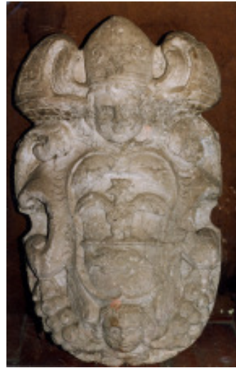
Lo stemma del Vescovo di Parma Giuseppe Olgiati Feudatario delle Corti di Monchio dal 1694 al 1711