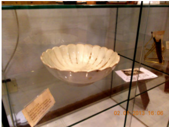
La zuppiera del miracolo