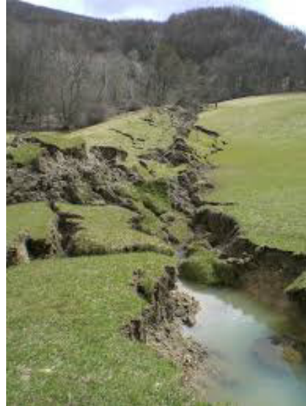
Il disastro provocato dalle frane

Gli ultimi mesi sono purtroppo stati caratterizzati dagli avvenimenti franosi che hanno colpito la montagna. La vita di tutti è in qualche modo cambiata. E anche Lalatta ha avuto, e continua ad avere, i suoi gravi problemi. Sono visibili ovunque i segni. Crepe e cedimenti hanno fortemente allarmato la popolazione, consapevole che “sotto i nostri piedi” si annida una frana “storica”. E la paura che questa, a causa degli eventi eccezionali degli ultimi mesi, si possa risvegliare è forte. In particolare quando ci si guarda intorno e si vede quanta devastazione possono provocare questi fenomeni e come in un attimo si possa perdere tutto. Per qualche giorno i cittadini hanno veramente temuto il peggio. Fortunatamente non sono rimasti inascoltati gli appelli fatti sulla Gazzetta di Parma, così sono stati numerosi i sopralluoghi dei tecnici di Regione e Provincia, accompagnati dal Sindaco e ai tecnici del Comune di Palanzano. In particolare sono tre le case che hanno riportato i danni più significati e nelle stesse sono stati montati dei