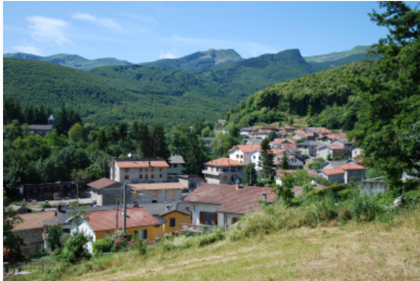
Una bella veduta del paese di Pianadetto