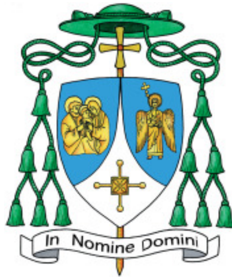
Lo stemma del Vescovo di Parma Mons. Enrico Solmi. Nello stemma sono raffigurati: la Sacra Famiglia, l'Angiol d'or e la Croce di San Geminiano di Modena