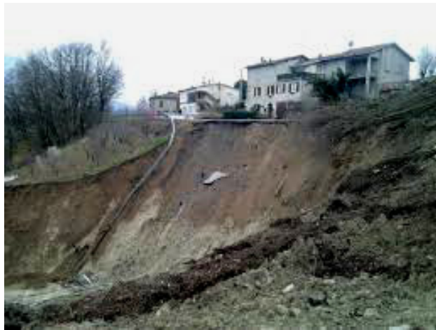
La paurosa frana di Boschetto

Valcieca che devono recarsi a Langhirano o Parma hanno tribolato non poco, in questo ultimo periodo, chi passando da Tizzano, chi da Vezzano, chi dalla Val Toccana e, i più avventurosi, persino da Scurano; un fatto che ha messo in ginocchio l'intera Alta Val d'Enza. Purtroppo in giro non si vede nessuno. Pochissima gente è transitata da Valcieca: gli spezzini e i "toschi" in generale per la crisi generale che colpisce però soprattutto quelle