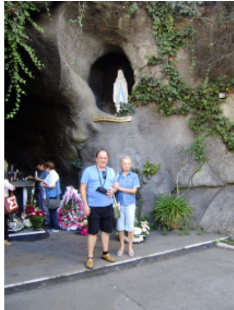
La Grotta di Lourdes a Casablanca

La nostra guida, del posto, ci aveva assicurato che da anni questa popolazione conviveva nel rispetto vicendevole e in pieno accordo. Non ci sono mai stati screzi, incomprensioni o difficoltà alcune originati dalle diversità religiose. Il messaggio di queste righe è l'augurio sincero che questi comportamenti sociali, imperniati sulla tolleranza ed il rispetto reciproco, sia nell'ambito religioso che etnico, possano rafforzarsi ed estendersi col tempo anche a quei paesi fondamentalisti e dittatoriali perché la libertà dell'individuo è un diritto sacrosanto ed innegabile per ognuno di noi..