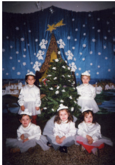
Gli "angioletti" sotto l'albero

"E' un tempo di gestazione, durante il quale i genitori e la Chiesa vivono con i bambini e per i bambini. Dio non lascia soli i genitori nell'educazione dei figli; li aiuta con la sua presenza e la sua grazia". (Conferenza Episcopale Italiana - La-