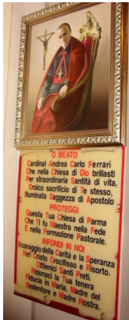
Il ritratto e la preghiera al Beato Andrea. Ferrari

(I dati qui riportati sono frutto di una ricerca di Don Enrico Dall'Olio ed elaborati da Giacomo Rozzi)