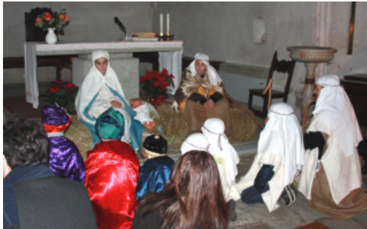
Una scena del Presepe vivente a Palanzano

Ogni scena è stata accompagnata da suggestive musiche, alla luce di candele che illuminavano la chiesa, mentre il narratore scandiva le parole pronunciate da ogni personaggio. Ad adorare il Signore, a fianco dei pastori e dei Magi, si sono inchinati anche personaggi