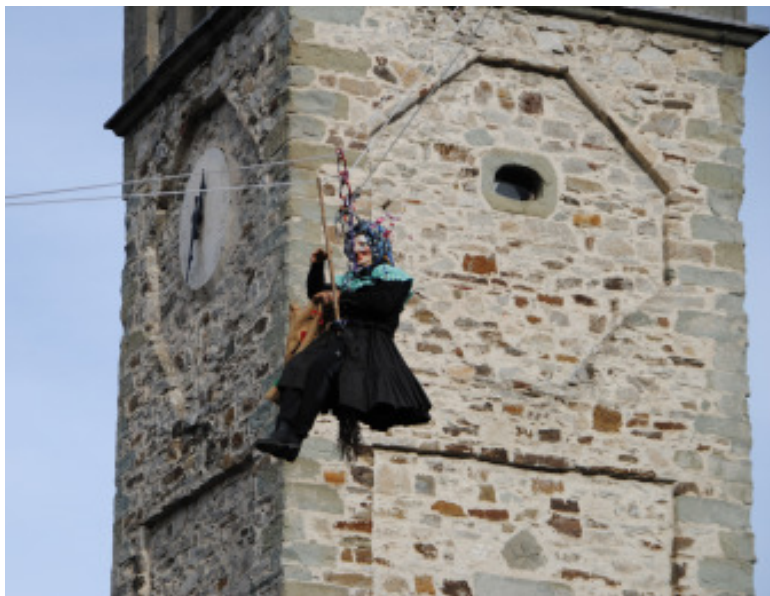
La Befana arriva dall'alto del campanile di Palanzano