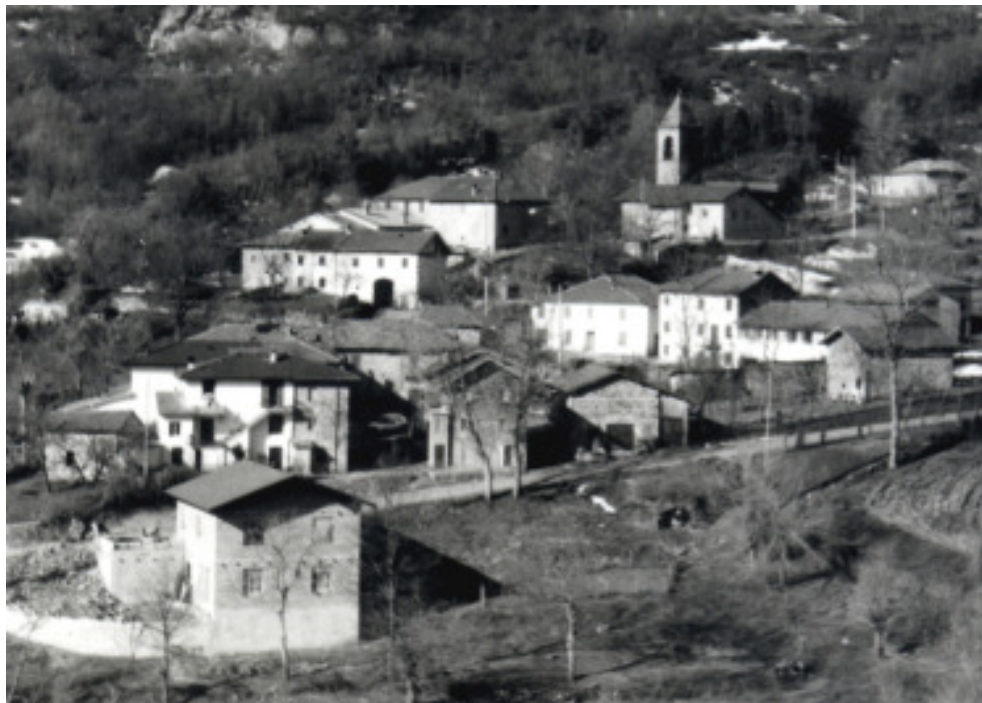
Una veduta panoramica del paese di Ceda

es raduna el popolasc pr'anch'o gh'fascia la grasia santa la via ch'la pasa ben distante e che quell dala palina en-t-el nostre o ne sconfina. Po' tè fulmina col sindich del Prà ch'on vala gnan un butalà e vòj ciapal pr'el barbosal e tiral giù pr'el canal. Fortunada me' sorela che la pasa ala Borela tuta drita, tuta sana e mè chì en-t-una frana; con el pont ed Migliola con 'na gamba che ghe scrola e po' gh'ò sor el lagh di Lamon ch'o gh'à sempre el cagaron!