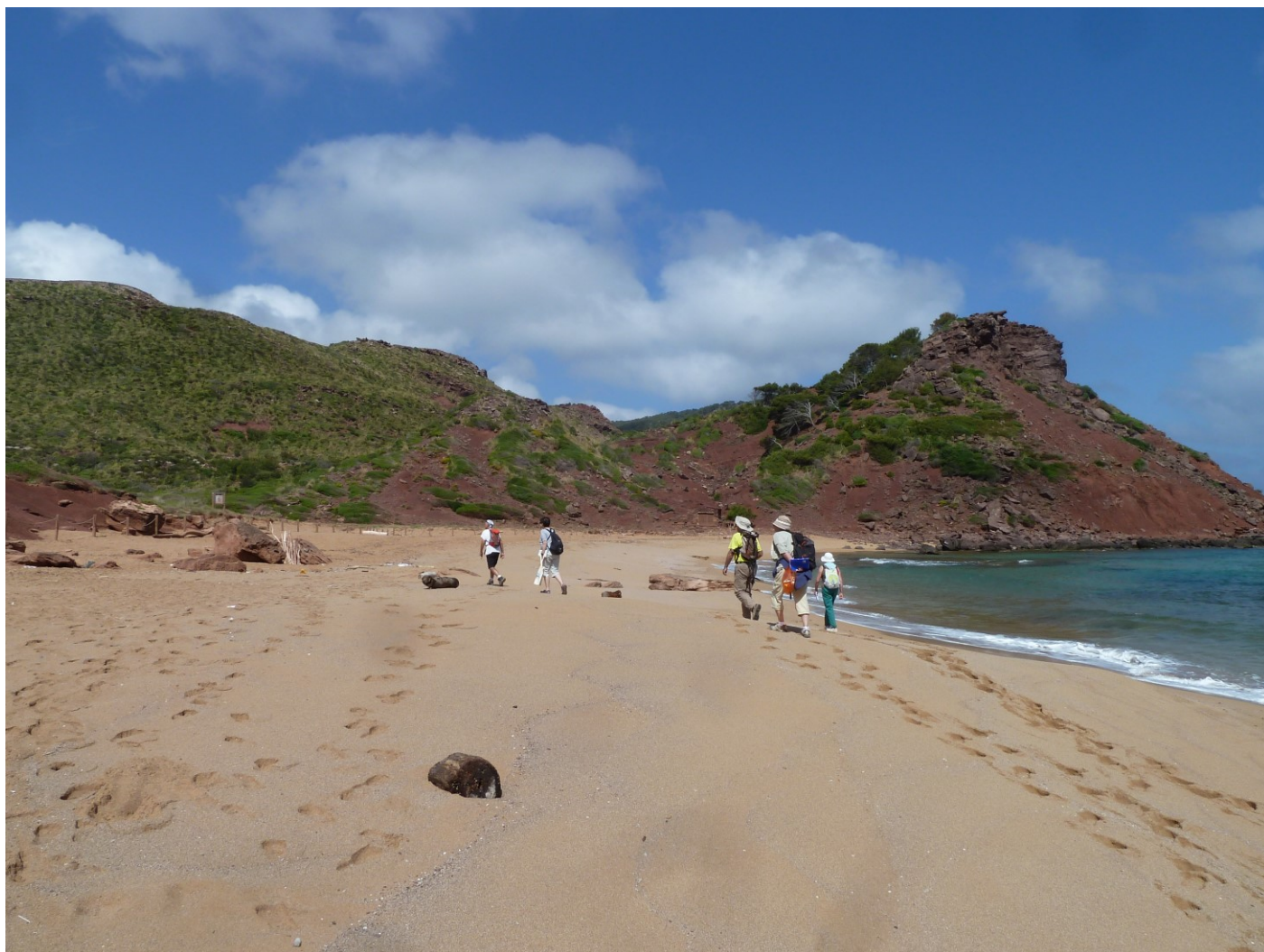
Cala del Pilar