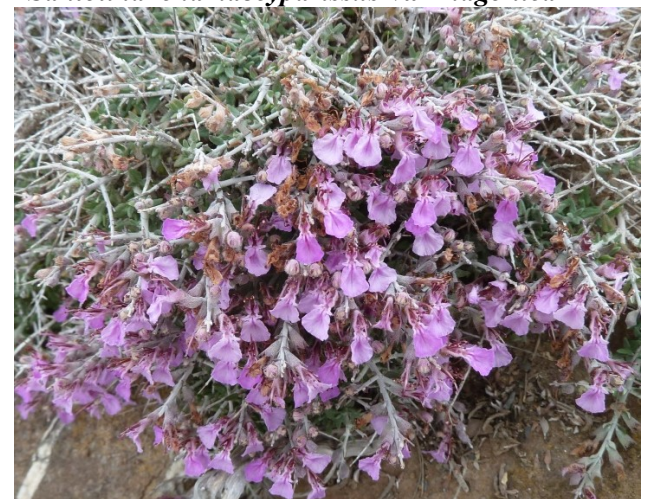
Teucrium marum subsp. spinescens