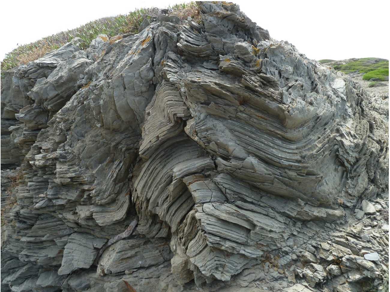
Roches plissées proches du Cap Favaritx