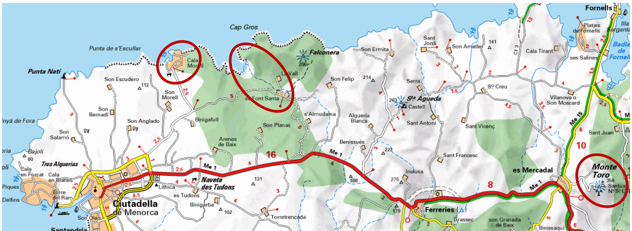
Lundi : plages et dunes d'Algaiarens, Bassa Verde, Cala Morell et nécropole, Monte Toro