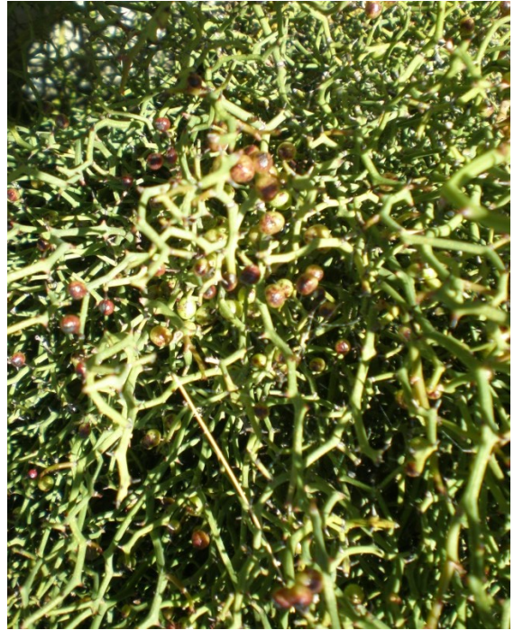
Smilax aspera var balearica