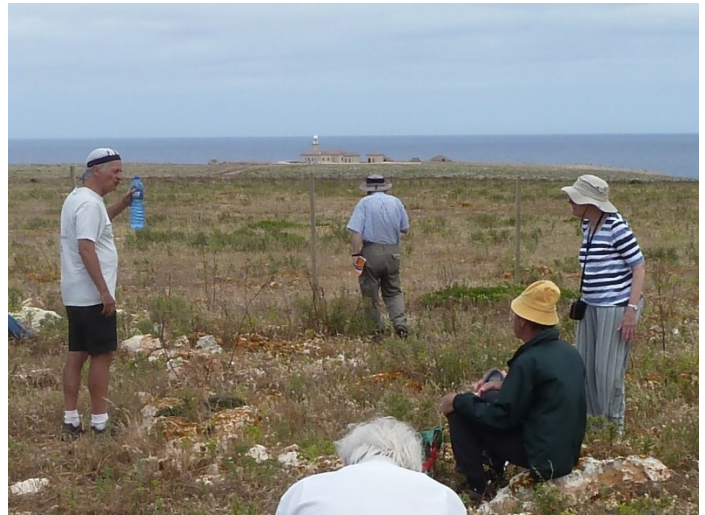
Punta Nati : repas