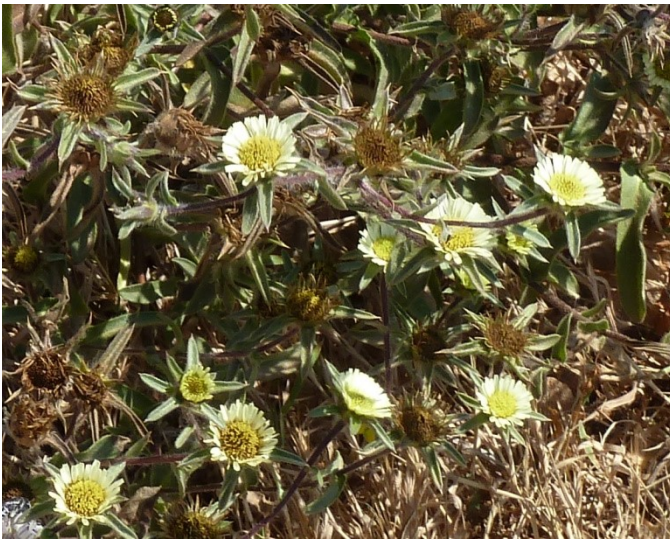
Pallenis spinosa var gymnesica