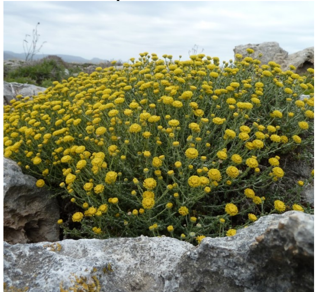
Santolina chamaecyparissus var magonica