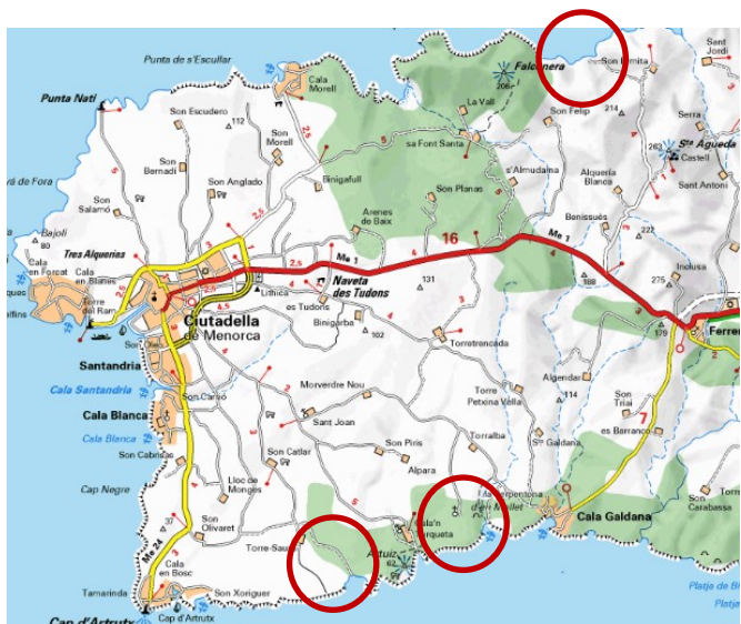
Jeudi : Cala del Pilar , Arena Son saura et cala Macarella