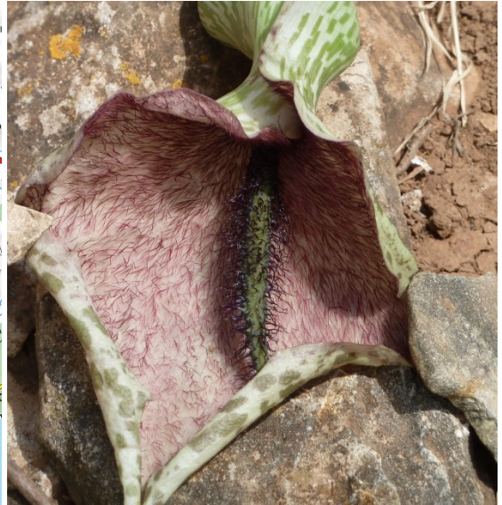
Mardi : Son Olivaret, Punta Nati, Naveta de Tudons, Torrellafuda Dracunculus muscivorus