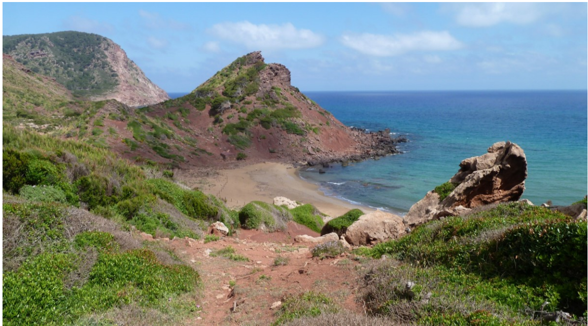
Cala del Pilar