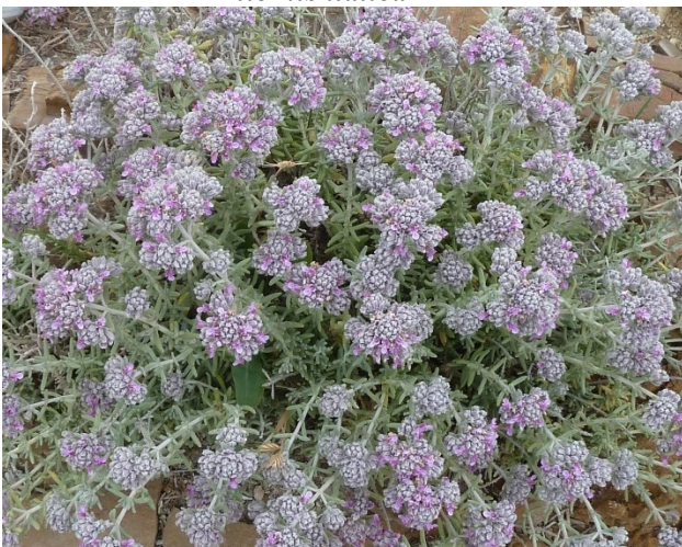
Teucrium capitatum subsp. majoricum