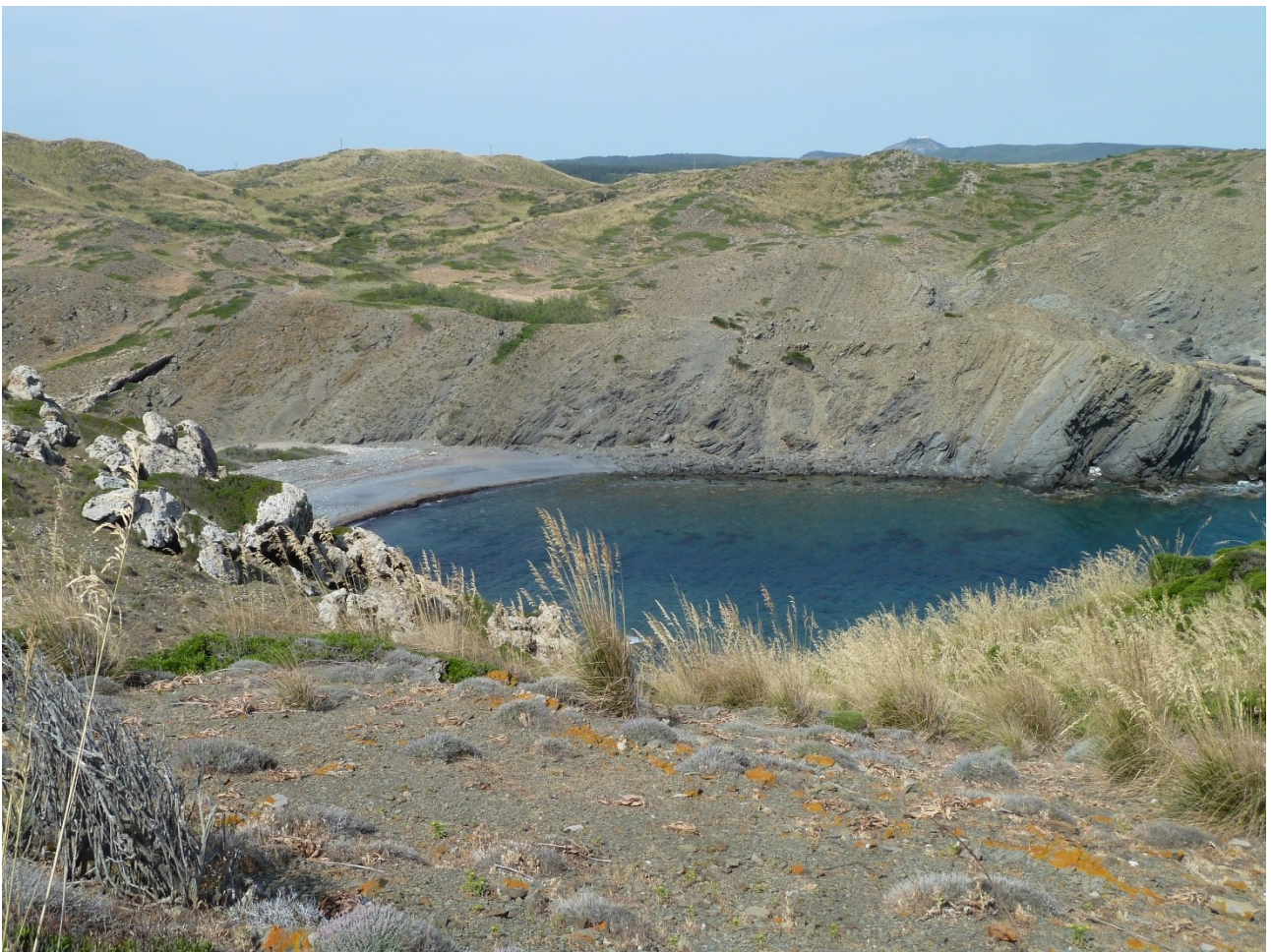
Vue sur Pou d'en Caldès et Cala Caldes avant la descente