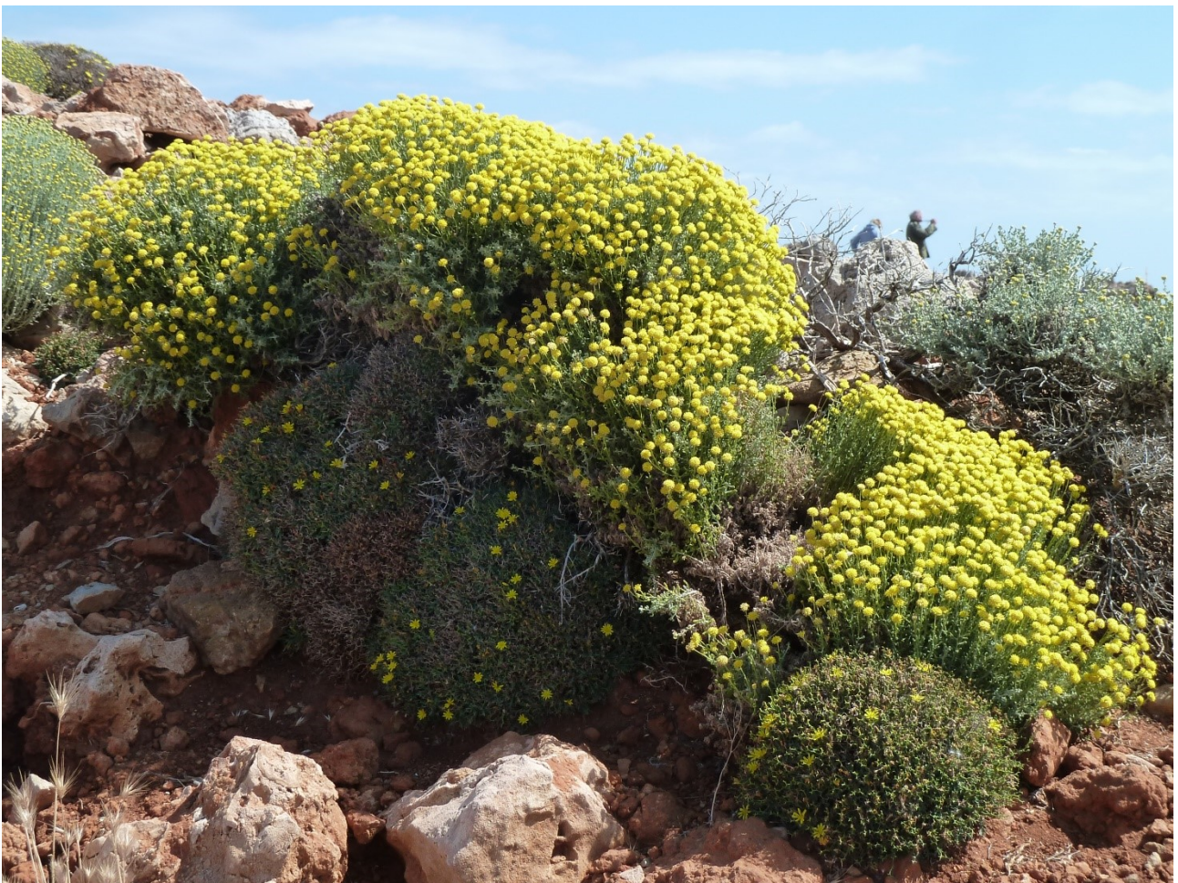
Santolina chamaecyparissus ssp. magonica et Launaea cervicornis