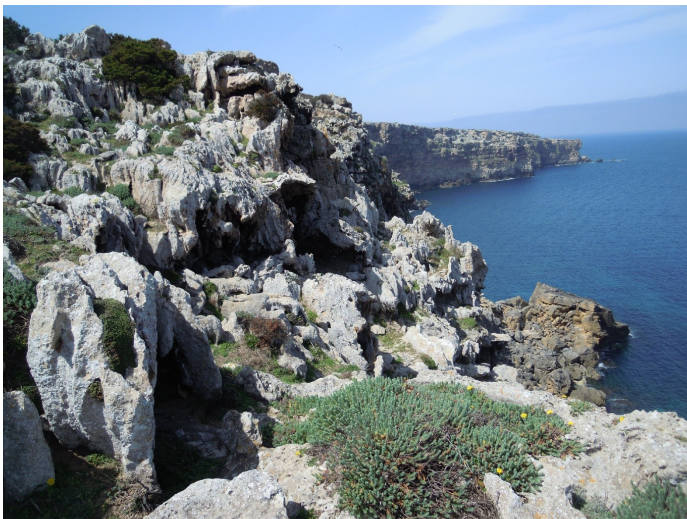
Cala Morell vue des falaises nord-ouest après les mares temporaires