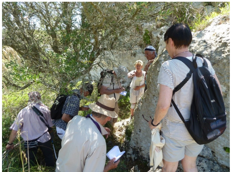
La recherche de Cymbalaria fragilis et Teucrium asiaticum