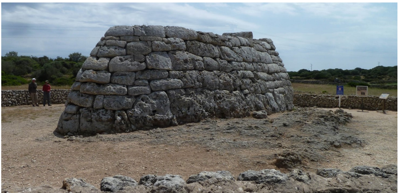
Naveta des Tudons