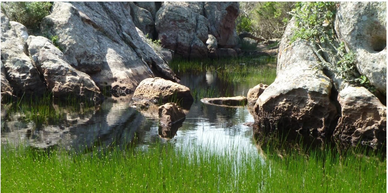
Bassa Verde altitude : 123m