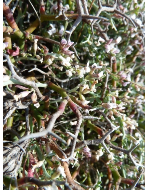
Dorycnium fulgurans en coussin et détail