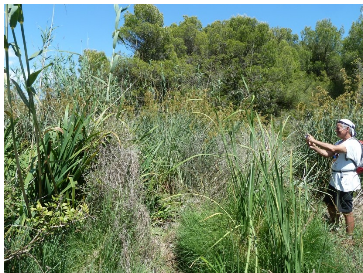
Zone humide de Son Saura