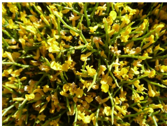
Anthyllis hystrix en coussin et détail