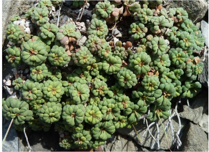
Limonium minutum endémique des Baléares