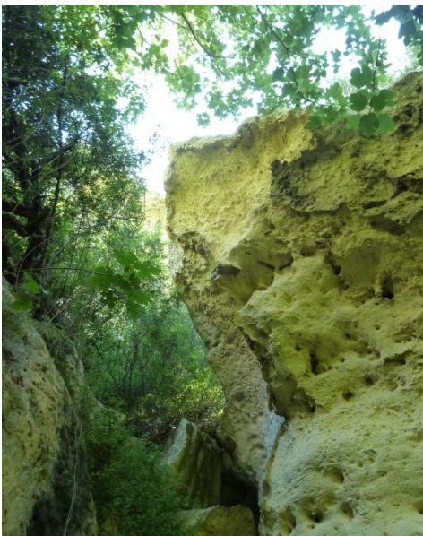
Dans le Pas d'en Revull