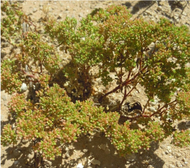
Polycarpon polycaroides subsp. colomense