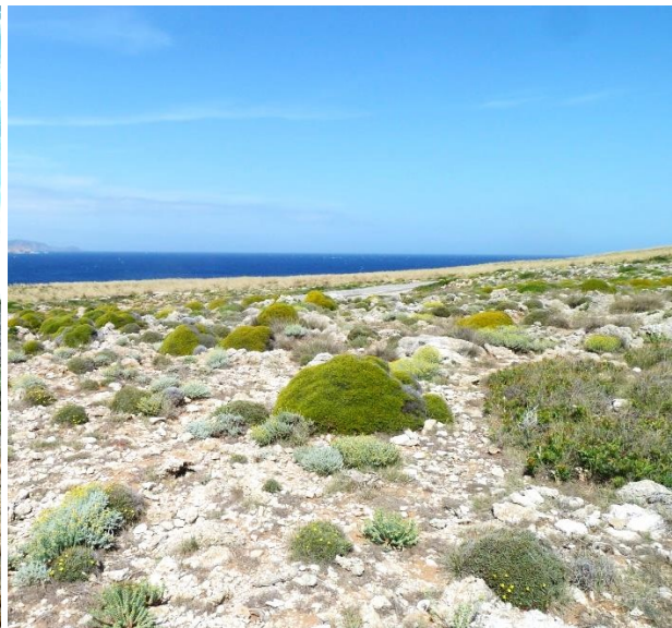
Les plantes en coussin (pulviniforme) proches du rivage soumis aux vents et aux embruns