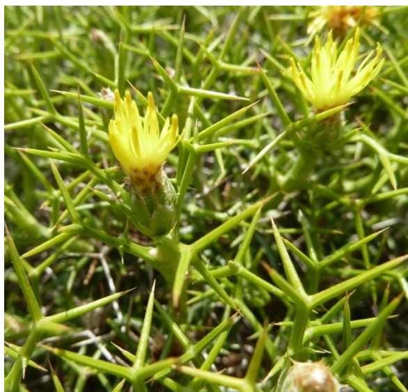
Femeniasia balearica = Carduncellus balearicus = Centaurea balearica