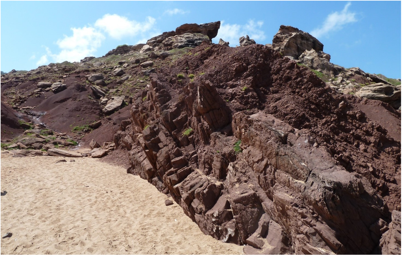
Les grès rouges du Permien à la Cala del Pilar