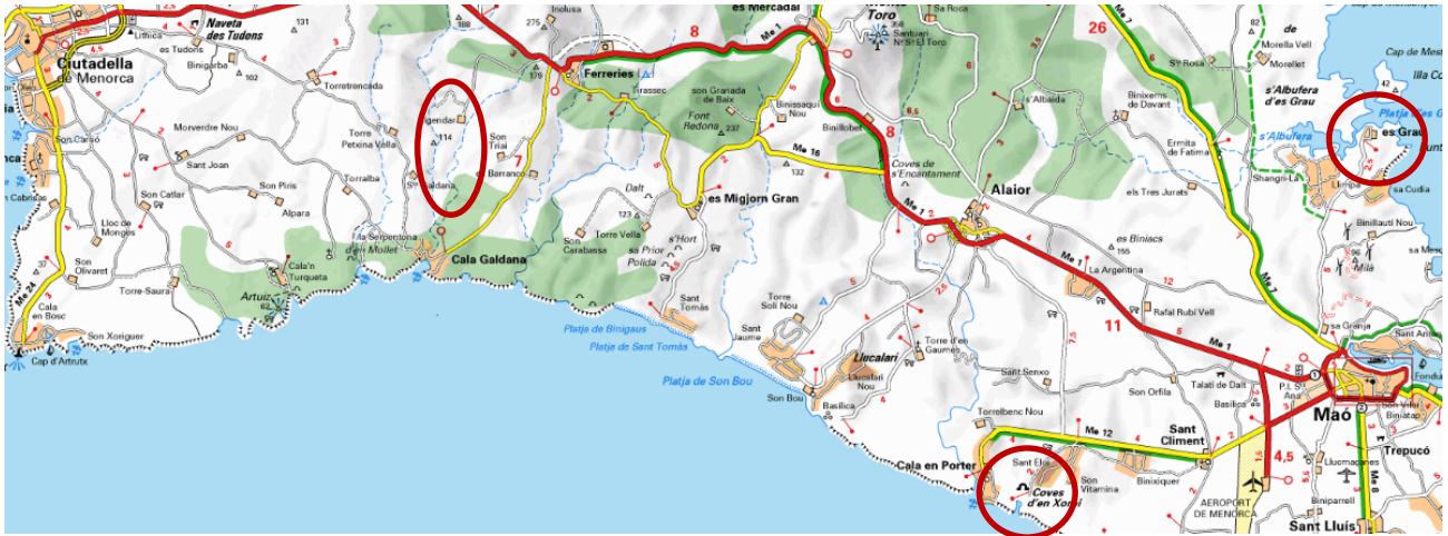
Vendredi : Barranc d'Algendar, Pas d'en Revull, repas à Es Grau, puis visite de Calescoves