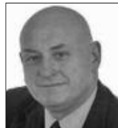
Hywel Williams Aelod Seneddol Etholaeth Arfon