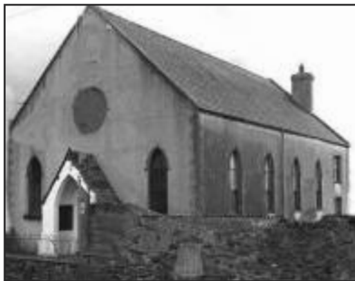
Capel Bethel, Rachub

Mam eglwys y Bedyddwyr yn Nyffryn Ogwen oedd Capel y Tabernacl a godwyd ym 1866 y tu cefn i'r Gornal ar y Stryd Fawr ym Methesda (ac a losgwyd yn ulw, fe gofir, ym 1998).