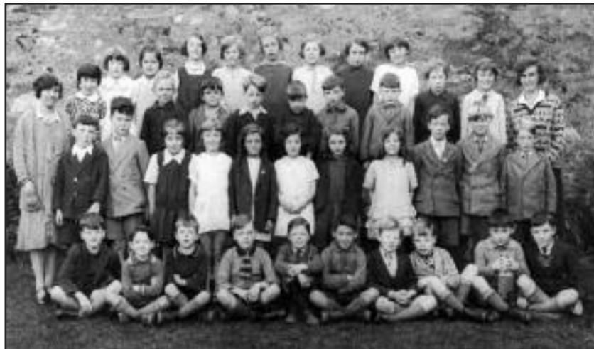
Dyma ddau lun a anfonwyd gan Alun Davies, y naill yn dangos tîm pel-droed Bethesda Athletic ym 1949, a'r llall efallai yn dangos plant Ysgol Bodfeurig ym mis Medi, 1931. Tybed a all rhai o'n darllenwyr roddi enwau i' chwaraewyr a'r plant sydd yn y ddau lun?