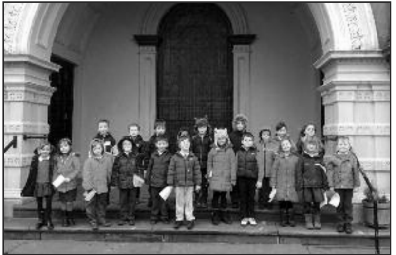
Plant Ysgol Abercaseg...??????????

Bu tîm pêl-rwyd Dosbarth Ogwen yn cystadlu yng nghystadleuaeth Pêl-rwyd yr Urdd yn ddiweddar. Dyma'r tro cyntaf i'r plant gymryd rhan yn y gystadleuaeth ac 'roedd yn brofiad gwerth chweil iddynt. Gweithiodd y plant yn arbennig o dda fel tîm, ac 'roeddent i gyd yn falch o gael cynrychioli'r ysgol a'r ysgol hefyd yn falch iawn ohonyn nhw. Da iawn chi!