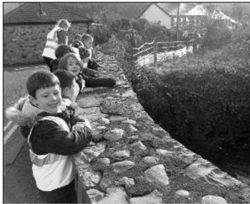
Mynd am dro ar hyd stryd Bethesda

Cynhaliwyd prynhawn agored ar gyfer y plant fydd yn dechrau yn nosbarth Meithrin yr ysgol ym mis Medi. 'Roedd hi'n braf gweld dosbarth o rieni cyfarwydd yn ogystal â wynebau newydd. Cofiwch bod angen cofrestru ar gyfer cychwyn yn y dosbarth Meithrin erbyn Mawrth 1af.