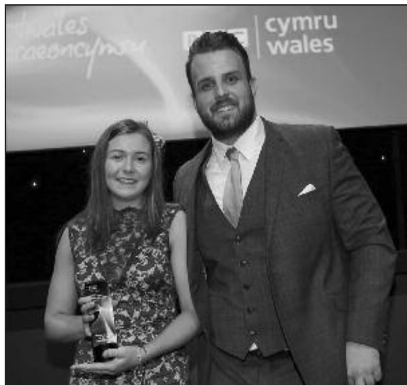
Elan gydag Aled Sion Davies, enillydd medalau aur ac efydd gemau Paralympic Llundain 2012

Cynhaliwyd gwasanaeth i'r ysgol gyfan i gofio am y 6 miliwn o bobl a gollodd eu bywydau yn yr Holocaust. Ionawr 27ain 1945 oedd y diwrnod y cyrhaeddodd milwyr Rwsia wersyll Auschwitz, a chael sioc enfawr wrth weld yr hyn oedd yn eu hwynebu. Erbyn hyn, mae Ionawr 27ain yn ddiwrnod i gofio am yr erchyllterau a ddigwyddodd yn Auschwitz a gwersylloedd tebyg, ac yn arbennig i gofio am y