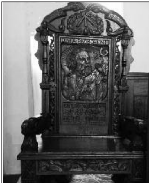
Cadair Eisteddfod Bethel, Rachub 1900