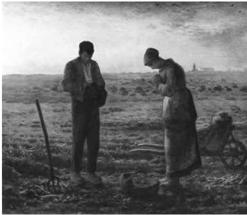
'L'Angelus' gan Jean-Francois Millet (1859)