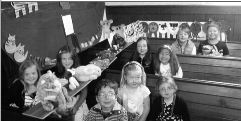
Dyma rai o aelodau'r Ysgol Sul gyda'u gwaith llaw ar thema Arch Noa.