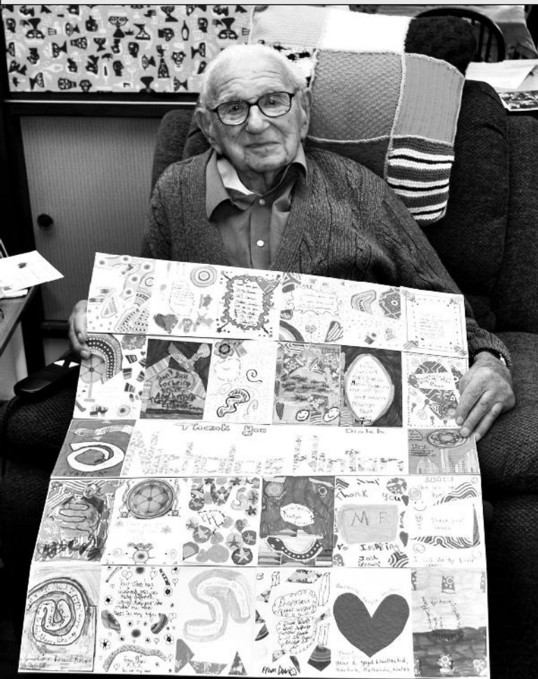
Syr Nicholas Winton, y "Schindler Prydeinig" a achubodd 669 o blant rhag yr Holocost yn dal ei gerdyn gan ddisgyblion Ysgol Llanllechid.