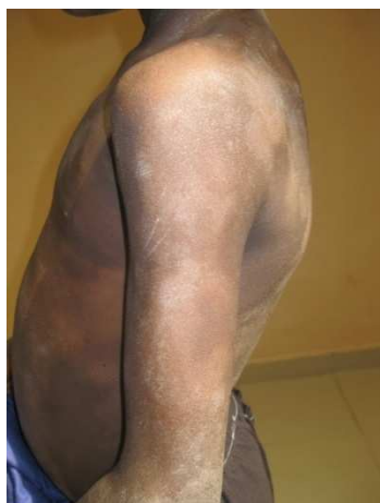
Figure 3 : Eczématides ou dartres : macules hypochromiques squameuses, « aspect de peau sèche »