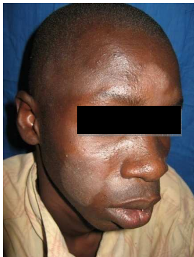
Figure 2 : Dermite séborrhéique.