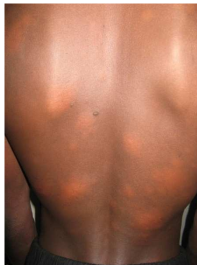
Figure 5 : Lèpre multibacillaire : Macules hypochromiques cuivrées et infiltrées du dos.