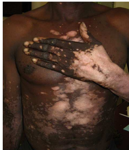
Figure 4 : Vitiligo : macules hypochromiques avec « aspect blanc laiteux »