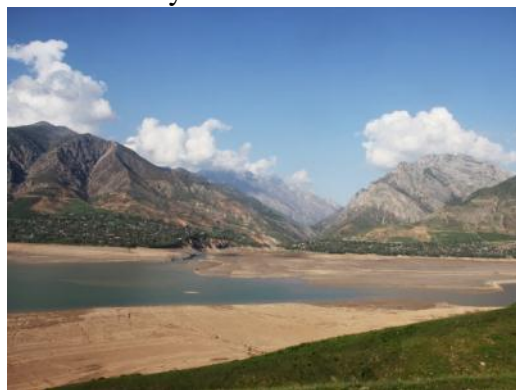
Le reservoir d'eau Charvak