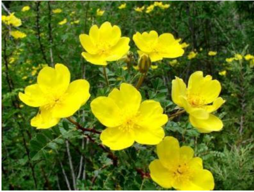
Rosa divina (kokanica)