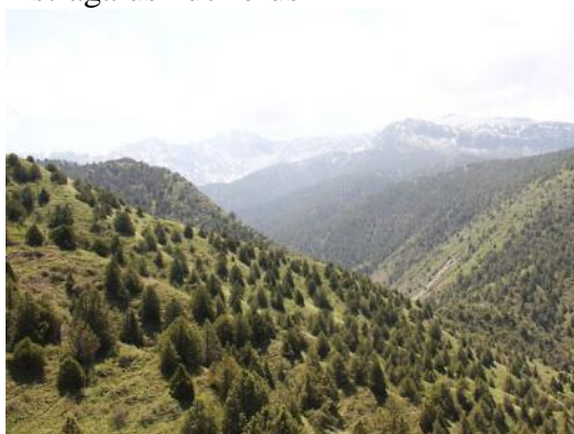
Le parc national Zamin