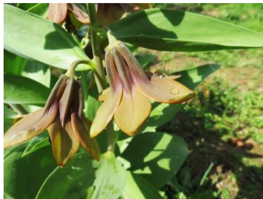
Fritillaria (Korolkowia) sewerzowii