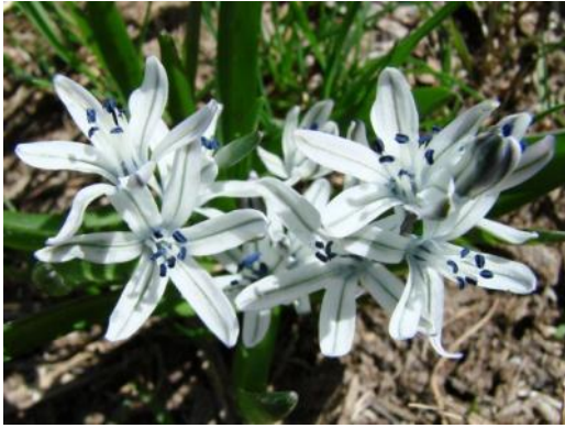
Fessia (Scilla) puschkinioides