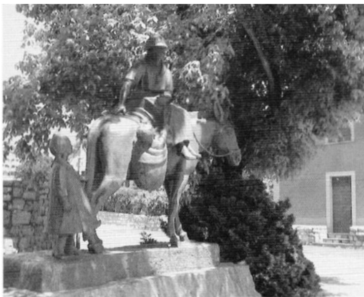
MAULTIER-DENKMAL IN SITTEN GESTIFTET VON: „LES AMIS DE MULET“

Ein Maultier ist das Kreuzungsprodukt eines Eselhengstes und einer Pferdestute. Ein Maulesel ist das Kreuzungsprodukt eines Pferdehengstes und einer Eselstute. Äusserlich sind sie nicht zu unterscheiden. Der eine Weg festzustellen, ob es sich um einen Maulesel oder um ein Maultier handelt, ist das Tier mit Eseln und Pferden auf die Weide zu stellen und zu beobachten, zu welcher Gruppe es sich hingezogen fühlt. Ein Maulesel geht immer zu den Eseln, ein Maultier gesellt sich zu den Pferden.