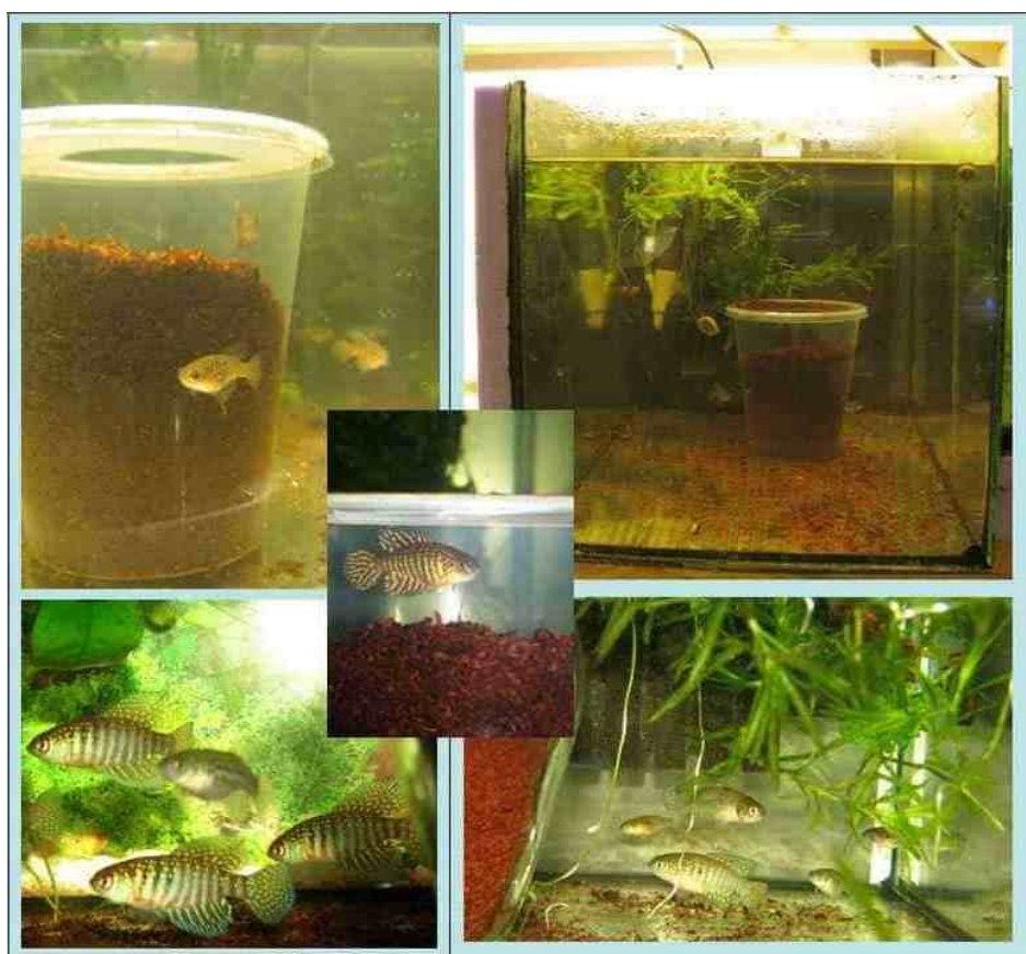
Hypsolebias kweek opstelling

Over voer: Ze accepteren bevroren voer zoals bevroren rode en zwarte muggen larven, maar als je ze echt gelukkig wil maken dan geef je ze levend voer. Ze eten veel, maar wees voorzichtig dat je ze niet overvoerd. Ik heb wat problemen gehad met verlate buik schuivers. Dit gebeurde na zeer zware maaltijden toen ze al volwassen waren.