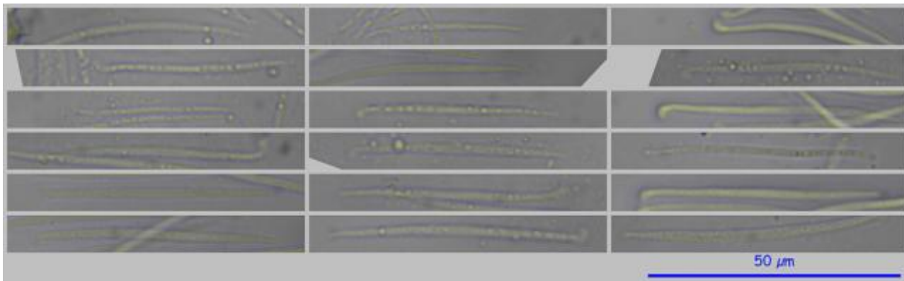
B. Esporas en Agua. 600x.