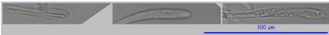
A. Ascas en Agua. 400x.

Ascas cilíndricas, ensanchadas en el ápice, hialinas, no amiloides y octosporicas. Ascosporas filiformes, curvadas en uno de los extremos y apuntadas en el otro, hialinas, plurigutuladas y de (38.71) 40.17 - 49.39 (52.92) x (1.34) 1.62 - 2.56 (2.73) \mu\text{m} ; Q = (16.36) 18.62 - 28.46 (29.87); N = 22; Me = 45.64 x 1.97 \mu\text{m} ; Qe = 23.73. Paráfisis filiformes, muy poco ensanchadas y recurvadas en el ápice. Excípulo formado por células esféricas.