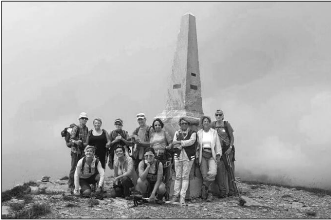
3.7.2016 - Monte Saccarello