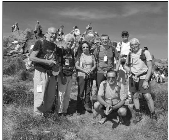
10.9.2016 - Mare e Monti di Arenzano