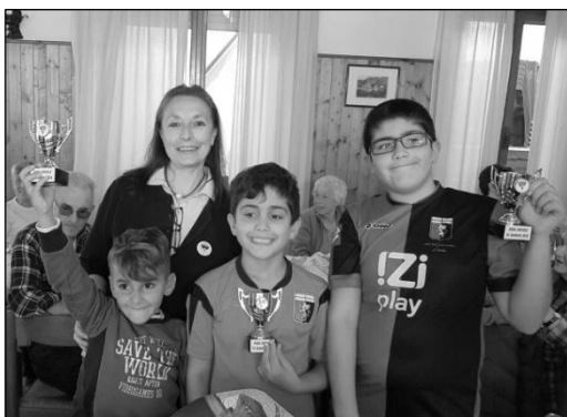
Gli impegnatissimi nipotini terribili!