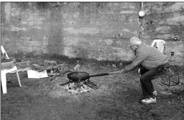
6.11.2016 - Castagnata a Fontanegli