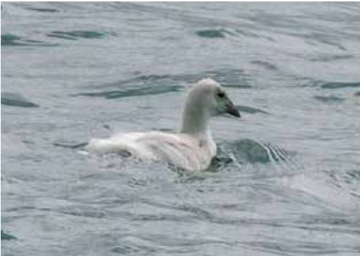
Abb. 20: Leucistisches Bläßhuhn auf dem Haarener Baggerseen HAM, 30.08.2009.