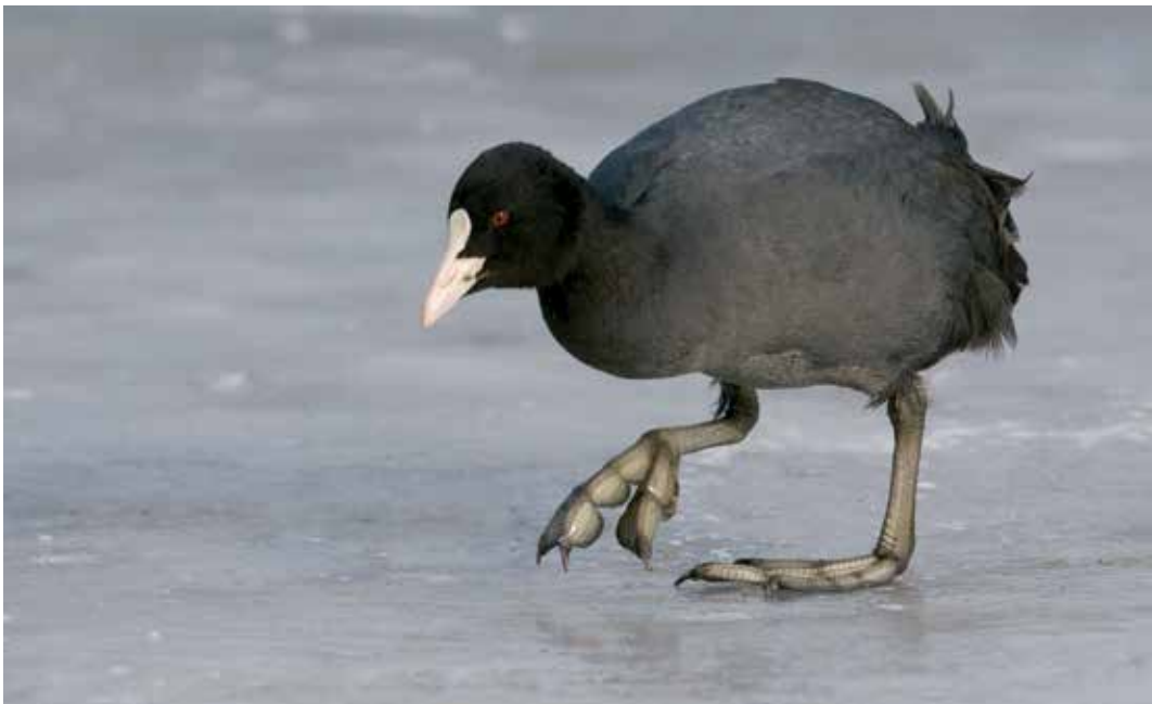
Abb. 19: „Spikes“ und breite Füße helfen bei Glatteis: Blässhuhn im Februar 2009 auf dem vereisten Aasee in Münster. Eurasian Coot on ice, Aasee in Münster.

Mind 3 besetzte Reviere NSG Recker Moor, Recke ST (BSt ST) < 24.3. eine im NSG Lanstroper See DO, dort auch eine am 2.4. (kük) < 12.4. eine rufend Klärteich Arnsberg-Wildshausen HSK (wiw, hek) < 18.4. eine im LSG Lippewiesen (pow) < 2.5. 6 Rufer max Rieselfelder Münster MS (eff, lah) < 2.-5.5. eine NSG Engerbruch HF – erster Nachweis seit 1998 im Kreis Herford (möe, mep, coc, nip) < 2.5. eine rufend Griethauser Altrhein, Rees KLE (dod, bif, ban u.a.) < 19.5. ein Rufer im NSG Ahsewiesen SO (frw) < Anfang Juli Totfund eines Jungvogels Unteres Eggeltal HX (löm, bei) < 11.8. eine Bedburger Klärteiche, Bedburg BM (seg, klh, huk), dort auch eine am 30.8. (eup) < 18.8. 2 Bedburger Klärteiche, Bedburg BM (wyk) < 30.8. eine alter Klärteich bei Tönisheide, Velbert ME (böck) < 30.8. eine an den Scheringteichen im Radbodseege-