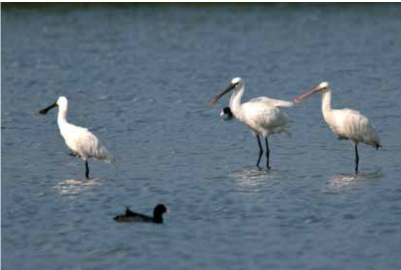
Abb. 13: Löffler, Eurasian Spoonbill , Rieselfelder Münster, Aug 2009.

Zahlreiche Beobachtungen landesweit, von denen nicht alle aufgezählt werden können. Erwähnenswert sind: im Kreis Minden-Lübbecke 69 Beobachtungen, zusätzlich 19 Ind am 31.8. in der Windheimer Marsch Petershagen Windheim (moe), 28 Ind dort am 20.9. (koc, scd), 23 Ind dort am 12.10. (koc), 19 Ind dort 13.11. (koc), 17 Ind am 14.9. Petershagen-Hävern (koc), 11 Ind im Oktober Weseraue Porta Westfalica (mum, haj), 16 Ind am 8.12. Petershagen-Lahde und 14 Petershagen-Frille (offenbar jeweils Schlafplatz) (koc) \diamond bis Mai 30 Beobachtungen, ab September 39 Beobachtungen