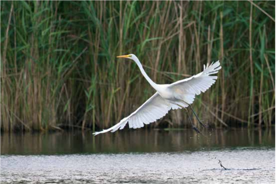
Abb. 14: Auch 2009 gab es landesweit wieder zahlreiche Silberreiherbeobachtungen - hier ein Ind in den Rieselfeldern Münster, Mai 09.

As in previous years, many Great White Egrets were recorded in NRW in 2009 - this bird chose the Rieselfelder Münster.