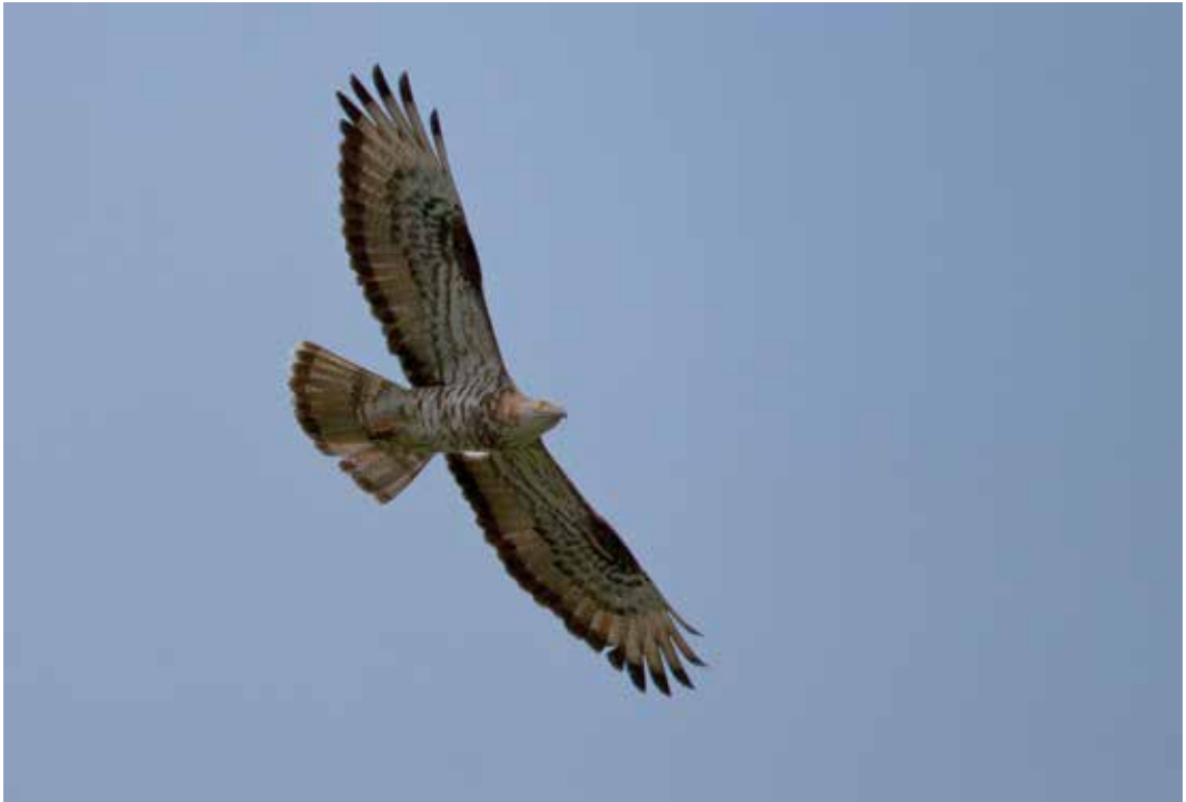
Abb. 17: Wespenbussard, European Honey Buzzard , Rieselfelder Münster, Mai 09.