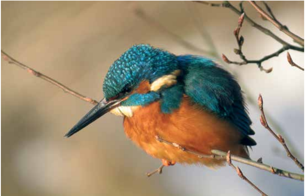
Abb. 27: Eisvogel, Common Kingfisher , Kemnader See BO, 10.01.2009.