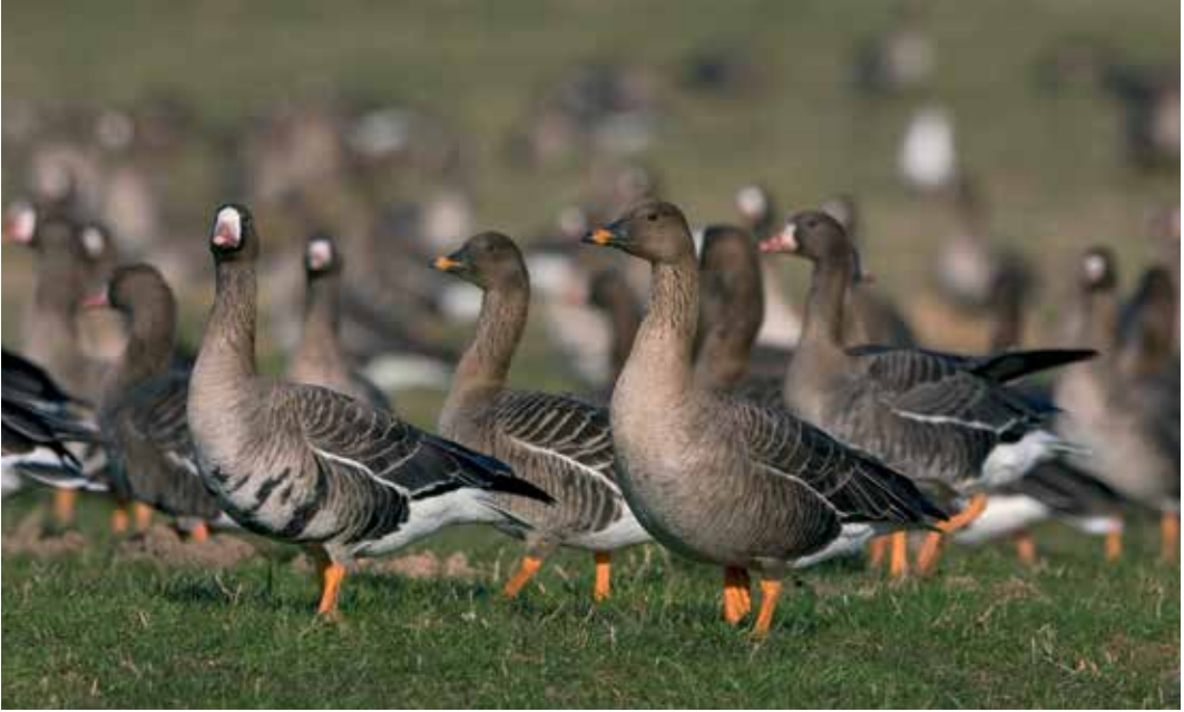
Abb. 5: 2 Tundrasaatgänse unter Blässgänsen, Tundra Bean Geese with Greater White-fronted Geese, Niederrhein WES, 17.02.2009.

1.1. eine dz Richtung W Kläranlage Arnberg-Wildshausen, HSK (wiw hek) \diamond 22.1.-22.2. max 3 am NSG Ruhrstau Wickede-Echthausen SO (wiw, hek) \diamond 23.2. ein Männchen, ein Weibchen und eine vorj am NSG Ruhrstau Wickede-Echthausen SO (wiw,