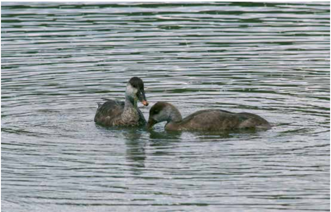
Abb. 9: Eine Kolbenente, Red-crested Pochard, zog auf dem Schulte-Stratmann-See bei Lippstadt, SO erfolgreich Junge groß, 14.7.2009.