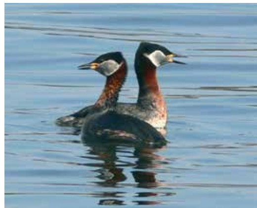
Abb. 11: Balzende Rothalstaucher sind in NRW ein seltener Anblick! Möhnesee SO, 16.04.2009.

55-56 Bp mit 90 juv im HSK (Erfassungsgrad 100%) (OAG HSK, Artbearbeitung wiw) < 12.7.-11.8. ein ad Ind auf den Klärteichen Bedburg BM ernährte sich fast ausschließlich von Wasserfrös-