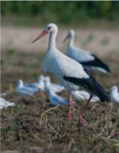
Abb. 16: Weißstorch, White Stork , Münster Aug 09.

19.3. einer dz über dem NSG Dellwiger Bach DO (osf) < 26.3. einer Hürther Waldsee, Hürth BM (shj) < 29.3. einer ziehend Benfe SI (frm) < 29.3. einer nach N ziehend über dem Hauptbecken Hennesee bei Meschede-Berghausen HSK (wiw, hek) < 31.3. einer Klinkum, Wegberg HS (tem) < 31.3. einer dz am Kemnader See BO/ Witten EN (sac), dort auch je einer dz am 15.4. (sac, rat, weh), am 4.5. (sco) und am 9.8. (sac) < 2.4. einer dz Uentrop Wald HAM (kög, kow) < vom 3.4.-31.5. insgesamt 42 Ind und vom 29.7.-6.10. insgesamt 25 Ind allein an den Krickenbecker Seen, Nettetal VIE (meist dz) (OAG Kreis Viersen) < 10.4. einer dz Kraftwerk Uentrop HAM (run) < 19.4. 2 Aldenhoven DN (sra), dort auch einer am 17.8. (bog) < 28.4. einer dz im NSG Hattingen Winz EN (sci) < 29.4. einer dz Radbodseegebiet HAM (huj), dort auch einer am 16.8. (sem), am 5.9. (heh), am 12.9. (pow) < 7.8. einer über Hattingen EN (grt) < 13.8. einer Erndtebrück-Schameder SI (hof) < 16.8. einer Weidenhausen SI (pos) < 24.8. 2 NSG