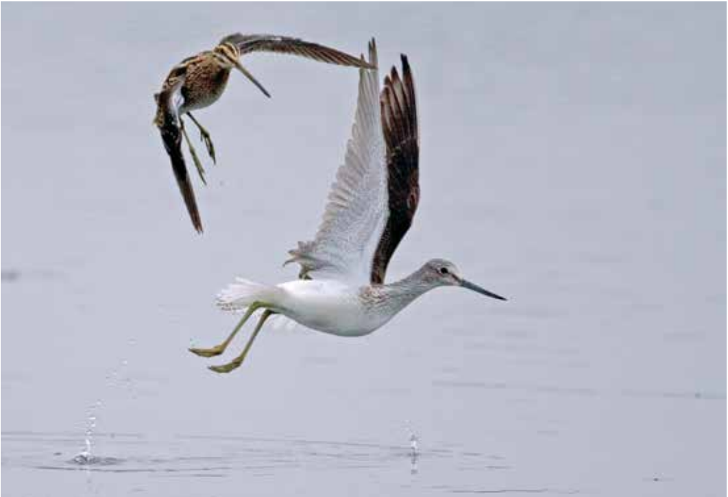
Abb. 25: Grünschenkel, Common Greenshank , mit Bekassine, Common Snipe , Rieselfelder Münster, Aug 2009.