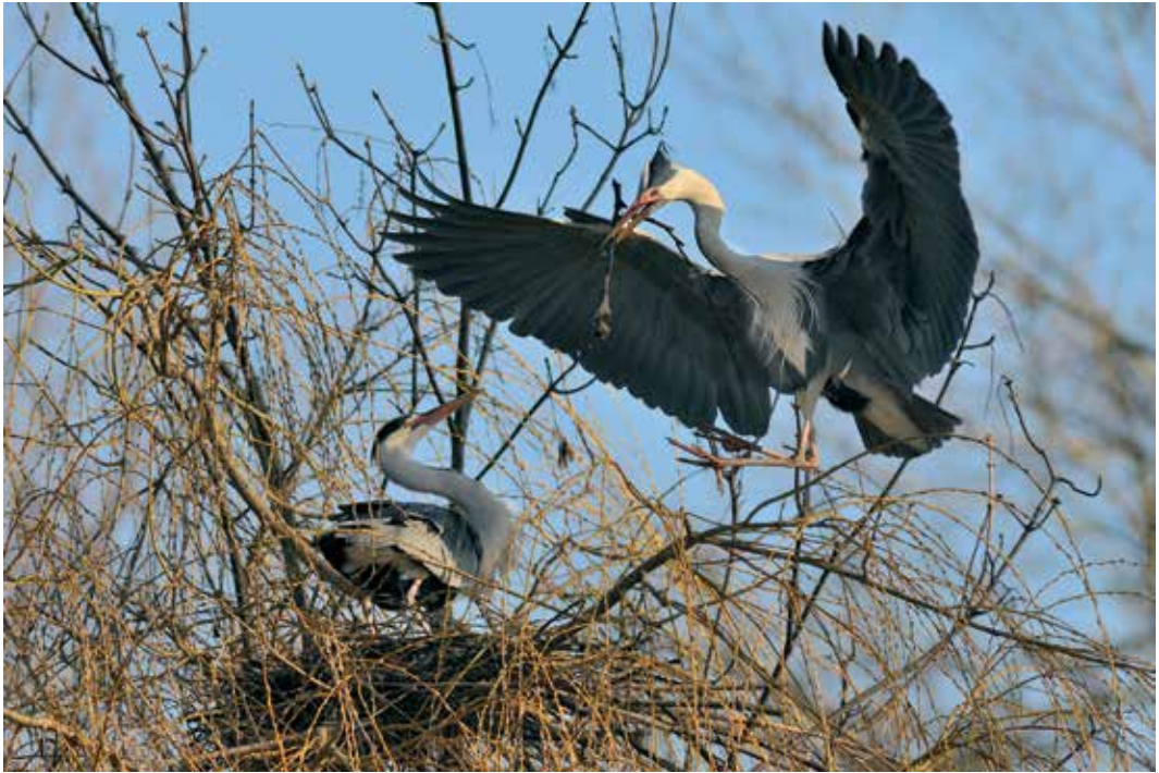
Abb. 15: Graureiher sind vielerorts in NRW inzwischen zum fest etablierten Brutvogel geworden - hier ein Paar beim Nestbau an der Burg Konradsheim bei Erfstadt, 03.03.2009.

Grey Herons have established themselves as regular breeding birds in many areas of NRW – here a nest-building pair at Konradsheim castle near Erfstadt.