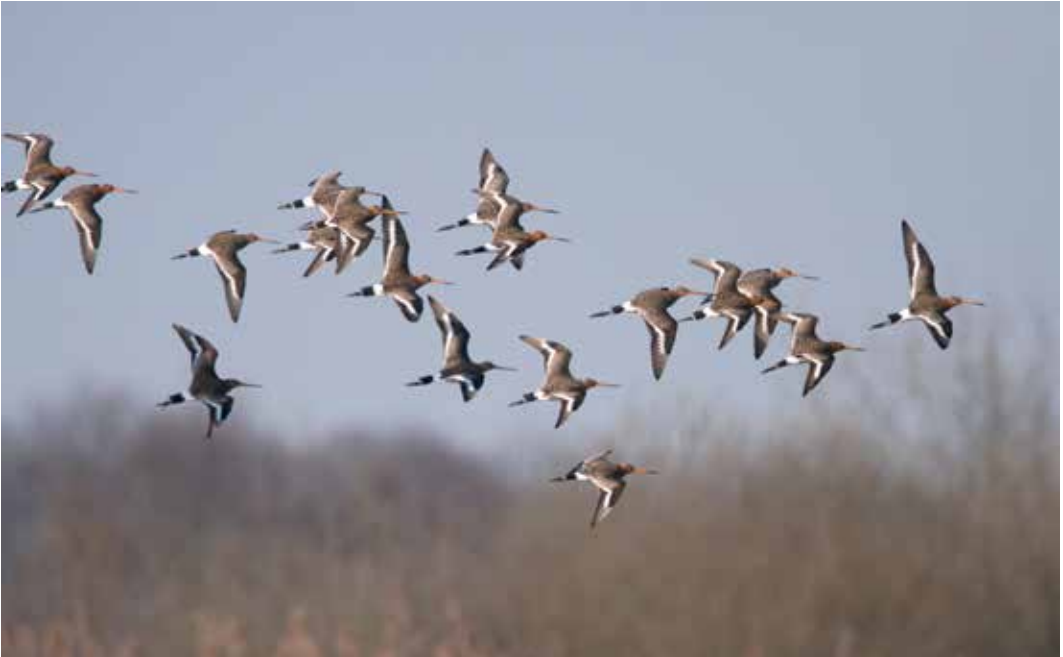
Abb. 24: Uferschnepfen, Black-tailed Godwits , Rieselfelder Münster, Mrz 2009.