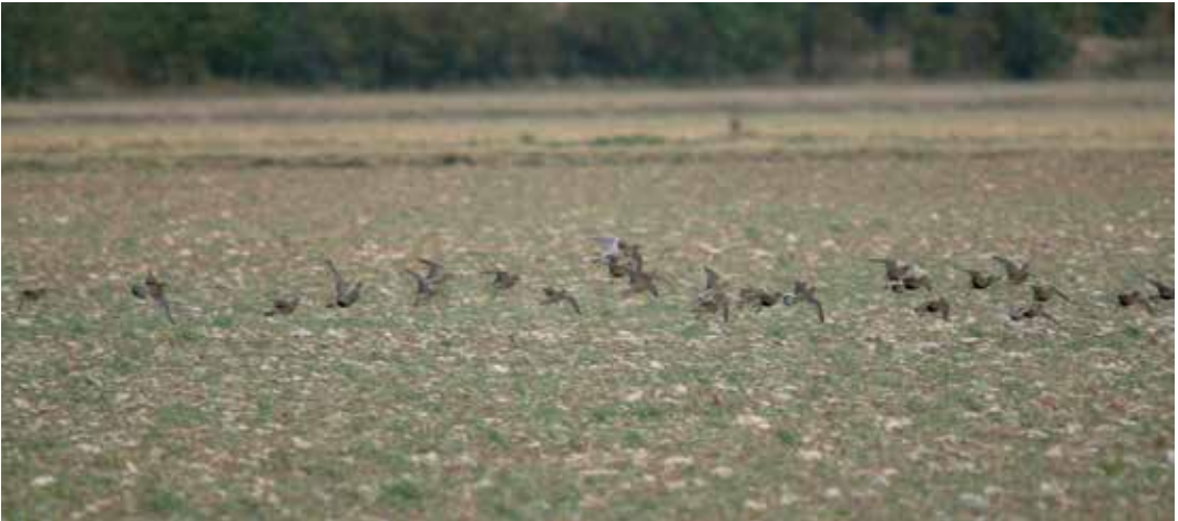
Abb. 23: 26 Mornellregenpfeifer, Eurasian Dotterel , auf einem Bild! Geseke SO, 06.09.2009.