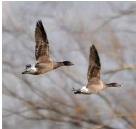
Abb. 3: 2 Ringelgänse (K1), Brent Geese, Ahsewiesen SO, 30.11.2009.