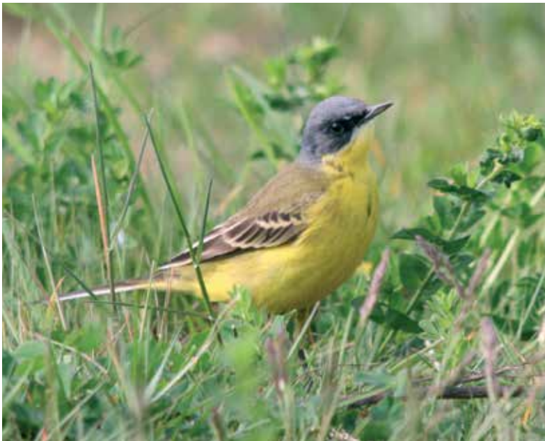
Abb. 33: Thunbergschafstelze, Grey-headed Wagtail , Windheimer Marsch ML, 15.05.2009.

2.5. 35 Ind Rieselfelder Münster MS (mbt).