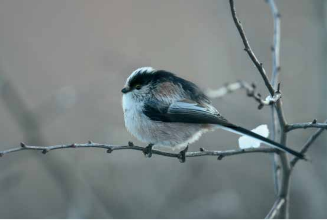
Abb. 30: Bei Kälte schützt die Kugelform: Schwanzmeise, Long-tailed Tit , in Kranenburg KLE, 06.01.2009.