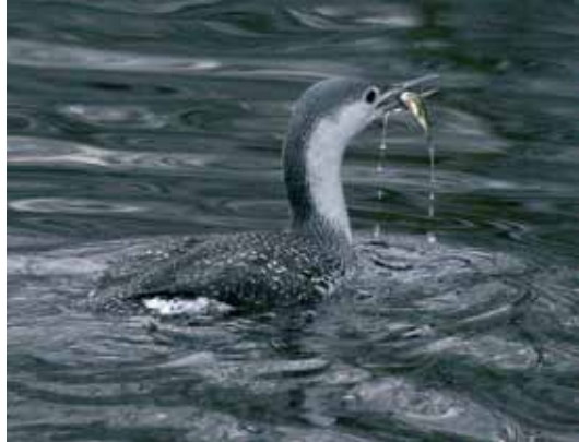
Abb. 12: Erfolgreicher Sterntaucher, Red-throated Diver , im Kurpark Werl SO, 05.01.2009.