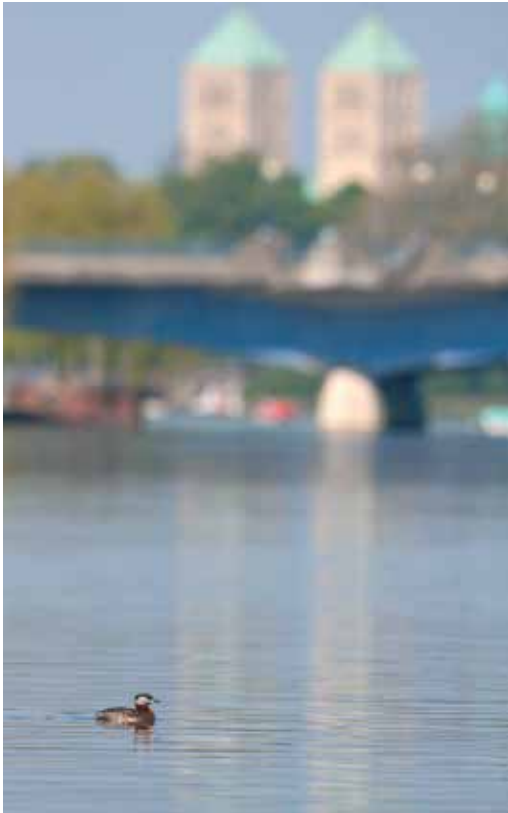
Abb. 10: Rasten in historischem Ambiente: Dieser Rothalstaucher genoss vom Aasee aus den Blick auf den Münsteraner Dom, 21.04.2009.

23-24 Bp mit mind 32 juv im HSK (Erfassungsgrad 90%) (OAG HSK, Artbearbeitung kob) < mind 3 Bruten Stallberger Teiche Siegburg SU (him) < 3 Bruten Teiche von Herrnstein, Ruppichterth SU (him) < 6 Bp Bioteiche Quarzwerke Frechen BM (shj) < 3 Bruten Pocheweiher Siegen-Niederschelden SI (amd, nmn, skl) < ein Revier Bergisch-Gladbach GL Diepeschrath (stt) < 13 Reviere Grünewaldteich Untereschbach GL (sre) < 3 Bp Teiche Herrnstein Much SU (him) < 3 Bp Stallberger Teiche SU (him) < ein Bp Grube Weiß GL (stt) < 2 Bp Windeck-Au Sieg SU (him) < 4-5 Bp auf dem Töpfersee DU, das Jahresmaximum lag hier am 13.12. bei 40 Ind (bed, mej) < mind 4 Bp im Stadtgebiet OB (tom) < 27 Bp im Stadtgebiet