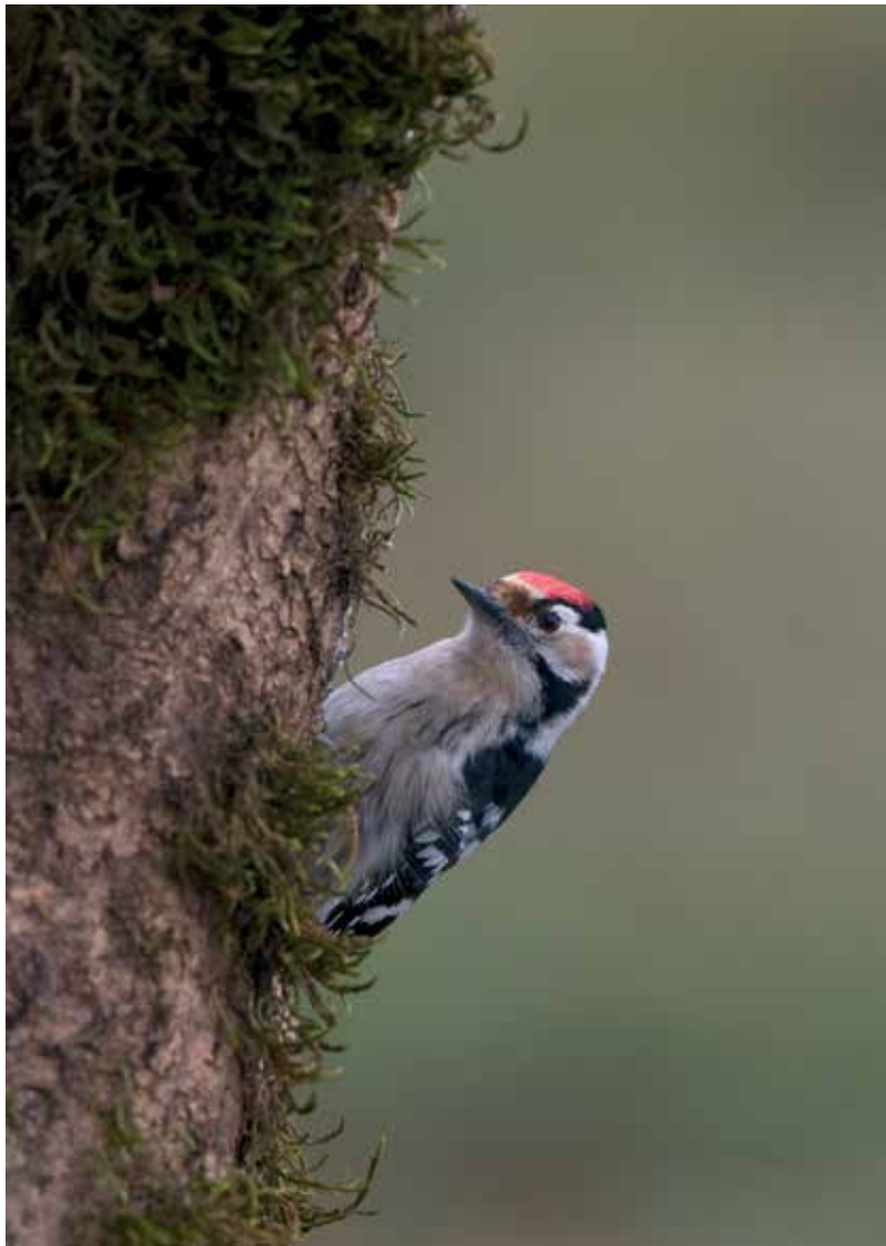
Abb. 28: Kleinspecht, Lesser Spotted Woodpecker, Dingener Heide WES, 23.03.2009.

Keine Brut/kein Brutverdacht im Kreis Herford HF