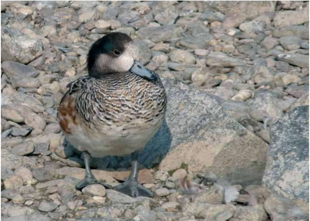
Abb. 35: Chilefeifente, Chiloe Wigeon , Mondorfer Rheinfähre SU, 19.09.2009.