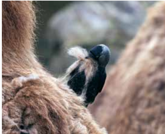
Abb. 29: Auf echtem Mohair sind die Eier weich gebettet - diesen Dohlen im Allwetterzoo in Münster dienten Kamelhaare als Nistmaterial, Apr 2009.

Western Jackdaw taking camel hair as nesting material at Münster Allwetterzoo.