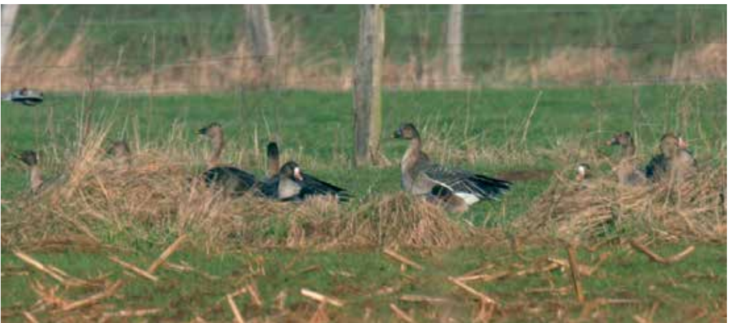
Abb. 6: Diese Tundrasaatgänse (zusammen mit einigen Blässgänsen) sorgten aufgrund ihrer großen Schnäbel für Verwirrung und wurden teilweise als Waldsaatgänse angesprochen, nördlich Isselburg BOR, 26.01.2009.

Due to their large bills, these Tundra Bean Geese caused some confusion and were identified by some as Taiga Bean Geese.