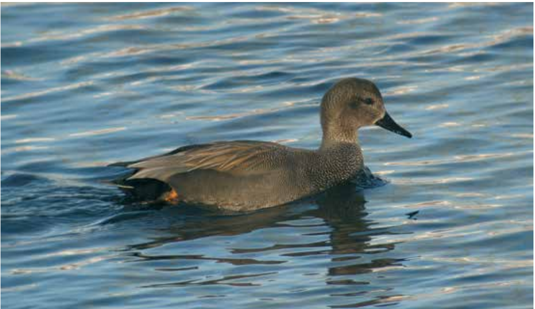
Abb. 8: Schnatterente, Gadwall, Kennader See BO, 10.01.2009.

2 Bp im NSG Rheinaue Walsum DU (mej) \diamond 10.1. 750 im NSG Rheinaue Walsum DU (mej) \diamond 11.1. 155 auf der Emscher in DO, dort 163 am 27.12. (kre) \diamond 13.2. 155 (Jahresmaximum) im Radbodseegebiet HAM (pow, pin) \diamond 17.2. 139 Ind NSG Versmolder Bruch GT (BSt GT/BI) \diamond 17.2. 240 (Heimzugmaximum) im NSG Ahsewiesen SO, dort 310 (Wegzugmaximum) am 17.11. (pow) \diamond 22.6. ein Männchen, ein Weibchen Klärteich Arnsberg-Neheim HSK (wiw, hek) \diamond 16.9. 326 Klärteiche Bedburg BM (kum) \diamond 6.10. 252 Klärteiche Bedburg BM (wyk, ked) \diamond 26.10. 300 (Jahresmaxi-