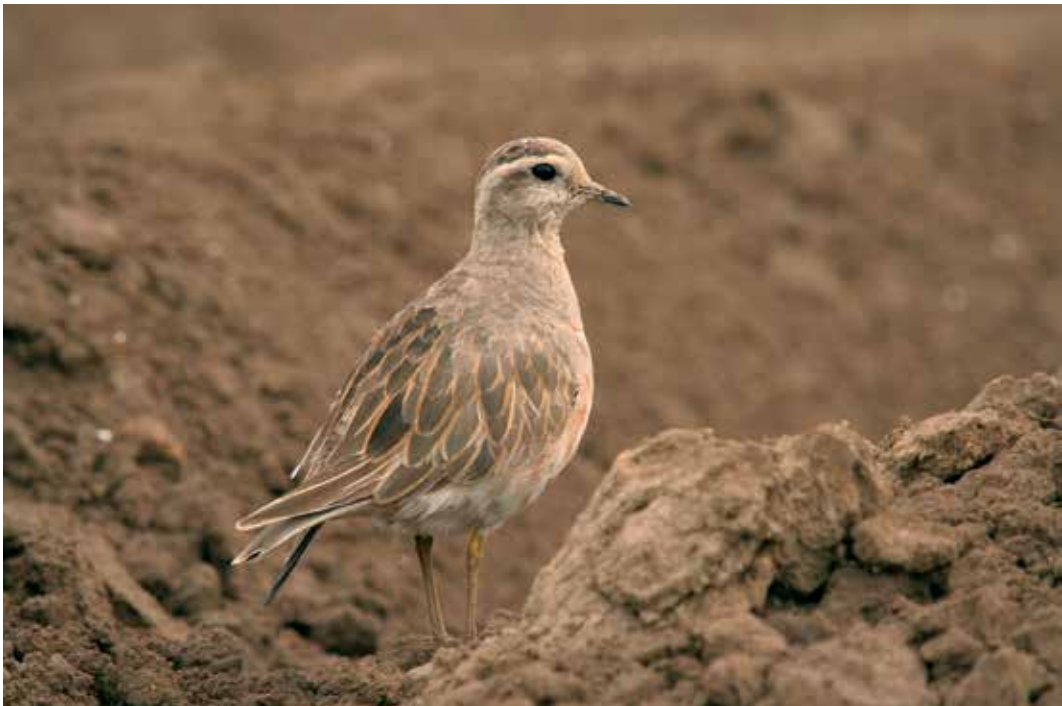
Abb. 22: Mornellregenpfeifer, Eurasian Dotterel , Felder von Hagenbroich VIE, 28.04.2009.