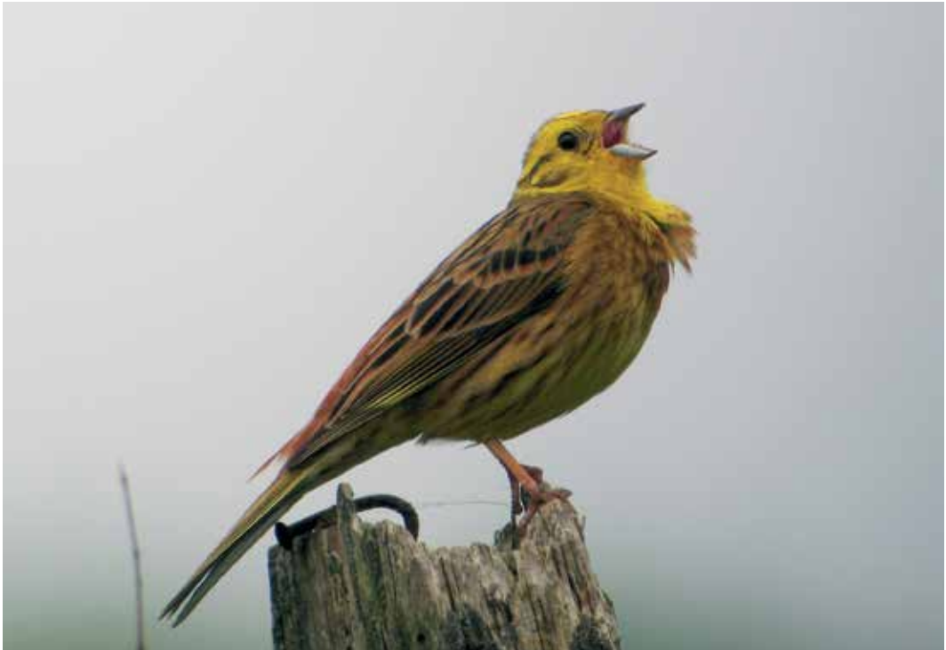
Abb. 34: Goldammer, Yellowhammer , Ellewicker Feld BOR, 19.04.2009.