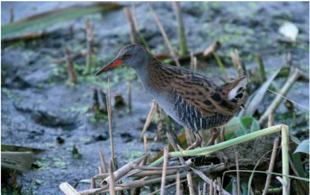
Abb. 18: Wasserralle, Water Rail , Rieselfelder Münster, 13.09.2009.

jus) ◊ 28.2. 120 Ind nach S! Birkelbach SI (frm, pov) ◊ 28.2. 1.000 Schlafplatz NSG Recker Moor, Recke ST (nih) ◊ 28.2. etwa 1.000 Ind rastend im NSG Ahsewiesen SO (smi, beb, glb, müa, teh u.a.) ◊ 28.2. 71 rastend im NSG Schmehauser Mersch HAM (pow, huj), dort übernachteten vom 28.2. auf den 1.3. mind 180 Ind, die früh morgens abzogen (pow), dort erneut 100 Ind rastend am 1.3. (pow) ◊ 1.3. 250 rastend und nahrungssuchend in der Wardweide bei Eversael, Rheinberg WES (gak, dof, kli, kag, pej u.a.) ◊ 1.3. 102 rastend Erftstadt-Borr BM (kum) ◊ 1.3. 260 rastend Dingdener Heide Hamminkeln WES (OAG DH) ◊ 7.4. einer, seit mindestens dem 27.3., laut eines Gewährsmanns sogar mindestens seit vier Wochen anwesend, NSG Kocksloch MH (kjö) ◊ 11.4. einer rastend NSG Königsbüscher Wäldchen/ Kalwes BO (weh, rat) ◊ Herbstzug 15.906 in 135 Trupps Bergisches Land GM (buc) ◊ Herbstzug am Niederrhein vom 20.8.-30.12.: 13.511 Ex, davon alleine 7.096 am 1.12. (wda, anc, wol, bad, wit, tem, huh, ker, lür, frh u.a.) ◊ 1.12. extremer Zugtag mit 13.641 Ind innerhalb von nur 3 Stunden 35 Minuten über das NSG Königsbüscher Wäldchen/ Kalwes BO nach SW ziehend (sci) ◊ 18.12. Zugrufe bei starkem Schneefall um 14 Uhr über Olsberg-Antfeld HSK (leh) ◊ 25.12. 50 Ex ziehend Wilnsdorf SI (mad).