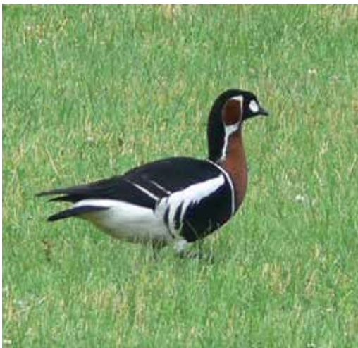
Abb. 2: Rothalsgans, Red-breasted Goose, NSG Mühlenlaar HAM, 16.06.2009.

Ca. 31-33 Paare mit 66 juv im HSK. Der Winterbestand im Ruhrtal zwischen Arnsberg-Voßwinkel und dem NSG Ruhrstau bei Echthausen lag bei max 327 Ex (OAG HSK, Artbearbeitung kob) < mind 33 Bp im Stadtgebiet DO (ner, kre u.v.a.) < mind 10 Bp