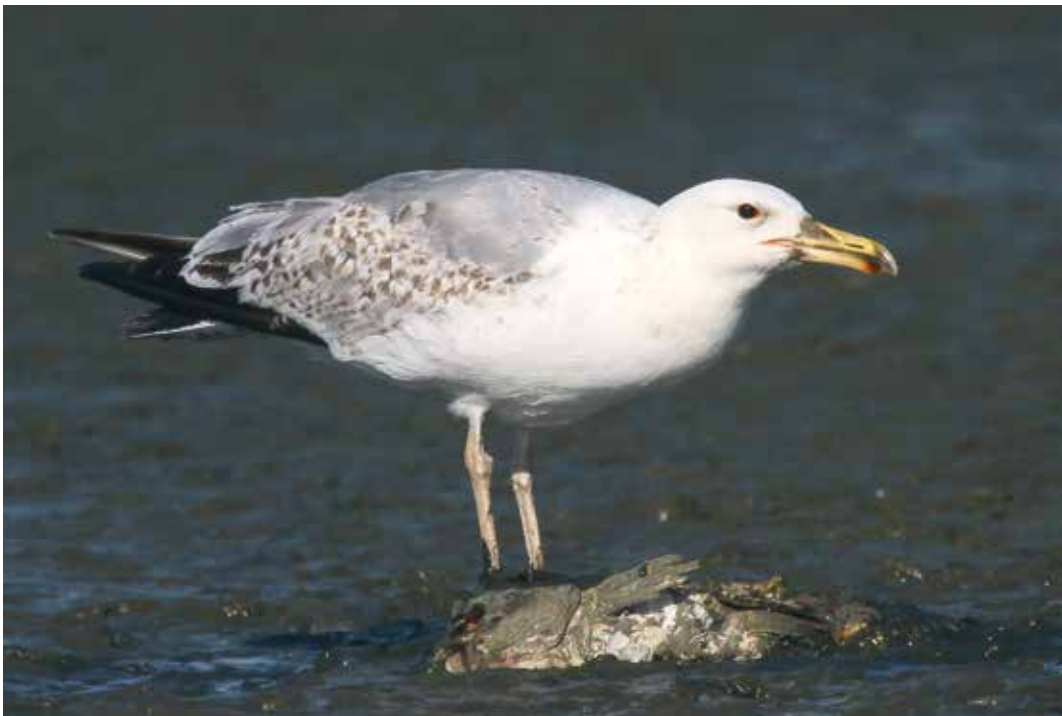
Abb. 26: Steppenmöwe, Caspian Gull , Rieselfelder Münster, Mai 2009.

10 Bp Diersfordter Waldsee, Wesel WES (böm) <math>\diamond</math> ein Bp am Franziskussee Brühl BM, 3 Küken wur-