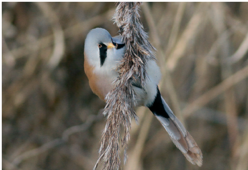
Bartmeise (m), LSG 38, 8.01.2018

Heidelerche: Heimzug: Rastende Trupps mit 6 am 17.03. SE Hemmerde und 5 am 22.03. bei Frömern (jeweils Kr. Unna, BG). Erstaunlich sind je 1 sing. m am 8. und 13.04. (an zwei Stellen) auf der Halde Großes Holz bei Rünthe (Kr. Unna, JH). In Mittelwestfalen bisher keine Bruten bekannt, westfälische Verbreitungszentren sind Senne, TÜP bei Haltern und Weihnachtsbaumkulturen im Hochsauerland-