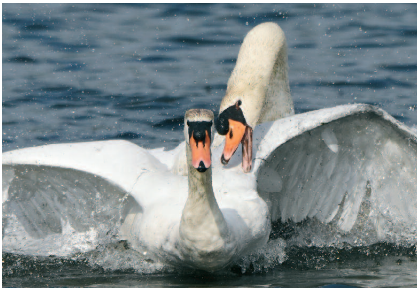
Höckerschwäne, NSG Tibaum, 23.04.2018

Nilgans: Immerhin 260 am 7.01. und 105 am 10.03. auf Maisstoppeln Schwannemühle bei Dinker (Kr. Soest, WP). Brutzeit: Ein Gelege auf Storchennisthilfe im NSG Ahsewiesen (Kr. Soest) wurde am 27.02.