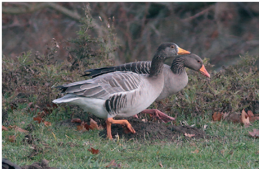
Streifen- x Graugans-Hybride, NSG Mühlenlaar, 28.11.2018