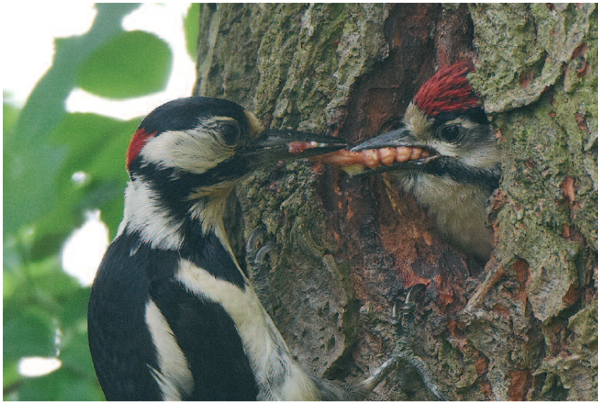
Buntspechte, RSG, 24.05.2018