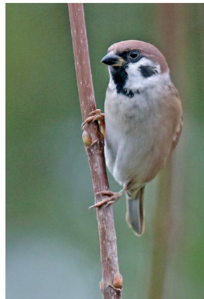
Feldsperling, Fröndenberg, 1.11.2018