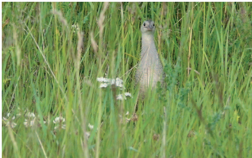
Wachtelkönig, NSG Oberwerrieser Mersch, 30.06.2012