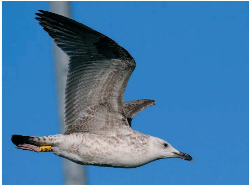
Steppenmöwe (2. KJ), Uentrop, 18.01.2019