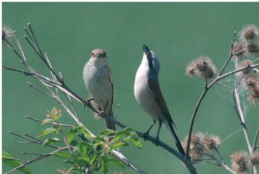
Neuntöter (balzendes Paar), Unterallen, 12.05.2018