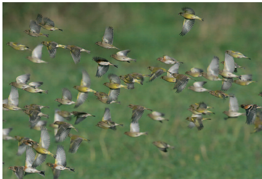
Grün- und Bergfinken, Wambeln-Kuhweide, 15.03.2018