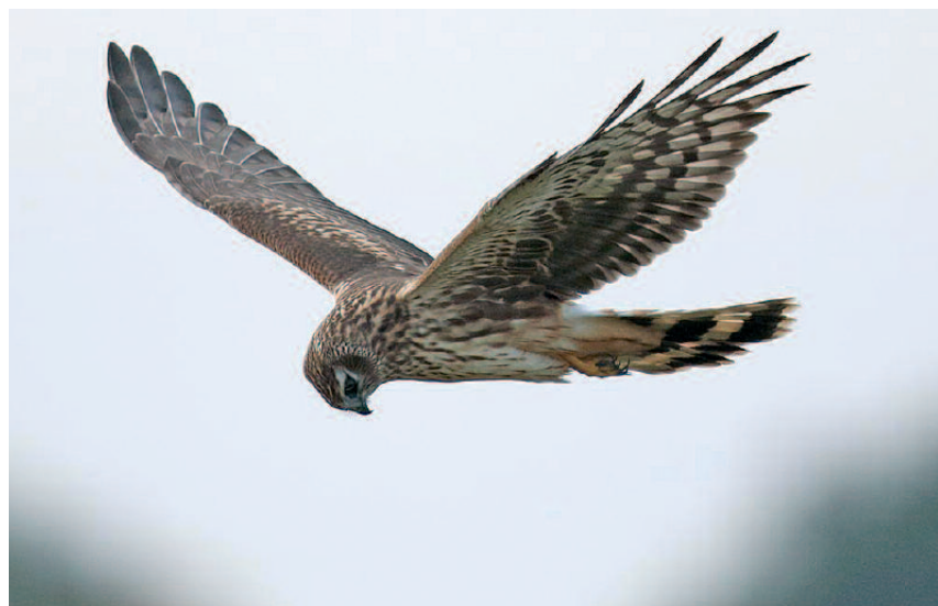
Kornweihe (juv.), Strickherdicke, 7.10.2018

Steppenweihe*: 1 ad. m am 3.10. etwa 90 Minuten rastend auf Acker am Haarkamm W Gerlingen (Kr. Soest) ohne zu kröpfen, dann nach W abziehend (von Rabenkrähen „gemobbt“, WP, CH, AM, Fotos). Beobach-