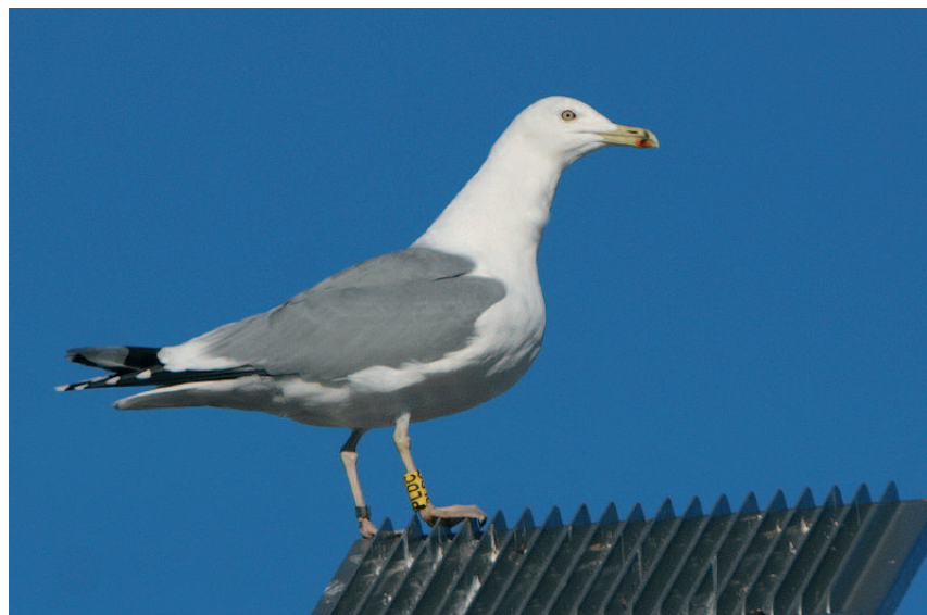
Steppen-x Silbermöwen-Hybride (ad.), Uentrop, 15.11.2018

Sturmmöwe: Größte gemeldete Trupps mit 75 am 25.01. und 43 am 22.11. auf Wintergetreide am Haarkamm W Gerlingen, 40 am 26.01. am Wameler See des Möhnesees (jeweils Kr. Soest, WP) sowie 11 am 8.03. im Bärenbruch N Kuhweide (WP) und 22 am