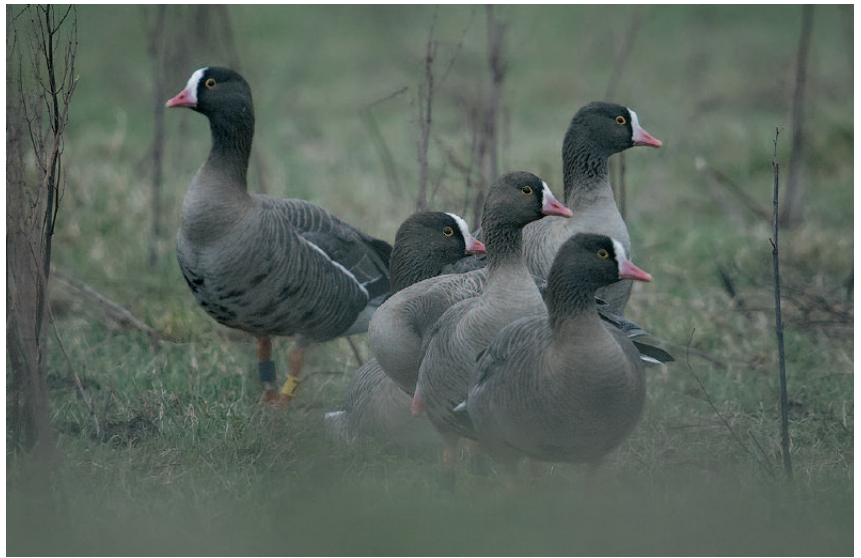
Zwerggänse, Ahsewiesen, 10.11.2018

Zwerggans: Durchaus internationale Beachtung fand die erstmalige Überwinterung von stolzen 24 diesj. (davon 23 mit einseitig codierten Farbringen links und alle mit schwarzem Jahres-Kennring über Metallring rechts) vom 1.11.2017-30.03.2018 in den NSG Disselmersch und Ahsewiesen (Kr. Soest), die im Juli 2017 unter 85 juv. in Schwedisch Lappland ausgewildert wurden. Der stets dicht gedrängt zusammenhaltende Trupp wurde überwiegend auf Nassgrünland und vom 10.-21.12.2017 auch auf überschwemmten Maisstoppeläckern (bei Dinker, Kr. Soest) festgestellt. Vermeidbare Störungen brachten Gesellschaftsjagden und das wochenlange panikartige Auffliegen der zeitweise extrem scheuen Graugänse als Folge der Gänsejagd auch im Vogelschutzgebiet. In Skandinavien derzeit 30 BP, davon 10-15 (60-70 Ind.) in Schweden, wo 2010-2017 im Süden Lapplands 377 nicht flügel juv. ausgesetzt worden sind. Die Zwerggänse, immerhin (fast) ein Drittel des schwedischen Bestandes, dürften mit Bläss- oder Graugänsen eingeflogen sein; das derzeit wichtigste Überwinterungsgebiet dieser Population ist „Oudeland van