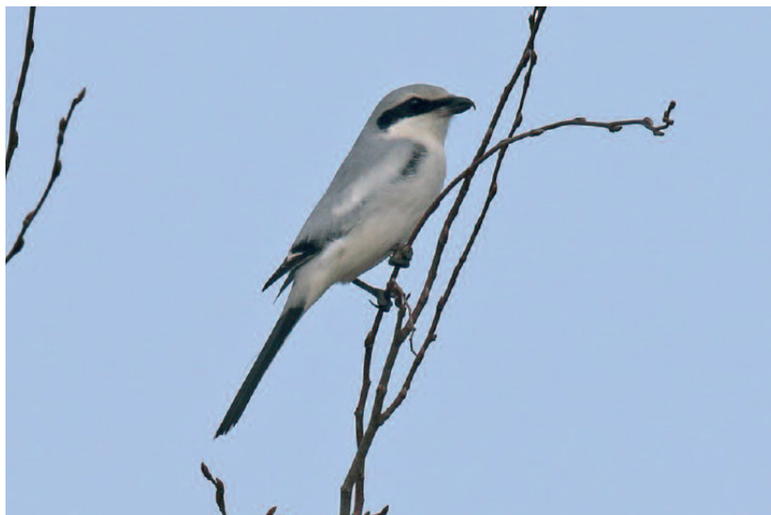
Raubwürger, Fröndenberg, 18.10.2018