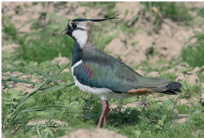
Kiebitz (ad. m), Wambeln, 4.05.2018