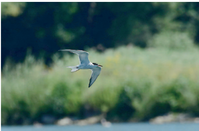
Flusseeeschwalbe (ad.), 3.07.2018

Weißbart-Seeschwalbe: 2 am 22.05. im NSG Woeste (Kr. Soest, J. Behmer).