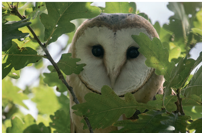
Schleiereule, Ahsewiesen, 18.09.2018