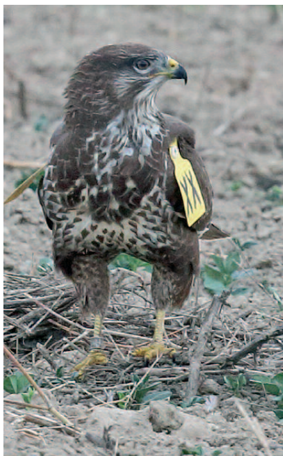
Mäusebussard, Ostbüren, 21.09.2018