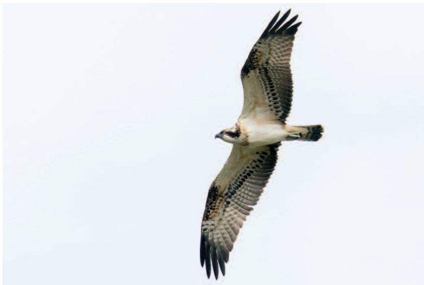
Fischadler (juv.), Klostermersch, 9.09.2018

Kormoran: Schlafplatz-Zählungen in Hamm ergaben 34 am 19.01., 32 am 18.02. (BB) und 8 am 25.05. (WP) im NSG 6 sowie (nur) 35 am 23.09. im NSG Im Brauck (JH) und 24 an den Haarener Baggerseen (neuer Ort, PO). Brutzeit: 6 am 15.05. in Steinbruch bei Erwitte (Kr. Soest), davon mind. zwei