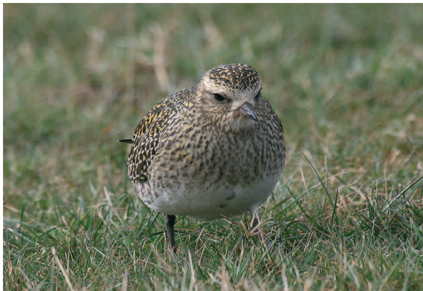
Goldregenpfeifer, Unterallen, 18.03.2018