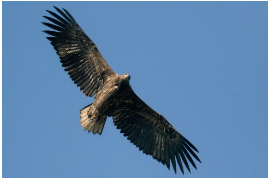
Seeadler (2. KJ), Hellinghauser Mersch, 22.02.2018