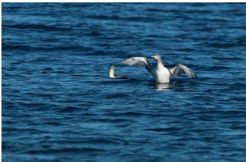
Sternentaucher (diesj.), Möhnesee, 9.11.2018