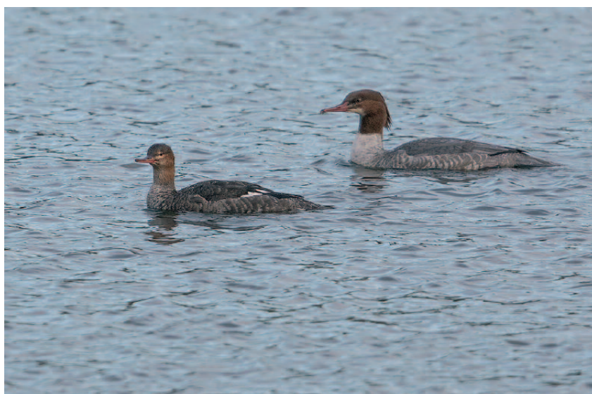
Mittelsäger (links), Möhnesee, 4.12.2018

Zwergsäger: Während im Stadtgebiet von Hamm kein einziger Nachweis gelang, wur-