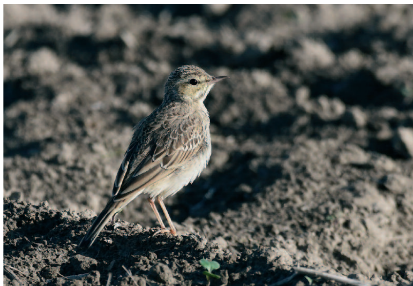
Brachpieper (1. Winter), Ense-Gerlingen, 25.09.2018