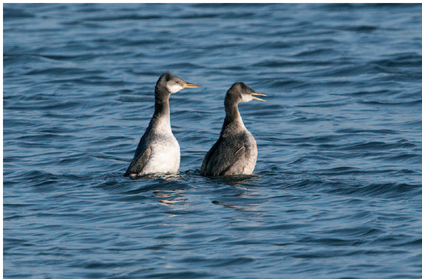
Rothalstaucher, Möhnesee, 4.12.2018