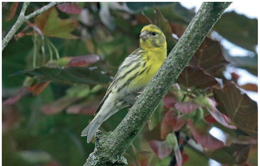
Girlitz (m), Bönen-Altenbögge, 18.06.2018

Erlenzeisig: Größte gemeldete Trupps im Ruhrtal bei Fröndenberg mit 300 am 21.01.