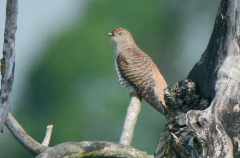
Kuckuck (w), NSG Tibaum, 27.04.2018