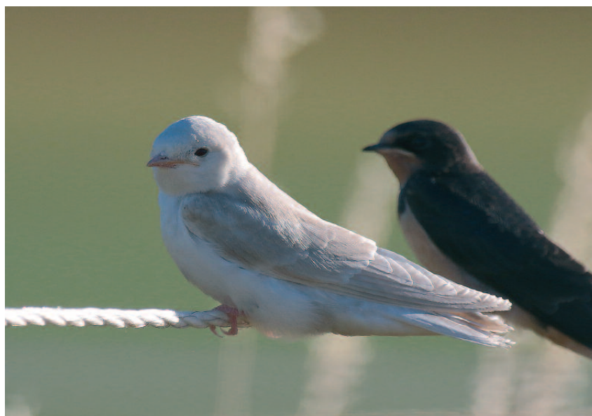
Rauchschnalbe (juv. Albino), Pedinghausen, 1.07.2018