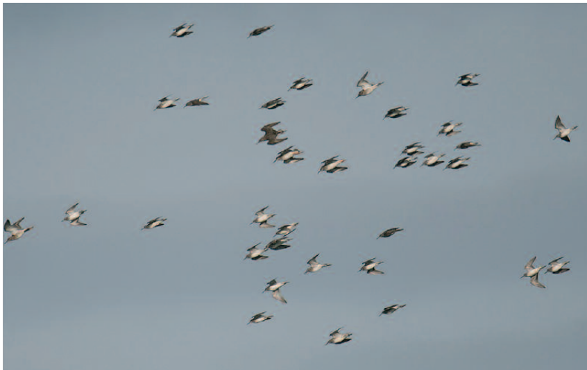
Bruchwasserläufer, Unna-Hemmerde, 28.04.2018