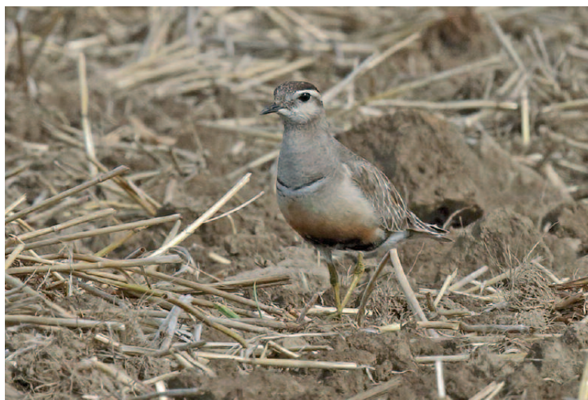
Mornellregenpfeifer (ad.), Schlückingen, 31.08.2018