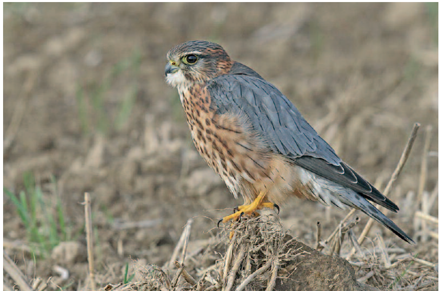
Merlin (ad. m), Westhemmerde, 26.09.2018

Merlin: Winter: Immerhin 6 Nachweise (6 Ind.) vom 13.01.–9.03., darunter 1 m am 13.01. im NSG Ahsewiesen (Kr. Soest, CH), 1 ad. m vom 7.–12.02. N Westhemmerde (Kr. Unna, BG, Fotos) sowie 1 im GK am 5.03. S Wambeln (AL) und 1 ad. m am 9.03. bei Klottingen (jeweils Kr. Soest, CHG, Fotos). Der Wegzug brachte am Haarstrang (Kreise Soest und Unna) sehr beachtliche 17 Beob-