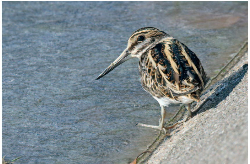
Zwergschnepfe, Halingen-Langschede, 25.02.2018