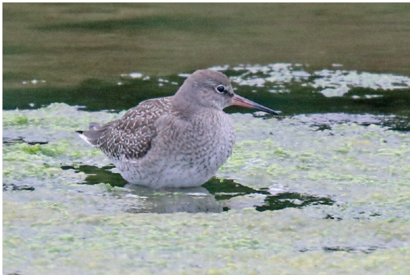
Rotschenkel (juv.), Halingen-Langschede, 13.09.2018