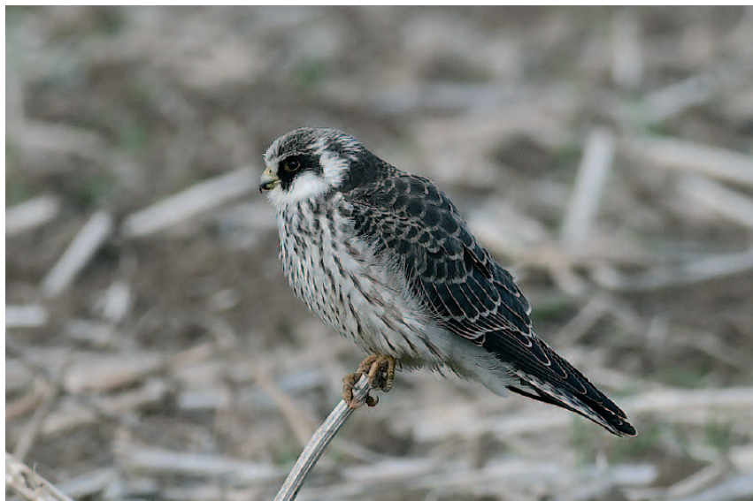
Rotfußfalke (juv.), Ense-Ruhne, 26.09.2018