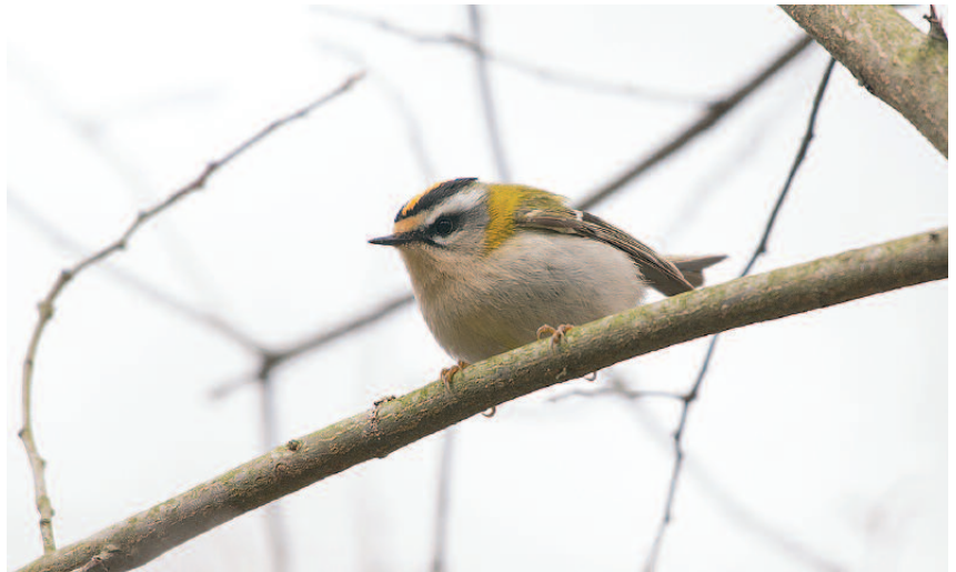
Sommergoldhähnchen (m), Westgeithe, 31.03.2019

Dorngrasmücke: EG mit je 1 sing. m am 14.04. im NSG Kiebitzwiese (Kr. Unna, GZ), am 15.04. im westlichen RSG (JH) sowie 16.04. im LSG 38 und Im Winkel (Kr. Soest, WP); letzter festgestellter Gesang am 4.08. im NSG Ahsewiesen (Kr. Soest, WP). Brutzeit: 21 sing. m am 5.05. auf Teilfläche im NSG 6 (32 ha, WP), dort ein fütterndes BP mit 3 flüggen juv. bereits am 9.06. (WP). 2018 immerhin 67 Reviere/BP im NSG Disselmersch (Kr. Soest, 168 ha, ABU 2019 b).