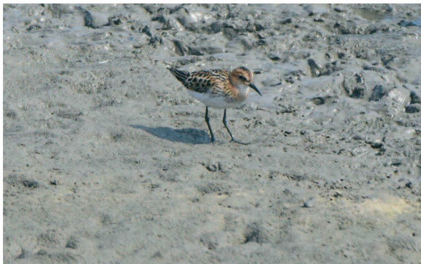
Zwergstrandläufer (ad.), Disselmersch, 22.07.2018