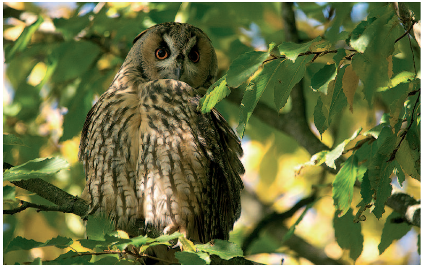
Waldohreule, Hamm-Werries, 5.10.2018