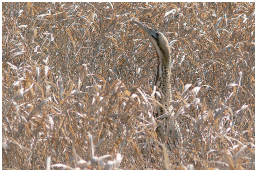
Rohrdommel, Ahsewiesen, 27.03.2018