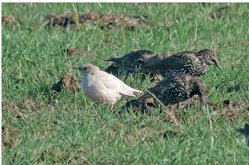
Star (Brauner Typus), Ostbüren, 8.09.2018

Singdrossel: Im Winter 2 am 18.01. im Buscholt bei Frömern (Kr. Unna, BG), je 1