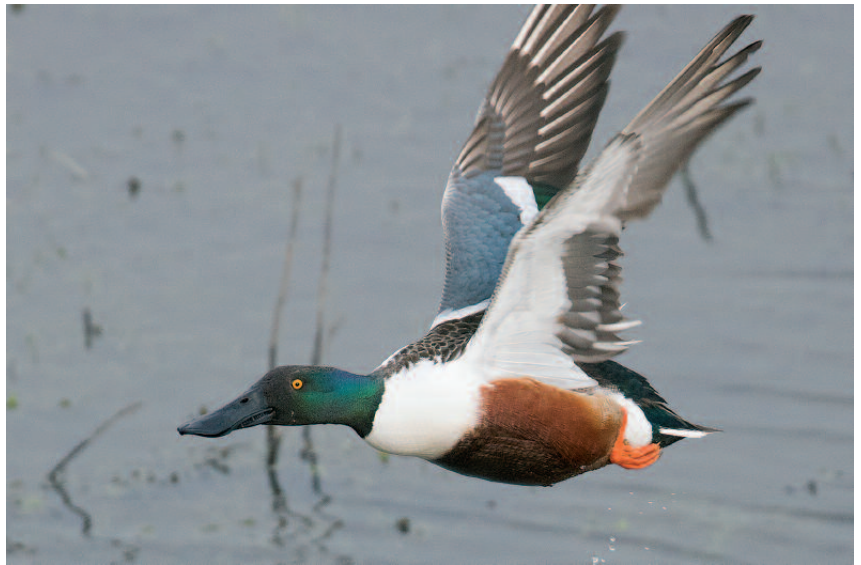
Löffelente (m), Disselmersch, 29.03.2018