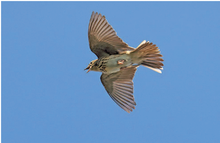
Baumpieper, Hemmerder Schelk, 17.04.2018