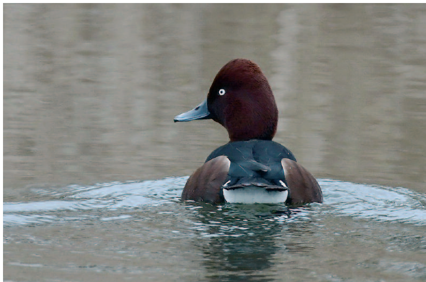
Moorente (ad. m), Ahsewiesen, 12.03.2018