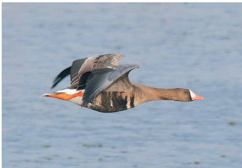
Blässgans (ad.), Disselmersch, 8.02.2018