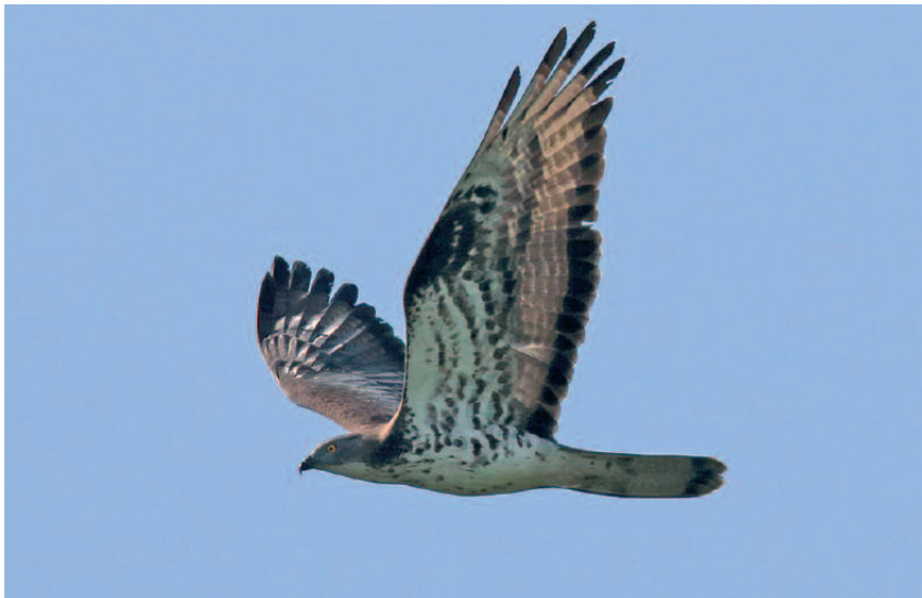
Wespenbussard (ad. m), Fröndenberg, 21.05.2018