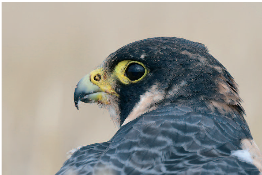
Wanderfalke (ad.), Störmede, 2.09.2018