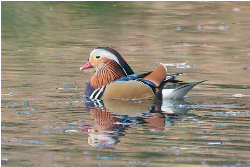
Mandarinente (ad. m), LSG 38, 16.10.2018