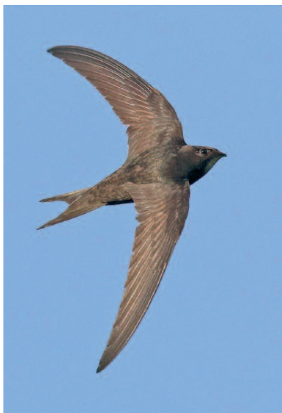
Mauersegler, Fröndenberg, 28.06.2018

Habichtskauz**: Nachtrag: Erstaunlich ist der angebliche Nachweis eines Vogels am 5.04.2013** am Ortsrand von Pröbting E Hilbeck (Kr. Soest), der den Leser „grauer Literatur“ zur Planfeststellung der A 445-Neubautrasse (zwischen Werl und Hamm) geradezu ansprang (LANDSCHAFT & SIEDLUNG 2016). Der Habichtskauz konnte bisher noch niemals als Wildvogel in NRW nachgewiesen werden, wenngleich mind. ein Ind. in den Jahren 1988-1989 am Eggekamm (Kreise Paderborn/Höxter) von der