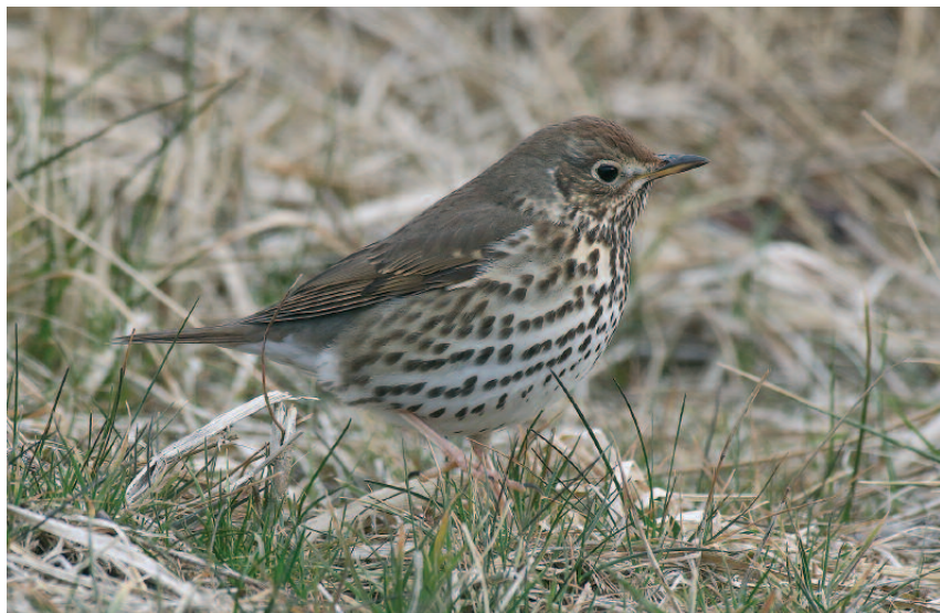
Singdrossel, Rhyern, 18.03.2018