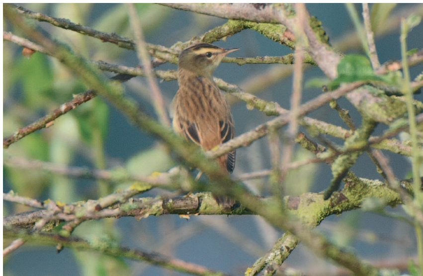
Schilfrohrsänger (juv.), Scheringteiche, 12.07.2018