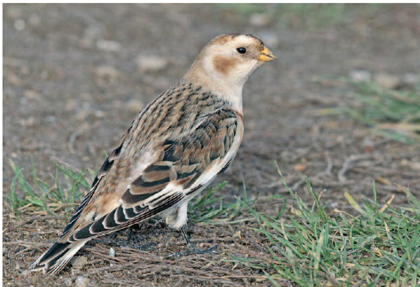
Schneeammer (ad. m im SK), Strickherdicke, 30.11.2018

Rohrhammer: Winter: 10 am 21.01., je mind. 20 am 30.01. und 13.02. sowie mind. 10 am 23.11. im LSG 38 an Schlafplatz im Schilf; dort EG eines sing. m am 3.02. (Vollgesang!) und bereits 15 sing. m am 19.03. (WP). In den Ahsewiesen (Kr. Soest) je 2 am 26.01. (WIF) und 23.12. (WP, DK). Letzte Gesangsfeststellungen mit je 1 sing. m am 15.07. im NSG Ahsewiesen (WIF) und noch am 16.09. (bruchstückhaft) im LSG 38 (WP). Brutzeit: 45-53 Reviere/BP im NSG 6 und Umgebung (230 ha, dort im Vorjahr 47-50 Reviere, WP), 15 sing. m am 2.06. Rieselfelder Werne (Kr. Unna, 110 ha, JH) sowie mind. 15 sing. m vom 9.-27.06. (Zweitbrut) im „K-Park-Süd“ des DuPont-Geländes (WP, JH).