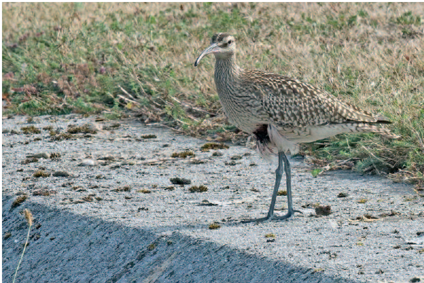
Regenbrachvogel, Fröndenberg, 23.08.2018