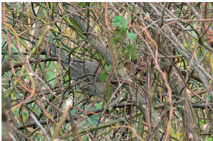
Sperbergrasmücke (1. Winter), LSG 38, 8.10.2017