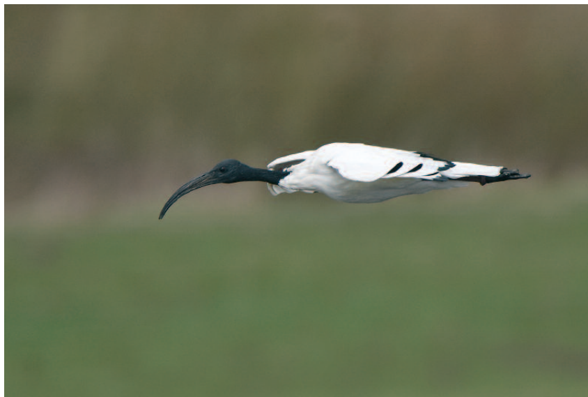
Pharaonenibis, Disselmersch, 3.04.2018