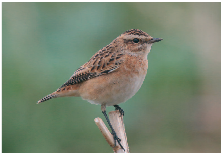
Braunkehlchen (juv.), Unterallen, 27.08.2018

Braunkehlchen: EFB mit 2 (1 m, 1 w) am 13.04. im NSG Ahsewiesen (Kr. Soest, WIF) und 1 m am 14.04. im Hemmerder Ostfeld