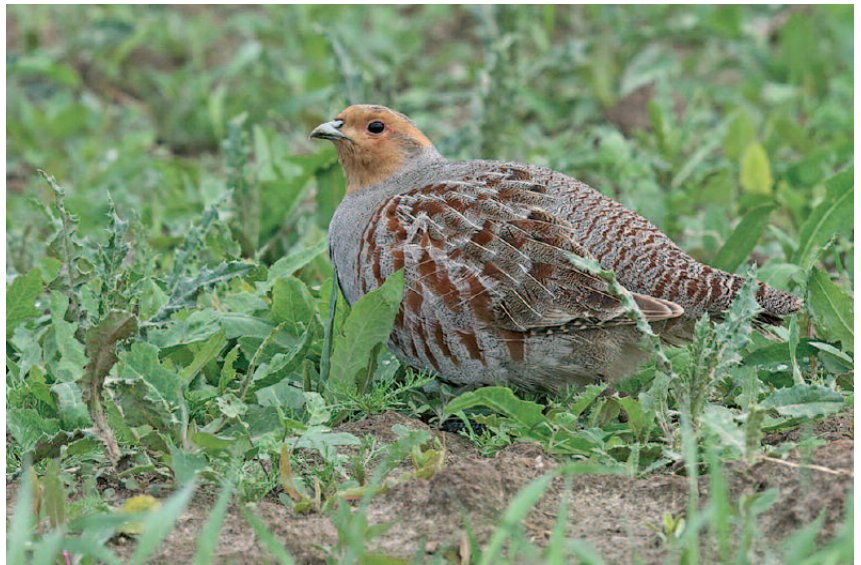
Rebhuhn (m), Hemmerder Ostfeld, 1.05.2018

Rebhuhn: Am westlichen Haarstrang (Kr. Unna) 5 am 5.02. und mind. 1 Paar vom 24.02.-8.03. im Hemmerder Ostfeld sowie je 1 Paar am 24.02. und 20.04. S Ostbüren (BG, Fotos); dort außerdem ein rufendes m am 8.03. (19 Uhr) bei Frömern weit W-E