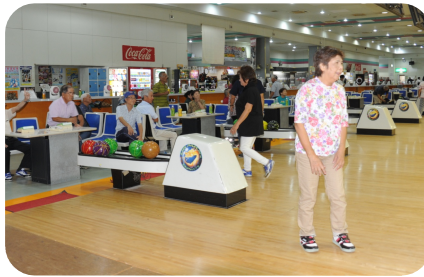
あれー！私のボウルは？