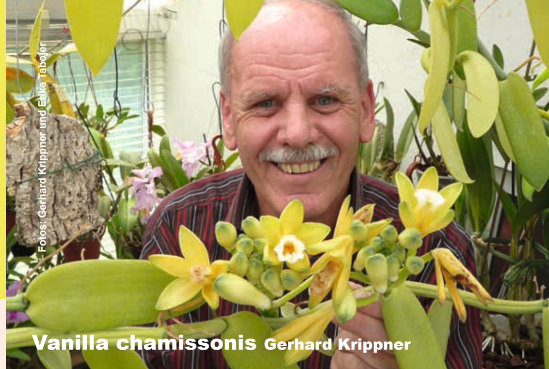
Vanilla chamissonis