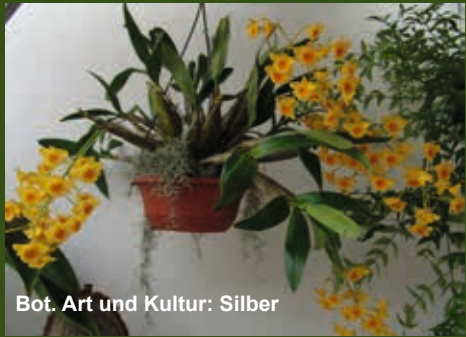
Bot. Art und Kultur: Silber