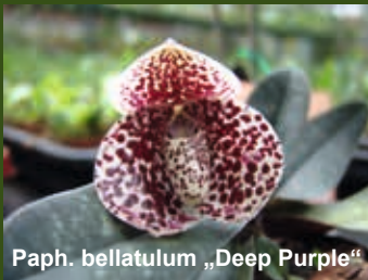
Paph. bellatulum „Deep Purple“