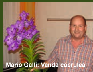
Vanda coerulea