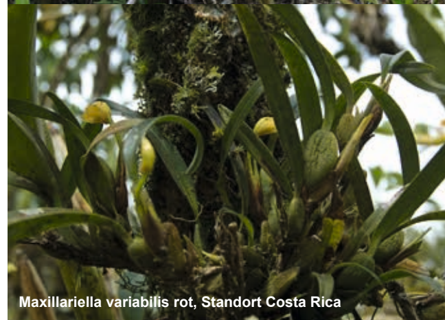
Maxillariella variabilis rot, Standort Costa Rica