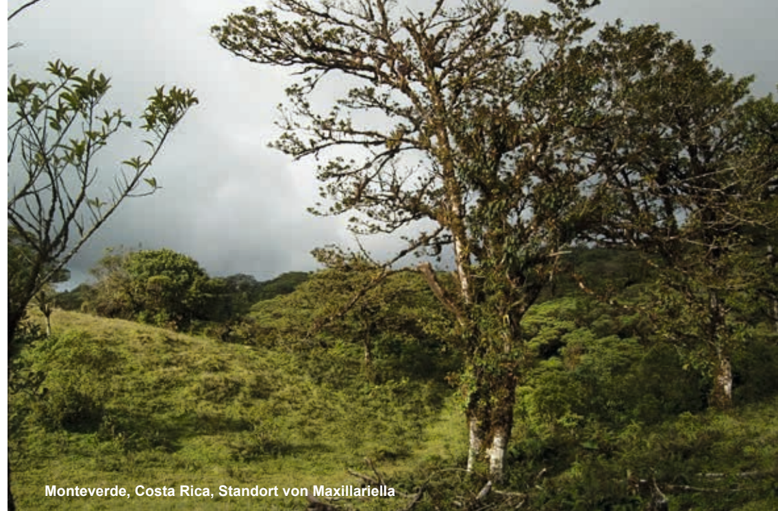
Monteverde, Costa Rica, Standort von Maxillariella

Basionym: Maxillaria sanguinea ROLFE 1895