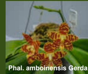
Phal. amboinensis Gerda