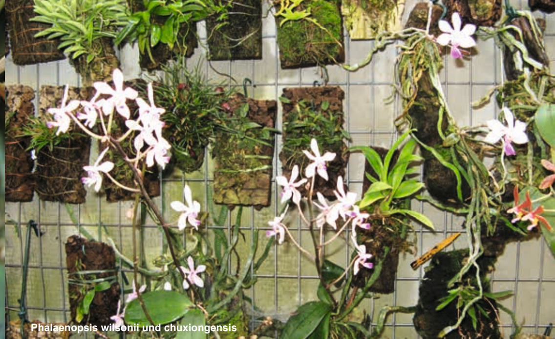
Phalaenopsis wilsonii und chuxiongensis