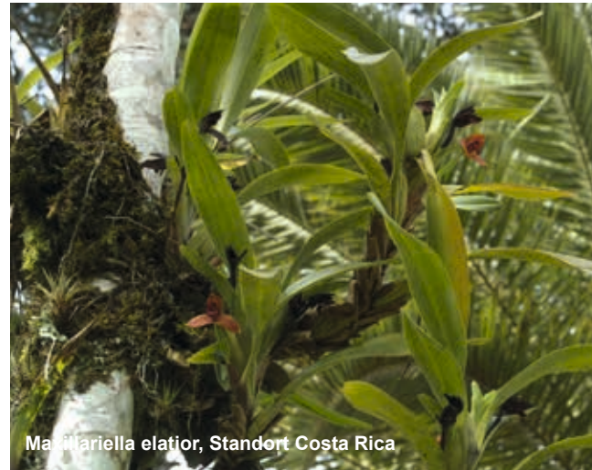
Maxillariella elatior, Standort Costa Rica