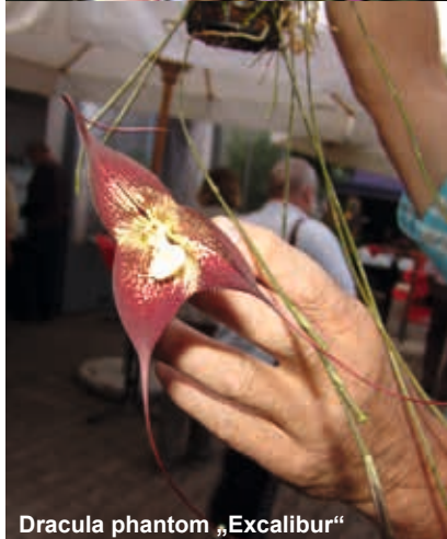
Dracula phantom „Excalibur“