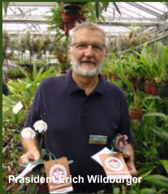
Präsident Erich Wildburger