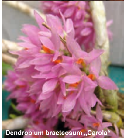
Dendrobium bracteosum „Carola“

Das Endergebnis lautete: Deutschland 27,408 Punkte Österreich 29,630 Punkte Ungarn 47,778 Punkte