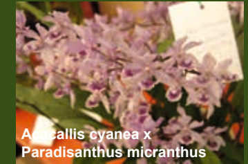
Ancallis cyanea x Paradisanthus micranthus