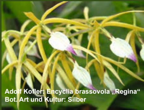
Adolf Kofler: Encyclia brassovola „Regina“ Bot. Art und Kultur: Silber