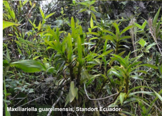
Maxillariella guareimensis, Standort Ecuador