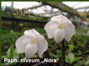
Paph. niveum „Nora“