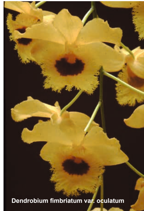
Dendrobium fimbriatum var. oculatum

F. G. Briegers Werk (um 1970), welches dem „Neuen Schlechter“ zugrunde liegt und der einige Sektionen abgespalten (z. B. Callista) und zu neuen Gattungen erhoben hatte, fand keine allgemeine Anerkennung. Seine damalige Neueinteilung des Dendrobium-Komplexes wurde von den meisten Botanikern nicht übernommen.