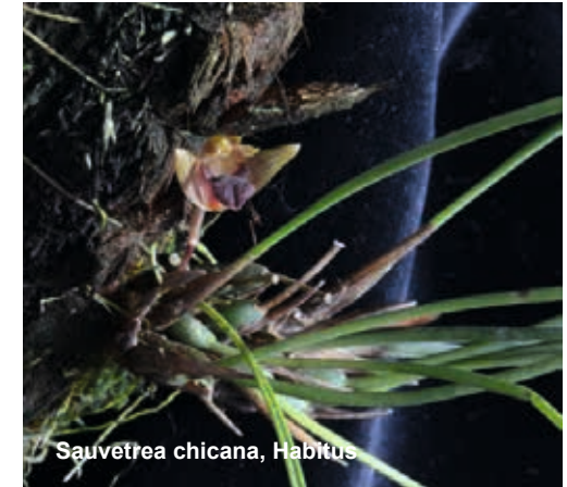
Sauvetrea chicana, Habitus

ist. Aber bisher wurde von keinem anderen Autor jemals ein sechseckiger Fruchtknoten erwähnt.