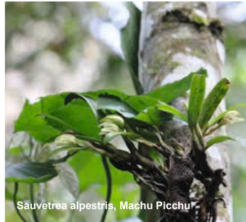
Sauvetrea alpestris, Machu Picchu