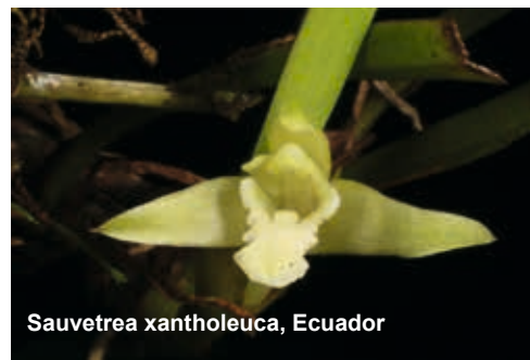
Sauvetrea xantholeuca, Ecuador