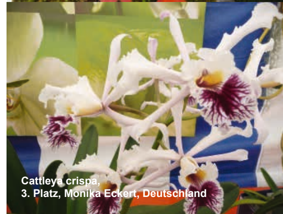
Cattleya crispa , 3. Platz, Monika Eckert, Deutschland

Der D.O.G.-Vorstand ist in diesem Fall stets bemüht, einen erfahrenen Bewerber als Betreuer zur Verfügung zu stellen.