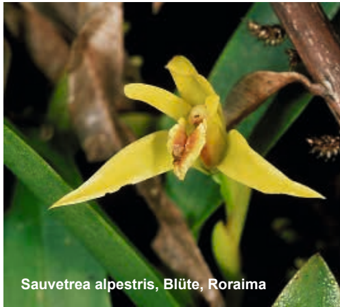
Sauvetrea alpestris, Blüte, Roraima