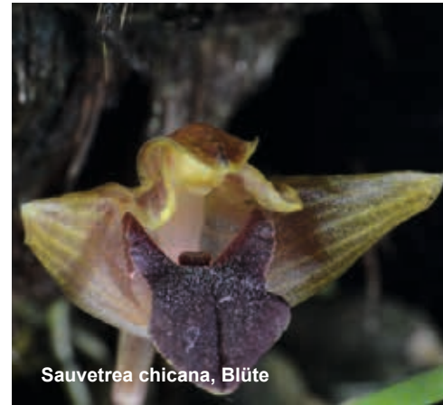
Sauvetrea chicana, Blüte