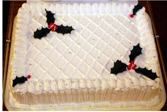
Tekst i foto: Zoran Lalić