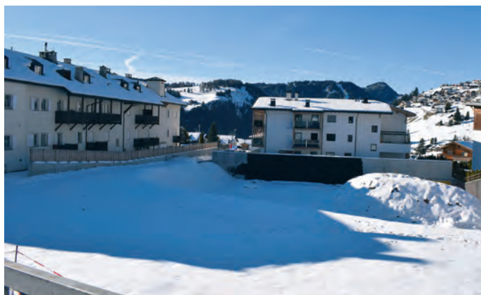
Nella zona "Anri" è stato demolito il fabbricato destinato a mensa aziendale

È stato approvato il progetto esecutivo elaborato dallo studio d'ingegneria "Patscheider & Partner srl" – Dr. Ing. Walter Gostner riguardante le misure di protezione dalle piene delle abitazioni presenti in località "La Selva" per una spesa di progetto di 483.146 Euro. I lavori po-