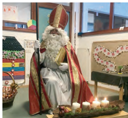
San Miculau te scolina

Y pona se al prejentà te uni grupa, cun si bel mantel cuecen, si mitra y l fust d'or y nes