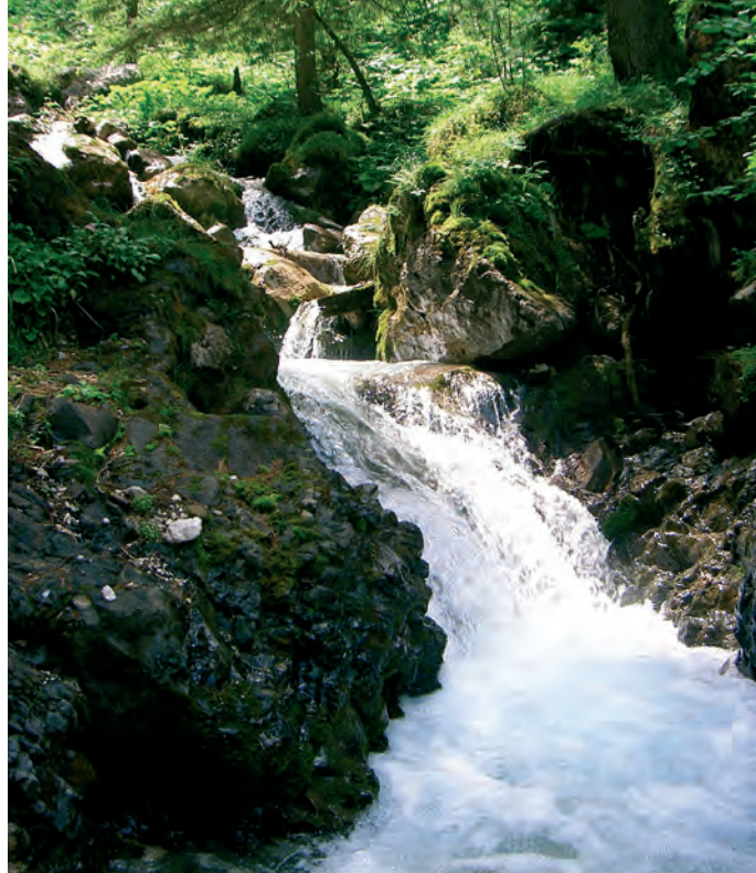
Le sorgenti acqua potabile "Frea" verranno risanate. La giunta comunale ha approvato il progetto per la terza fase di indagini.

Sono approvati gli indennizzi per le limitazioni all'utilizzo agricolo o forestale nell' area di tutela dell'acqua potabile "Plan de Frea" per l'anno 2021.