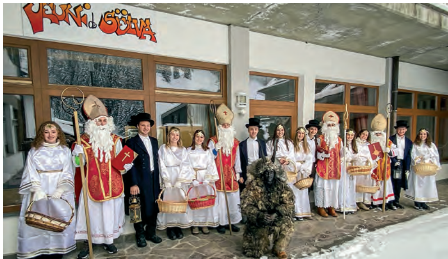
Na bela gran grupa cun 4 San Miculau, angiuli, fanc y sambèn nce n malan ie jic ora per la cèses dl luech.

Uni doi ani, dan che l scumència l inviern, metons a ji l curs de mèter su ciadèines . Davia che avisa n valgun dis dant ovel nevèt, fovel per truep jèuni la drèta ucajian per mparé co se mèter n viac n segurèza canche la stredes ie blances. Cun la desmustrazion, n valgun cunsèis