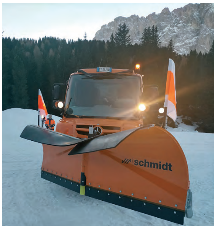
Sëlva muessa avëi - coche luech da mont - nce la drëta massaria per ti vester sce l ëssa da nevëi trueda.

Oradechël à l Chemun n contrat cun firmes privadas da tlo che va a palé la stredes; l servisc vëija dant de vester a despusizion 24 èura sun 24, 7 dis al'ena ntan la dureda