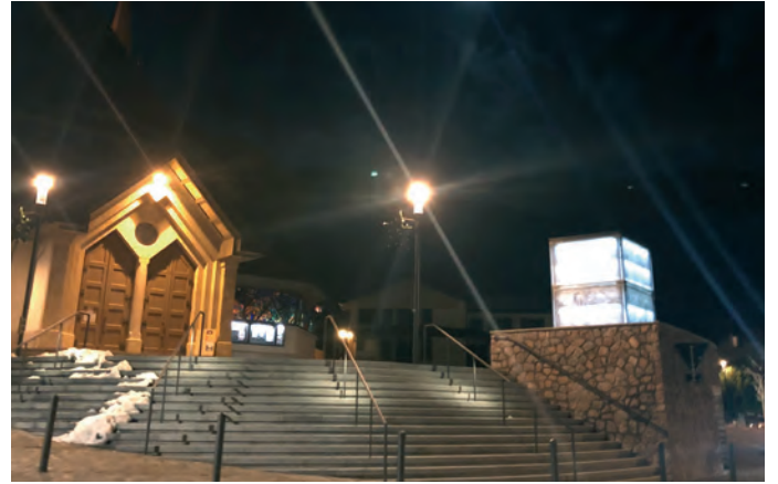
PLAZA DE DLIEJA

L avèi venciù n tel pest de mpurtanza, che porta l inuem de n gran linguist, ie scialdi de plu che n recunescimënt de valuta per l autor, si grupa de lëur y l Istitut Ladin Micurà de Rù. L se trata nce de n recunescimënt de duta nosta cumenanza che viv te n raion naturel y linguistich de marueia.