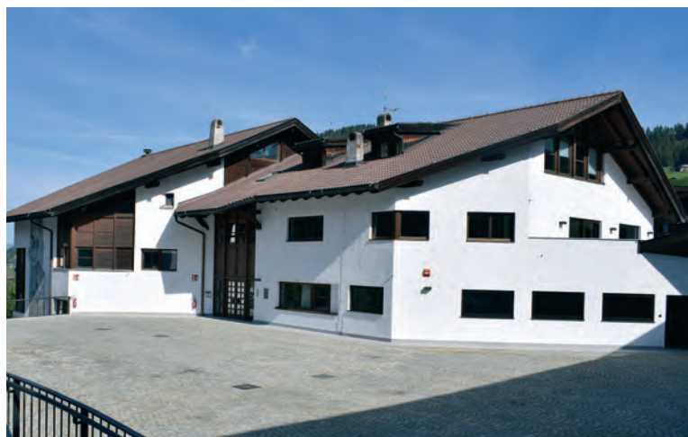
Per il risanamento energetico del municipio è prevista una spesa complessiva di 640.000 Euro.

Duta la lies, grupes y associazions che ulëssa giapé n cuntribut dal Chemun de Sëlva per si attività o per vel nvestimènt ntan l'ann 2022 possa mandé ite la dumanda nchin ai 31 de jené 2022 . I documènc che va debujèn per scri ora la dumanda possa unii descìarièi dala plata internet dl Chemun de Sëlva, www.selva.eu .