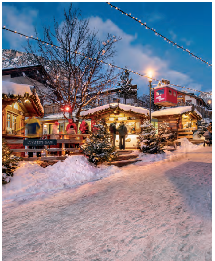
L marcià da Nadel cun la furnadoia

La furnadoia che passa alauta sèura l marcià via ie inò stata na atrazion per trueps; chèsta ie na carateristica de nosc luech de turism che desfrenzièia mpue l "Nadel da mont" dai autri marcèies.