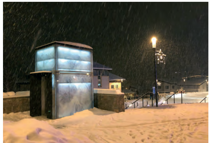
L ascensëur iluminà, te na bela atmosfera da d'inviern.

Canche n ova tëtut la dezijion de realisé n ascensëur che menëssa dal garasc nuef "Chemun" nchin sun plaza de dlieja fova n valguni che trajova su l nes. A pert l aspet dla sauridanza, aspet che unirà stimà dantaldut dala jënt de tëm che puderà uni ora de auto y furné su comot cun l ascensëur nchin dan rëjes, univel nce criticà che n tel "cubo" sun plaza ne fajëssa nia propi massa na bela paruda. Nscila fovel uni fat la pruposta de furni l ascensëur cun n quant "artistich". N ova nvià l artist Gotthard Bonell a se fé n pensier de coche n pudëssa realisé velch che jissa mpue adum nce cun i vieresc de dlieja; chisc ova èl bele realisà dl 1988 canche l fova uni ngrandi la dlieja. L artist à ulù spiedlë mpue la struttura di vieresc adurvan nce l dessëni linear. Sambën àl adurvà n'otra tecnica y l dessëni ie plu astrat. Sciche cuntenut de si lëur àl cris ora la formes y la morfologia di crëps che n vëija da plaza de dlieja demez sciche l Saslonch, Méisules, Stevia y la Pizes da Cier. L ji nsëuralauter y danterite dla linies devënta nsci na ncrujeleda che tën adum l cubus de scipa. L dessëni sun la scipes ie lesier y trasparënt y da sëira, canche dut cant ie luminà, giapa la struttura na forma magica che se cunlieia cun l ntëurvia.