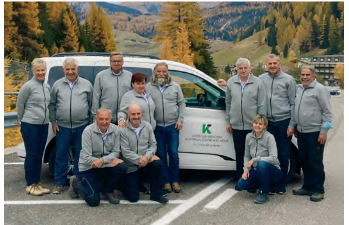
La grupa de ulenteres "Ve judon" cun si auto per mené i paziënc.

L ie for inò da stimé che jënt se dà ca per judé i autri, che se mpënia acioche d'autri se feje plu sauri y che ti