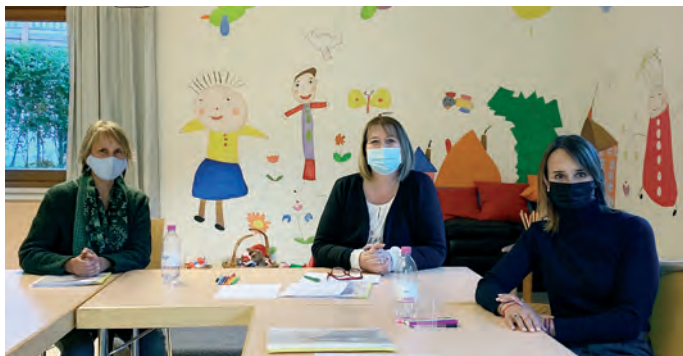
Die ersten Freiwilligen:

„Stark ist, wer sich Unterstützung holt!“, lautet das Motto der Initiative Family Support , einem Projekt von Casa Bimbo/Tagesmutter, welches in Zusammenarbeit mit dem Netzwerk für Familien „FamiLiam“, im Sprengelgebiet Gröden aufgebaut wurde.