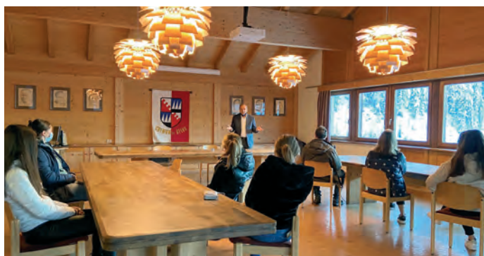
Te sala dl cunsèi de chemun de Sëlva

N sada, ai 6 de nuvèmber iel unì metù a ji te Sëlva la "Festa di 18 ani" di jèuni y dla jèunes dl 2002 y 2003, do che l ann passà ne n'oven nia pudù la fé. L ie urmei tradizion che l'aministrazion de Chemun nvieia uni ann i zitadins jèuni che cumplèsc i 18 ani a na ancunteda cun l ambolt y l'assessëura ai jèuni. Dala cater domesdi ie i nteressei unic saludei te sala de cunsèi, ulache l ambolt à rujenà