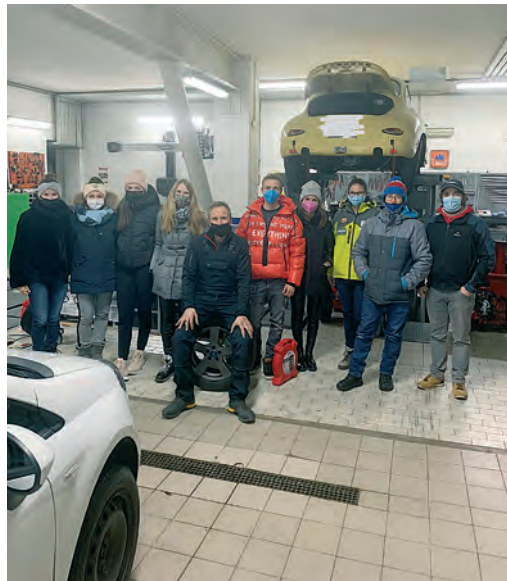
Co mèter su drèt la ciadèines sun i montli da d'inviern? Jèuni de Sëlva te na berstot da mecanicher ulache i à giapà cunsèies de utl.

Nce chëst ann à San Miculau abù la fertuna de pudèi ji a cri i pitli mutons y si families n cèsa per ti purtè vel scincunda y ti mbincé de bona festes y dut l bon per l ann nuef. N chësc cont se ons nèus dl cunsèi di Jèuni de Sëlva cruzià de mèter adum cater grupes de jèuni y jèunes che èssa abù nteres y la legrèza de fé San Miculau, l angiul, l fant o l malan. La manifestazion ie drèt