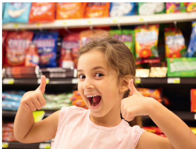
La cherta dla families: cumpré ite a miëurmarcià

Te chisc tèmps de pandemia sènt duc mo deplù l bujèn de sparanië y la families ie cuntèntes, sce l ti vèn jit ncontra cun vel scumenciadiva che respetea l tacuin. Bele da plu de diesc ani ncà iel te Sëlva la "Cherta dla Familia" , per ti dé n sustèni cuncret ala families. Nfati, te truepa butèighes, ustaries y uties da mont iel mesun giapé n rebàs, sce l vèn mustrà la cherta ala cassa. L ie propi da stimé che tan de mprejes à desmustrà nteres per chèsta scumenciadiva y uel dé na man acioche la families se feje mpue plu sauri economicamènter. Da prijé iel nce che duta la mprejes fej nce tl ann 2022 pea pra la scumenciadiva (ora che la gioielleria Laurin che à finà via si atività); la lista atualiseda cun la cundizions ie da liejer do sun la plata web dl chemun www.selva.eu .