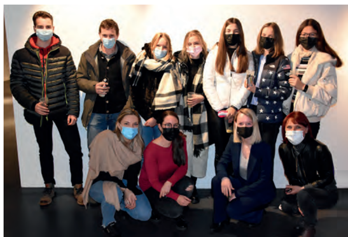
Jèuni y jèunes de 18 ani de Sëlva cun la urganisadëures y partezipantes ala manifestazion.

danterauter nce dl luech de Sëlva, dla pusciblteies de léur, dla mpurtanza dla lies y dla pruspetives per l dauni. I jèuni ova nce la puscibltà de fé vel dumanda. Da dedò iesen jic tl „Tublà da Nives“, ulache la lia "Nëus Jèuni Gherdëina" ova nvià n valgun jèuni dla valeda a cunté de deplù tematiches desfrèntes y nteresantes che reverda la majera età; sambèn ne manciova nce nia sperienzes persuneles de vita.