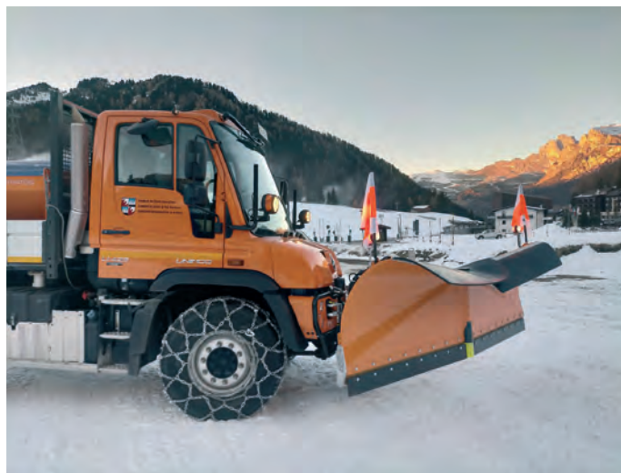
La cudria cun la pela nueva