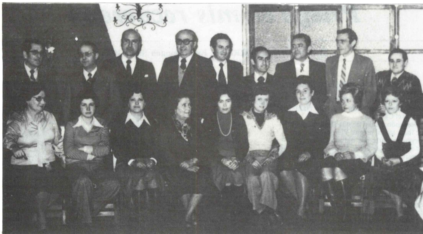
Presidiendo el Consejo de Redacción de ADARVE