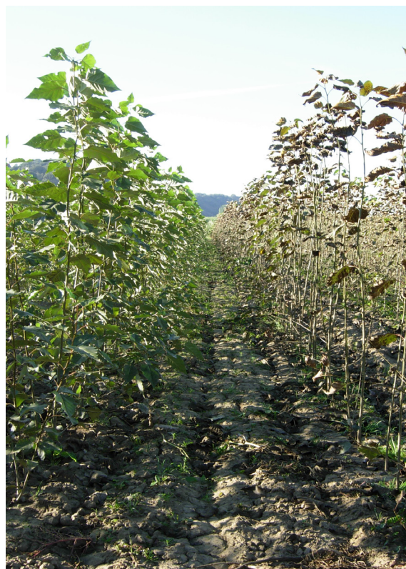
'Beaupré' atacado por Melampsora allii-populina en vivero junto a 'Raspalje' no infectado.

Es difícil evaluar el coste económico que puede haber supuesto la expansión de 'Beaupré' en las choperas de Castilla y León, pero no cabe duda de que el daño ha sido y es lo suficientemente importante para adoptar medidas correctoras, teniendo en cuenta también que la roya ha afectado a otros chopos interamericanos, especialmente a 'Unal'. Además, el clon 'Beaupré', cuando se produce en viveros, se manifiesta muy sensible a Melampsora allii-populina , otra roya del chopo que se mantenía controlada sin daños significativos hasta que se produjo el incremento de este clon, lo que contribuye también al replanteamiento de su producción y utilización.