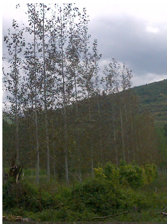
Alineación de chopos con ataque de Melampsora larici-populina .

Pero ya no se buscan nuevos clones por su resistencia completa, para evitar la aparición de nuevas virulencias de la enfermedad, sino que, en las nuevas selecciones, se pretende una resistencia parcial que permita la presencia del hongo, pero con daños que sean asumibles en los cultivos.