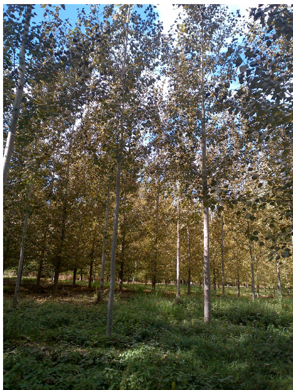
Chopera atacada por Melampsora larici-populina .

razas de Melampsora larici-populina , denominadas E1, E2, E3, E4 y E5, con “E”, que significa Europa.