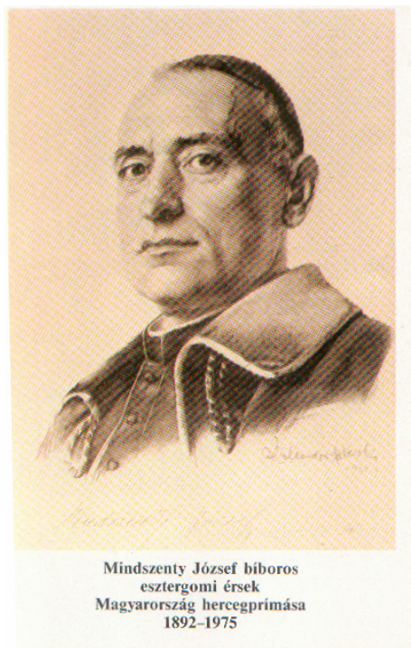
Mindszenty József bíboros esztergomi érsek Magyarország hercegprímása 1892–1975

„Így engedtek el bennünket az útra. Ne féljünk, hogy a reverendánkat sáros csizmájukkal dörgölik be, a reverenda edzett ruha. A 40 esztendő átéltek úgy, hogy akik gyaláztak bennünket, elhullottak, vagy elhullanak, akik áldottak minket, azok velünk együtt áldottan élnek. Azért imádkozzatok papjaitokért, általában a papokért, a kispapokért, hogy legyenek hűségesek a jóban, a hívek szolgálatában és Krisztus útjának egyengetésében, amely az egyetlen út az örök élet felé. Ebből a főpásztori szózatból lehet okulni, lehet tanulni!”