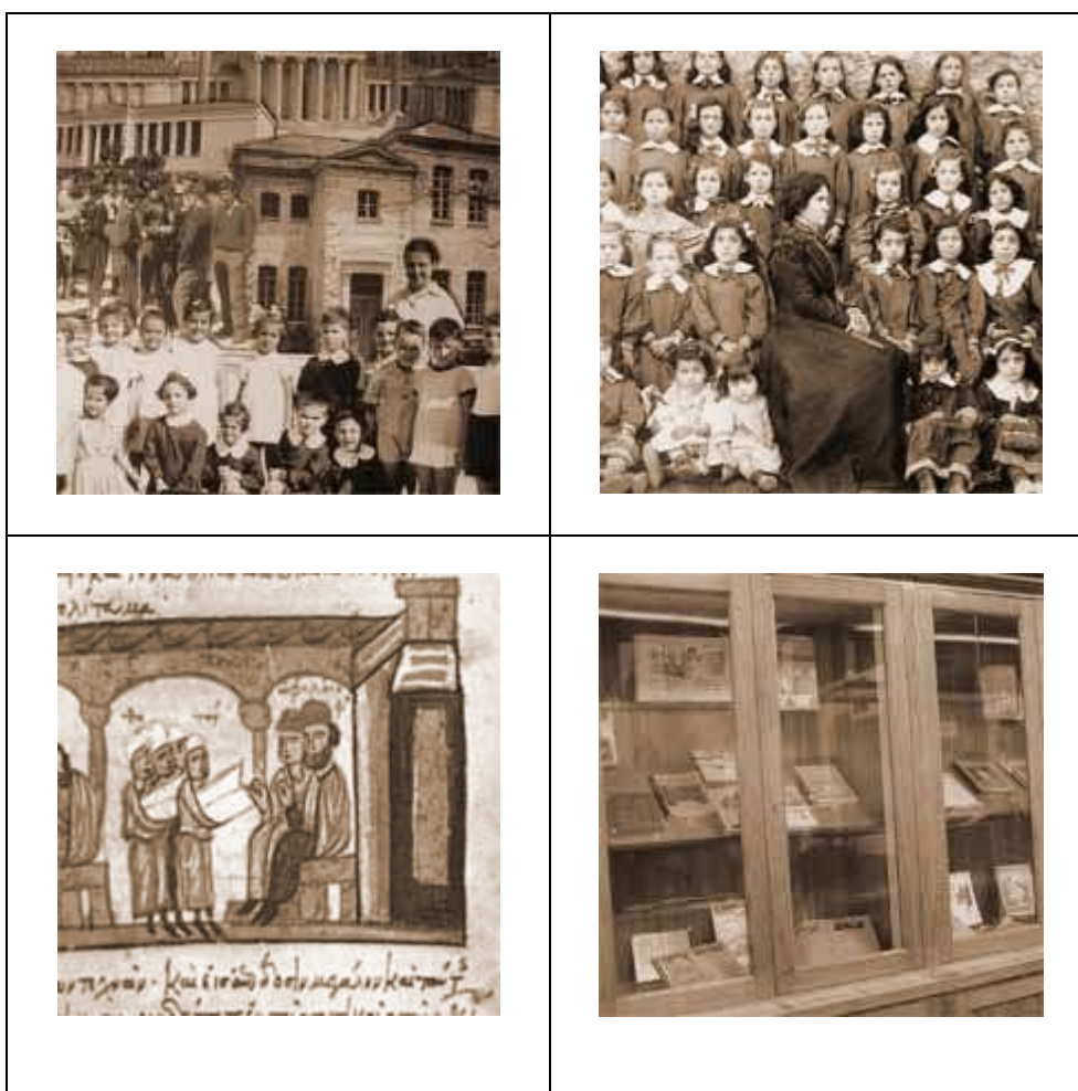
Εικόνες από το Μουσείο Ιστορίας της Παιδείας του Τομέα Παιδαγωγικής