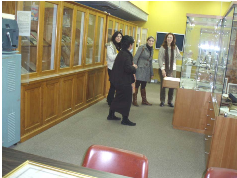
Ενημέρωση για τα εκθέματα του Μουσείου της Παιδείας

'Εικόνες από τη Νεοελληνική Εκπαίδευση και Παιδεία'.