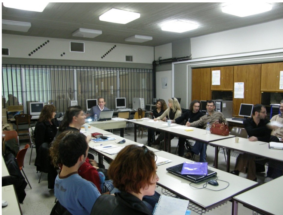
Μάθημα στο Εργαστήριο Εκπαιδευτικής Τεχνολογίας