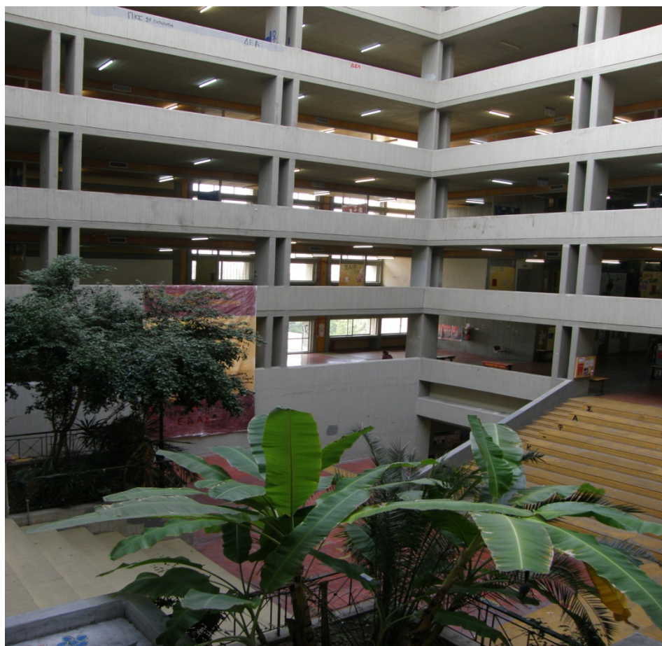
Εσωτερική άποψη της Φιλοσοφικής Σχολής