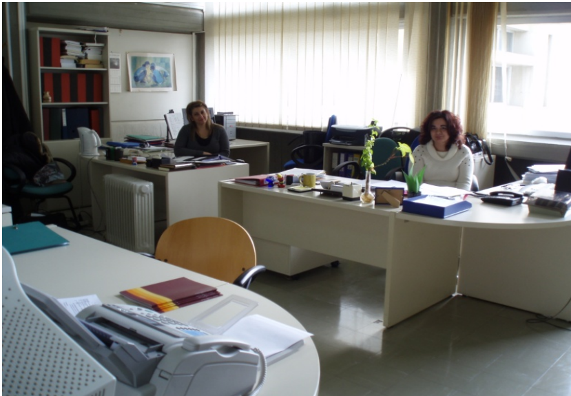
Η Γραμματεία του Τομέα Ψυχολογίας