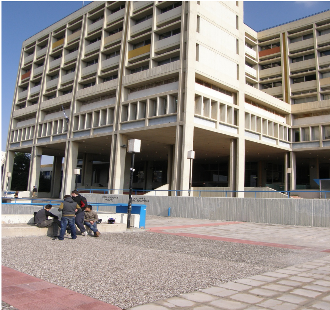
Εξωτερική άποψη του κτηρίου της Φιλοσοφικής Σχολής