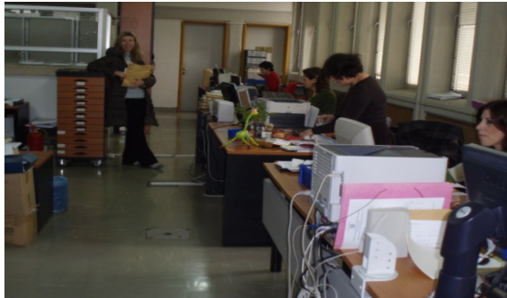
Όψεις της Γραμματείας του Τμήματος Φ.Π.Ψ.

Ο φοιτητής επιλέγει την κατεύθυνση που επιθυμεί στο Γ' Εξάμηνο των σπουδών του.