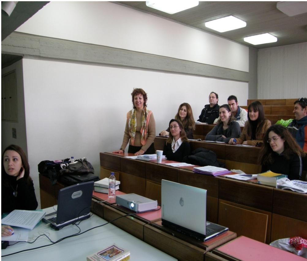
Μάθημα σε αίθουσα της Φιλοσοφικής Σχολής