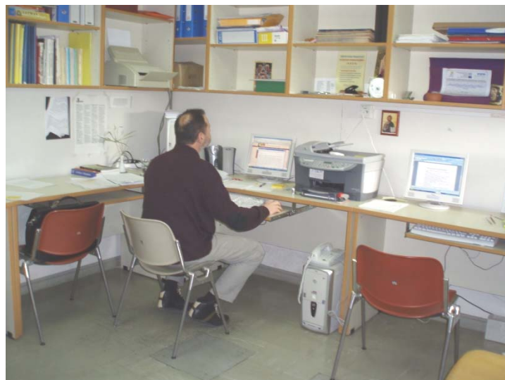
Αίθουσα υπολογιστών του Κέντρου Σ.Ε.Π.

Το ΚΣΕΠ έχει οργανώσει σημαντικό αριθμό επιστημονικών και ενημερωτικών ημερίδων και ερευνών με θέματα που άπτονται του Επαγγελματικού Προσανατολισμού, έχει συμμετάσχει σε επιστημονικές εκδηλώσεις οι οποίες έχουν πραγματοποιηθεί από άλλους φορείς και έχει στηρίξει ενεργά την εκπαίδευση των προπτυχιακών και μεταπτυχιακών φοιτητών στο παραπάνω αντικείμενο και ιδιαίτερα την πρακτική τους άσκηση. Ασχολείται, τέλος, με την προσαρμογή στην ελληνική πραγματικότητα διαφόρων δοκιμασίες Επαγγελματικού Προσανατολισμού.