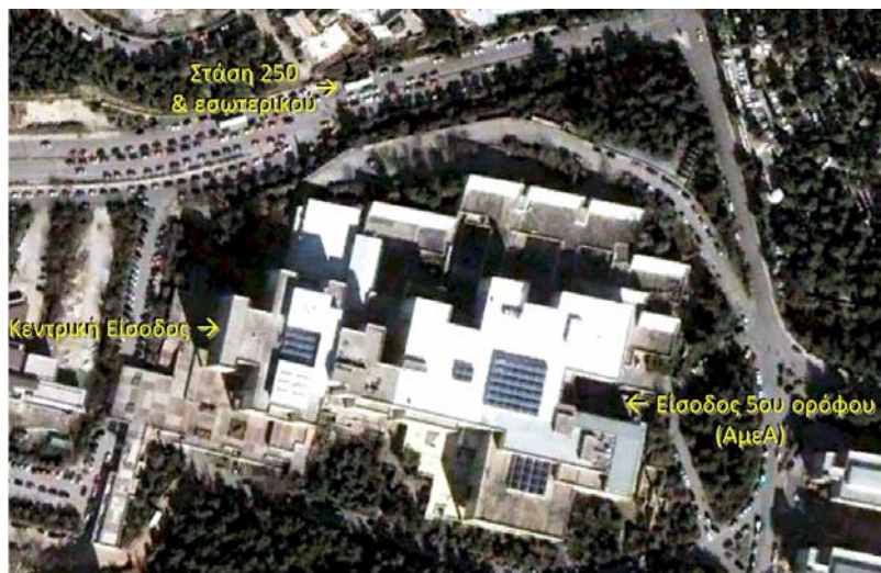
Αεροφωτογραφία του κτηρίου της Φιλοσοφικής Σχολής και του περιβάλλοντος χώρου