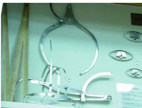
Κυρτοί διαβήτες. Χρησιμοποιήθηκαν για μετρήσεις.