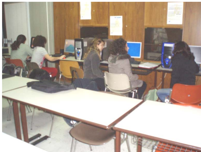
Φοιτητές σε ώρα μαθήματος στο Εργαστήριο Εκπαιδευτικής Τεχνολογίας