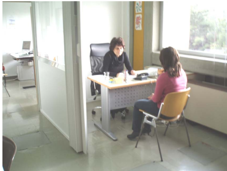
Συμβουλευτική συνέντευξη στο Κέντρο Σ.Ε.Π.

Σκοπός του Κέντρου είναι: α) η παροχή υπηρεσιών Επαγγελματικής Συμβουλευτικής και Προσανατολισμού σε φοιτητές του Πανεπιστημίου Αθηνών, κυρίως, αλλά και σε άλλα πρόσωπα, β) η ανάπτυξη δραστηριοτήτων σχετικών με την επαγγελματική ενημέρωση των φοιτητών και την επιμόρφωση εκπαιδευτικών στο παραπάνω αντικείμενο, γ) η διεξαγωγή σχετικών μελετών και ερευνών, δ) η άσκηση των προπτυχιακών και κυρίως των μεταπτυχιακών φοιτητών στην Επαγγελματική Συμβουλευτική και ε) η υποστήριξη, γενικά του λειτουργούντος στο Τμήμα Φ.Π.Ψ. προγράμματος μεταπτυχιακών σπουδών στη Συμβουλευτική και στον Επαγγελματικό Προσανατολισμό.