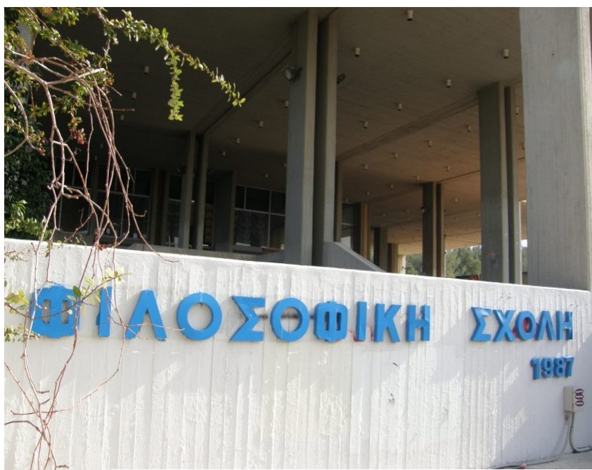
Η είσοδος της Φιλοσοφικής Σχολής