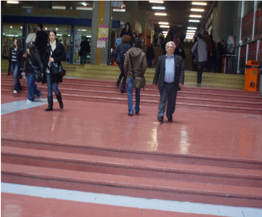
Άποψη της κεντρικής εισόδου της Φιλοσοφικής Σχολής