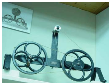
Χειροκίνητος περιστροφέας χρωμάτων. Χρησιμοποιείται για την περιστροφική κίνηση του δίσκου Maxwell, με τον οποίο διαπιστώνεται η ικανότητα αναγνώρισης της πυκνότητας και λαμπρότητας των χρωμάτων.