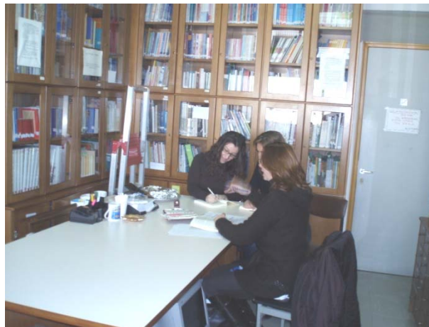
Ομάδα εργασίας του Κέντρου Διαπολιτισμικής Αγωγής

Μέχρι τώρα το Κέντρο έχει αναλάβει την ανάπτυξη και την εφαρμογή ερευνητικών προγραμμάτων σχετικών με: τη διαπολιτισμική εκπαίδευση-επιμόρφωση των εκπαιδευτικών (1996-98) και την εκπαίδευση των παλιννοστούντων και των αλλοδαπών μαθητών (1997-99).