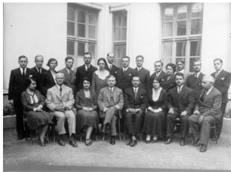
Ο ιδρυτής του Εργαστηρίου, Καθηγητής κ. Ν. Εξαρχόπουλος (κάτω σειρά, 4ος από αριστερά), μαζί με τους συνεργάτες του

Το Εργαστήριο Πειραματικής Παιδαγωγικής (ΕΠΠ) ιδρύθηκε από τον Νικόλαο Εξαρχόπουλο το 1923 και προσαρτήθηκε στην Έδρα της Παιδαγωγικής της Φιλοσοφικής Σχολής του Πανεπιστημίου Αθηνών. Μετά την ίδρυση του Πειραματικού Σχολείου του Πανεπιστημίου Αθηνών (ΠΣΠΑ) το 1929, το ΕΠΠ στεγάστηκε στο κτήριο του Πειραματικού Σχολείου, στη συμβολή των οδών Λυκαβηττού και Σκουφά, στην Αθήνα.