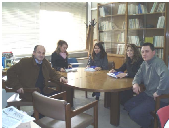
Ομάδα του Κέντρου Περιβαλλοντικής Εκπαίδευσης σε ώρα εργασίας