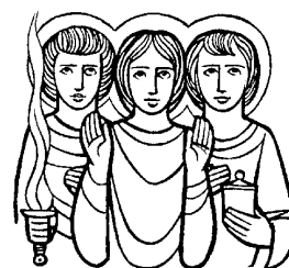
SANTI ARCANGELI MICHELE, GABRIELE e RAFFAELE

Non c'è la celebrazione della Messa ma la celebrazione delle Lodi