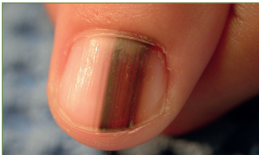
FIG. 5 : Mélanonychie longitudinale.

Toute mélanonychie longitudinale isolée doit faire l'objet d'une surveillance