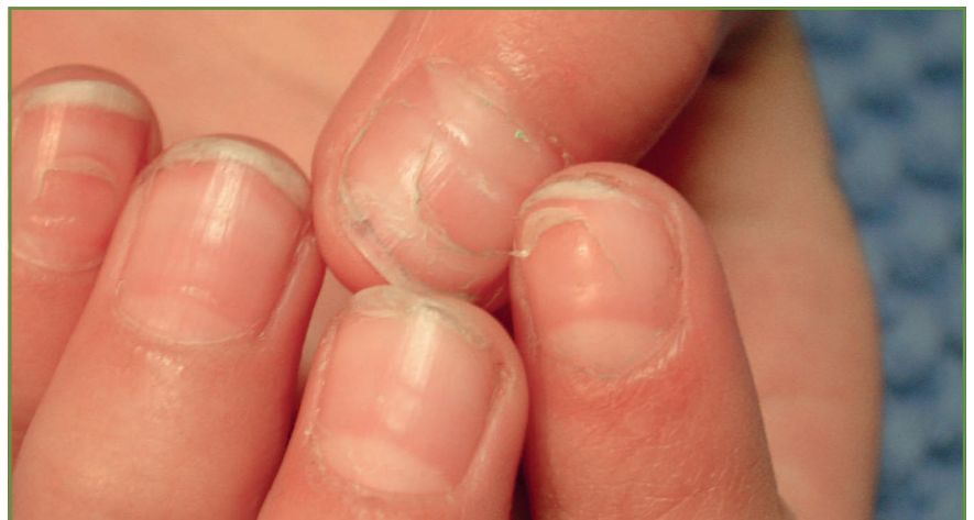
FIG. 4 : Onychomadèse.