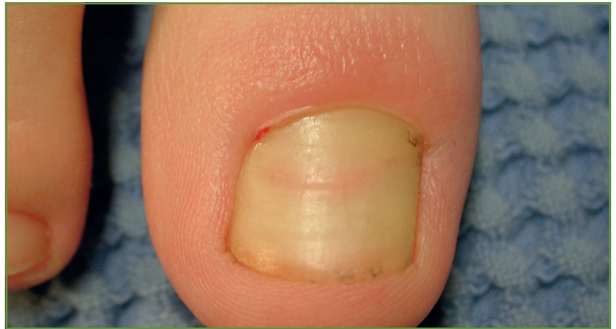
FIG. 2 : Rétronychie.

Remise au goût du jour par des publications récentes [3], mais décrite depuis déjà longtemps, on rappelle la possibilité d'onychomadèse faisant suite à un syndrome pieds-mains-bouche ( fig. 3 et 4 ). Ce tableau clinique affole les parents qui pensent souvent que seule une maladie grave peut expliquer la chute quasi simultanée des ongles des doigts et des orteils. Cette onychomadèse fait suite à un syndrome pieds-mains-bouche qui le précède de 3 mois le plus souvent. On retrouve, à l'interrogatoire, la notion d'une épidémie dans la crèche ou dans l'école quelques semaines avant. L'évolution est spontanément favorable, et ne justifie aucun traitement.