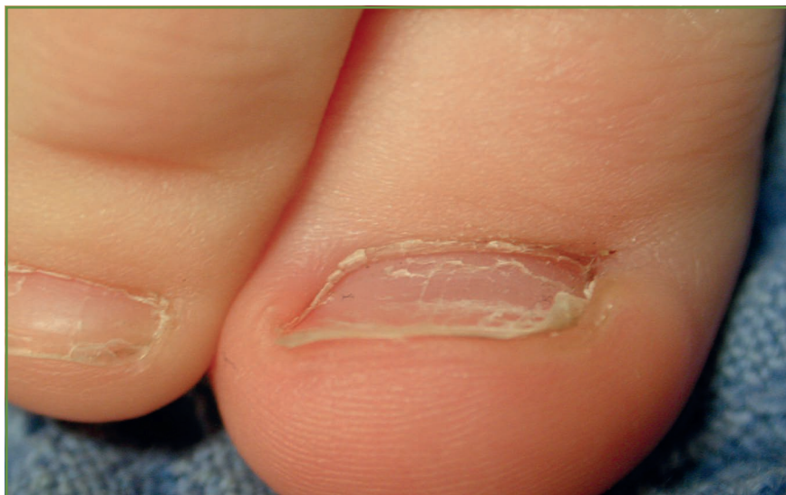
FIG. 1: Koïlonychie.

mouvements de pédalage effectués dans son lit par le nourrisson à plat ventre. D'autres auteurs, au contraire, l'attribuent au port de chaussures fermées et/ou à la fréquence des contacts avec l'eau (bain quotidien). Elle disparaît dans un délai variable de 6 mois à 2 ans après l'acquisition de la marche. L'association d'une koïlonychie et d'une carence ferrique est un classique qui reste à confirmer : la littérature à ce sujet demeure maigre et assez ancienne.