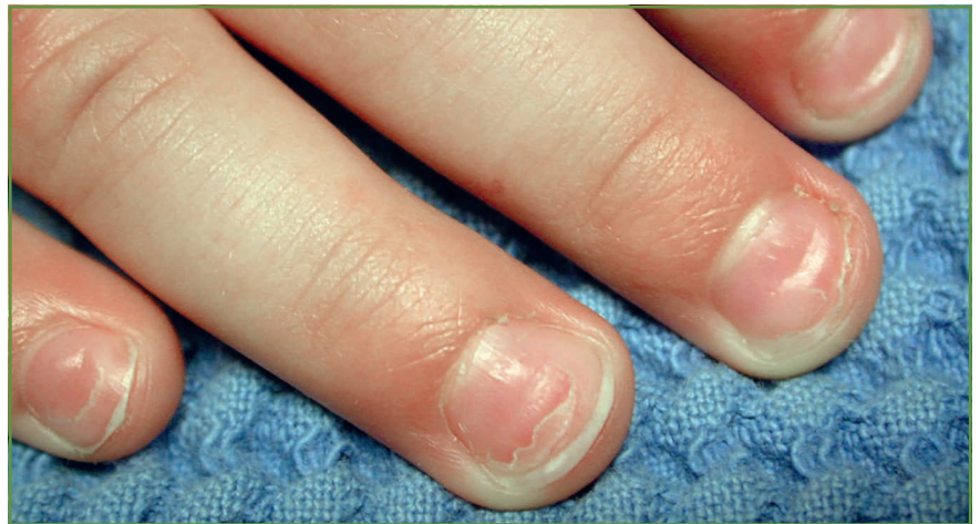
FIG. 3 : Onychomadèse.