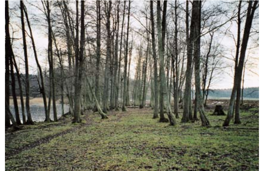
Ryttnäset vid sjön Nävden

Ryttnäset köptes in av kommunen i slutet av 80-talet för att användas för fri-luftsändamål, men ambitionerna med badplats och vandringsstigar har hittills inte förverkligats. Ryttnäset betas hårt av stora köttasdjur ända ut på de löv-