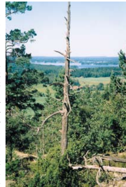
Utsikt från Strandmora klintar

Strandmora klintar (d.v.s. den egentliga Strandmora klint och Lillklinten) utgjorde efter istiden en isolerad klippholme i det stora smältvattenområde, som täckte i princip hela kommunen. I dag är klintarna fina utsiktsberg, med vidsträckt utsikt över bygden kring Bäsingen. Bergsmassivet är geologiskt intressant. Berggrunden består delvis av grönstenar. På bergstopparna växer gles tallskog. Mindre vanliga växter som man kan finna på klintarna är bl.a. getrams och vårspärgel. På Lillklinten växer även gaffelbräken och svartbräken. Enligt skalden Erik Axel Karlfeldt är berget också hemvist åt en vän jungfru, ett naturväsen som han besjunger i dikten "Hembygdens huldra".