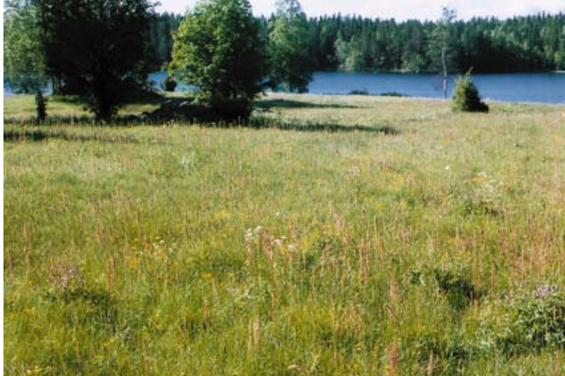
Slätteräng vid Stora Konnsjön

250 meter sydväst om slätterängen ligger Konnsjö gård. Här finns ett litet domänreservat med, för Avestatrakten, ovanlig vegetation. Värmen i sydslutningen ner mot bäcken gör att ask och lönn här trivs bra och föryngrar sig naturligt. Här växer även den sällsynta tibasten, som på våren blommar vackert på bar kvist.