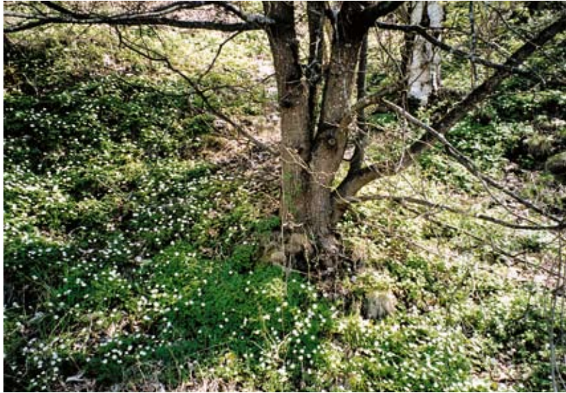
Vitsippor längs Älvpromenaden.

tidigt på våren och stora mattor av vitsippor breder ut sig under träden. Här finns också spår av bäver. Längs Älvpromenaden finns bänkar och grillplatser.