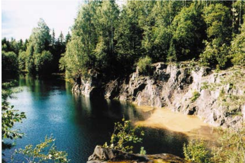
Kalkbrottet i Valla

tibast. I hyttområdet, som omges av en lummig lövskogsdunge, växer även olvon, skogstry, måbär, nejlikrot och orkidén tvåblad. Tidigare var floran i Valla ännu rikare, men några rariteter har tyvärr försvunnit på grund av igenväxning och skogsbruksåtgärder.