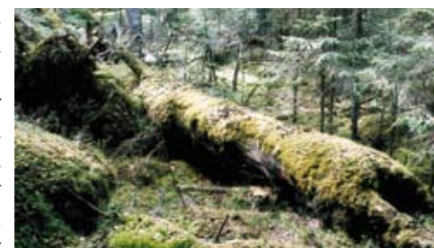
Trollskog i Ödet

Om man letar lite kan man även hitta spår som avslöjar lite om skogens historia. Några gamla, handsågade stubbar minner om äldre tiders skogsbruk. På några stubbar finns också kolad ved och brandljud (skador efter brand), vilket tyder på att en skogsbrand härjat i området för länge sedan. Denna brand har troligen bidragit starkt till det stora lövinslaget och därmed till områdets höga naturvärden.