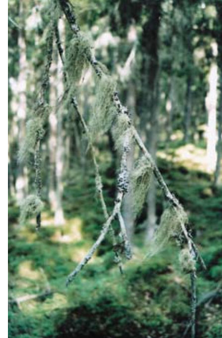
Rikligt med hänglavar växer på träden vid Krokbacken

Ca 1 km norr om Konnsjöslingan rinner Krokbacken i en dalsänka mellan Skallberget och Knaperberget. Slutningarna ner mot bäcken domineras av högvuxen barrskog av naturskogstyp. På träden växer rikligt med hänglavar, bl.a. den sällsynta violettgrå tagellaven. Det är gott om döda och kullfallna träd, vilket bl.a.