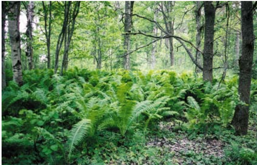
Strubräken, Vidön i Bysjöholmarnas naturreservat

Strandskydd gäller vid sjöar och vattendrag för att stränderna ska vara tillgängliga för alla och för att värna den biologiska mångfalden, som gynnas av den höga luftfuktigheten och karaktären av gränsszon mellan olika livsmiljöer (biotoper) vid stränder och tillhörande våtmarker.