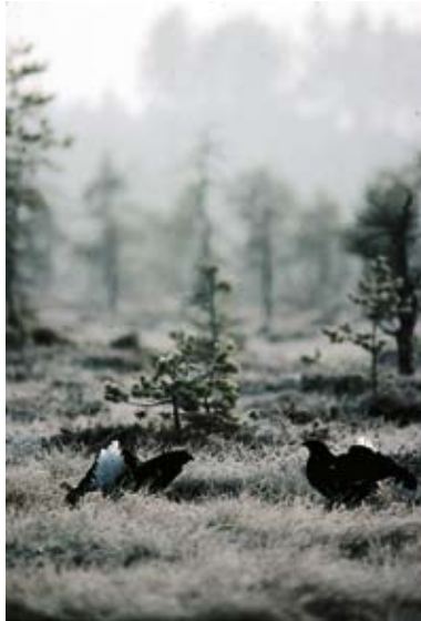
Orrspel på Bredmossen

som är ett domänreservat, finns ett antal grova och uppemot 30 m höga granar. Stigen genom området är en del av Bruksleden. I vägkanten norr om gamla Norbergsvägen, mellan mässingsbruket och Tråbacken, växer fjällnejlika, som annars främst påträffas i fjällen. Fjällnejlika är en av de få växter som trivs på marken som är starkt förorenad av koppar och galmeja (en zinkförening) som användes vid mässingsframställningen.