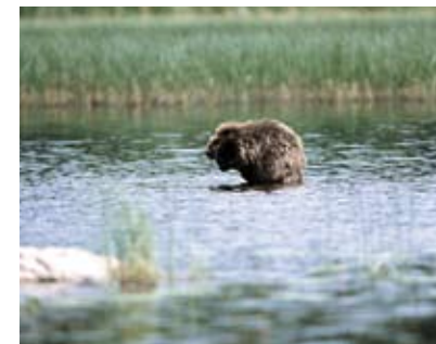
och dess invånare

Hagviken och hela åshuvudet har med största sannolikhet varit betesområde. På åschrönet går en bred stig ända ut på udden. Längst ut finns en användbar eldstad.