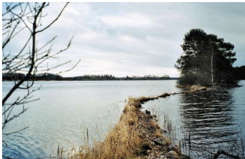
Möklintaåsen i Bysjön

Möklintaåsen sträcker sig ut i Bysjön som en lång landtunga, åshuvudet, och sticker sedan upp ur Bysjön i form av några långsmala öar, Bysjöholmarna. På Bysjöholmarna och kring Österviken växer länets största ädellövbestånd med bland annat ek, lind och hassel. På öarna finns även gott om jätteträd av bl.a. ek, asp och tall. Sådana jätteträd är en förutsättning för att fåglar som havsörn och fiskgjuse ska kunna hitta lämpliga boträd. Båda dessa arter visar sig regelbundet i området. Många av träden är döda, vilket bidrar starkt till den rika insekts- och fågelfaunan, med flera hotade arter. Vitryggig hackspett påträffades tidigare regelbundet i trakten liksom utter. Bävern har på några av öarna lämnat tydliga spår efter sig.