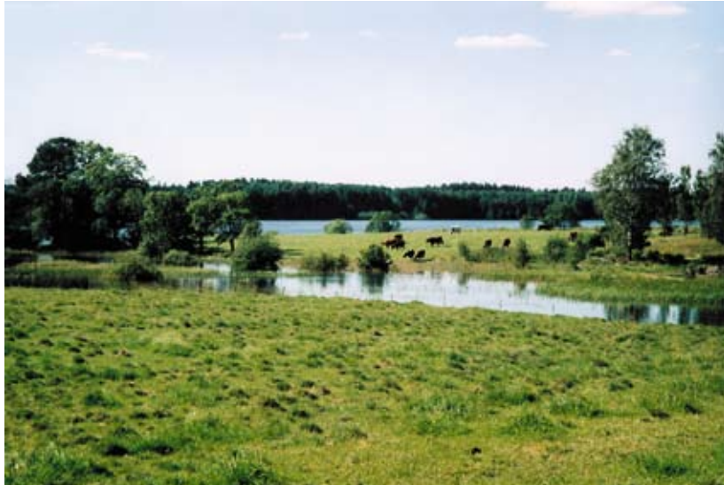
Beteslandskap i Fullsta

I reservatet finns även en del grova, självföryngrande ekar. Hagmarken hålls öppen av betande nötboskap. Intressanta växter i området är blåsippa, åkerbär, vårärt och strandviol. Efter stränderna växer bågsäven, som har en mycket begränsad utbredning i landet.