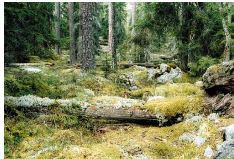
Gammal opåverkad skog i domänreservatet Gårdsjöarna