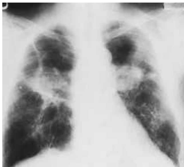
Neumoconiosis complicada del minero del carbón.

Entre los mineros asturianos, los barrenistas que trabajan con porcentajes altos de sílice presentan FMP con una frecuencia de 2 a 1 en relación a los picadores, a pesar de que inhalan mayor cantidad de polvo respirable (Figura 2).