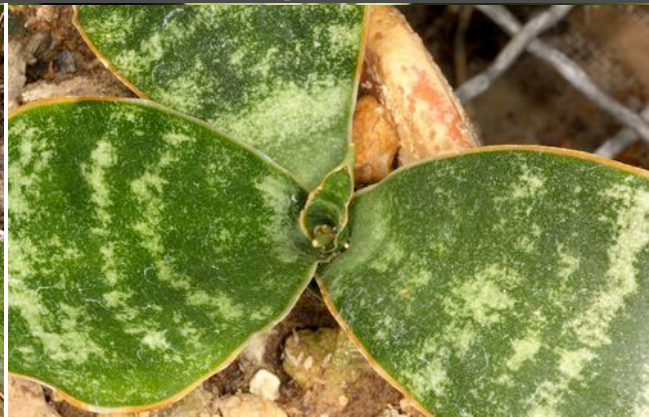
Sansevieria aff. liberica = PF 0103