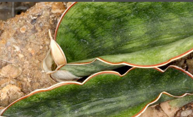
Sansevieria raffillii = PF 1008