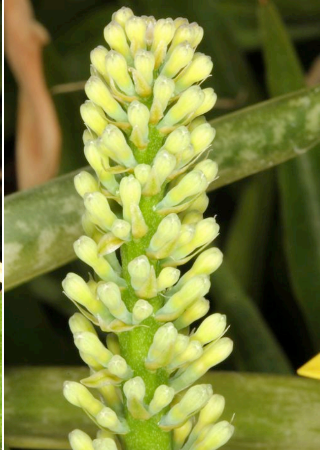
Sansevieria subspicata = PF 0115