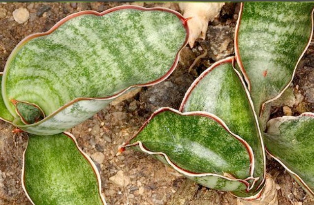
Sansevieria hyacinthoides = PF 0156