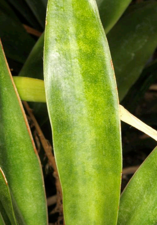
Sansevieria subspicata = PF 0115