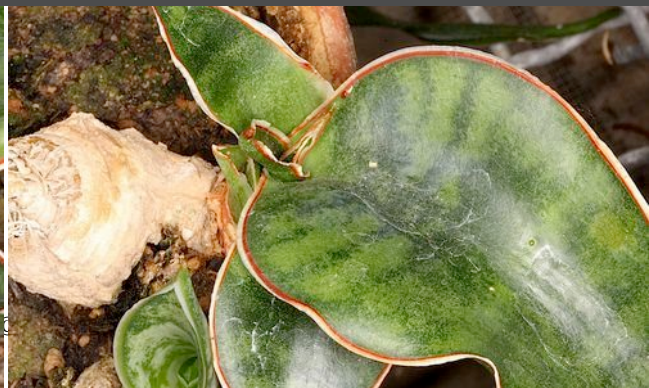
Sansevieria raffillii = PF 1624