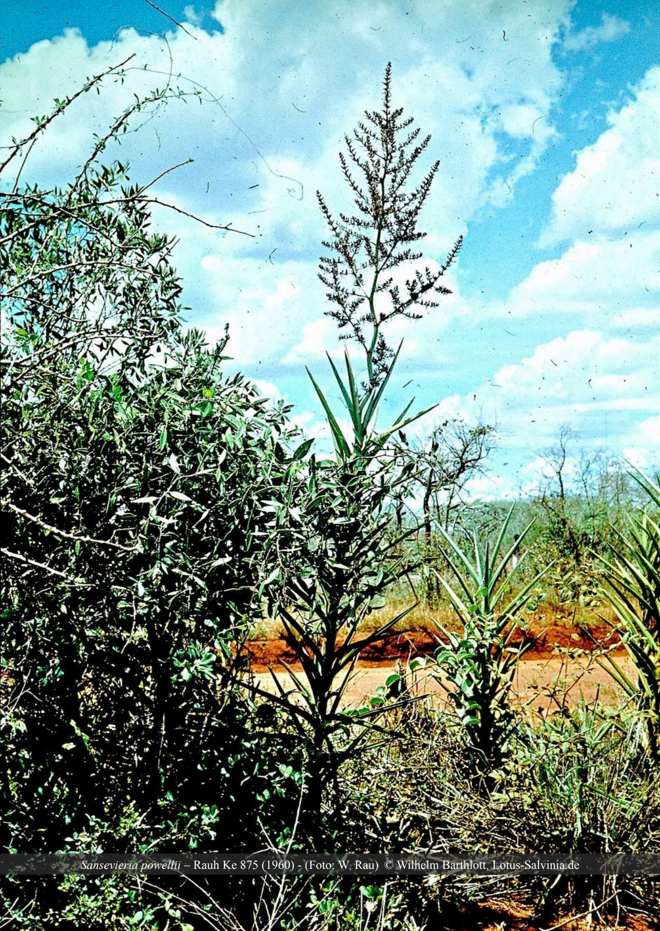
Sansevieria powellii – Rauh Ke 875 (1960)