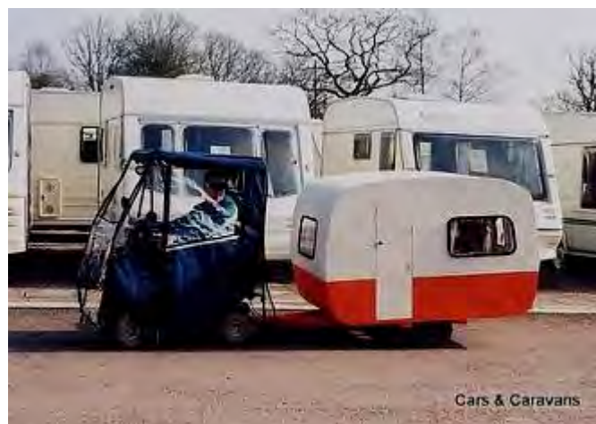
Cars & Caravans

Partykeer kom 'n mens darem maar vreemde