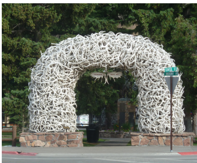
Photo 56. Arches en bois de wapitis à Jackson (Wyoming), © P. RABAUTE