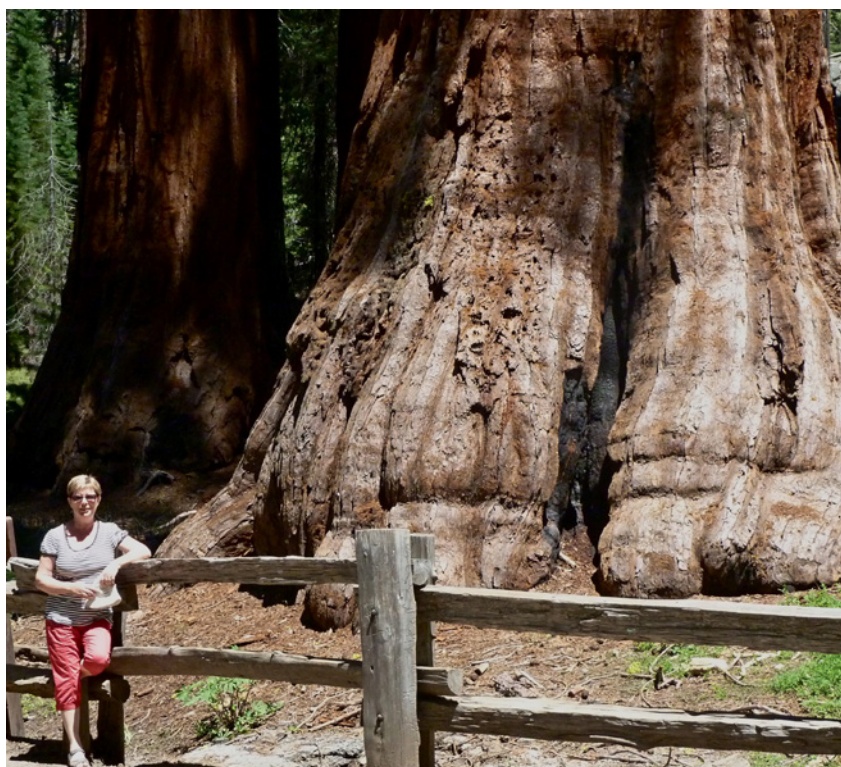
Photo 18. Sequoiadendron giganteum (Lindl.) J. Buschholz

à odeur spermatique, Eriophyllum lanatum (Pursh) Forbes sensu lat. et Lotus purshianus Clem. & E.G. Clem., lotier à fleurs roses présentant une fleur unique par inflorescence et dont l'étendard est strié.