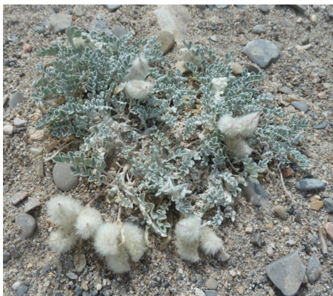
Photo 54. Astragalus utahensis (Torr.) Torr. & A. Gray, © P. RABAUTE