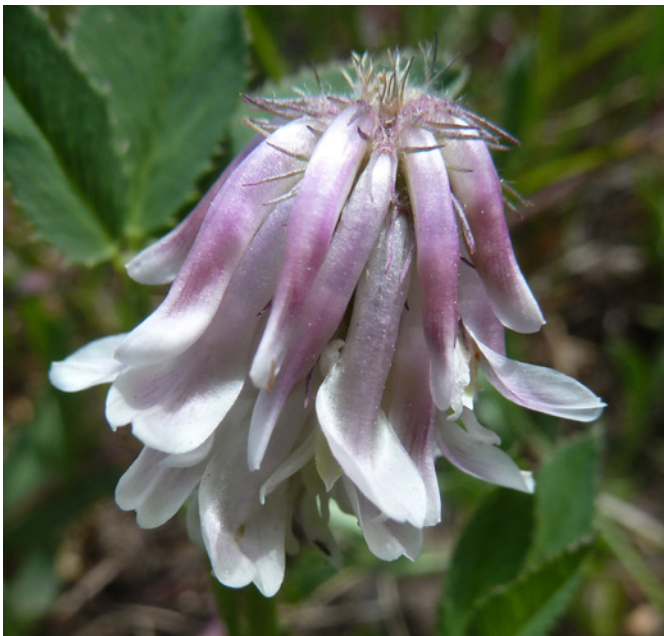
Photo 41. Trifolium eriocephalum Nutt. subsp. villiferum (House) J.M. Gillett