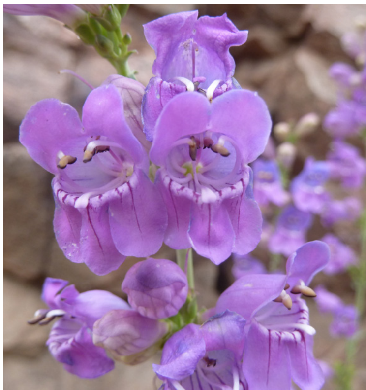
Photo 39. Penstemon virgatus Grau subsp. asa-grayi Crooswhite

de rouge, Astragalus lentiginosus Douglas ex Hooker var. palans (M.E. Jones) M.E. Jones, Grindelia squarrosa (Pursh) Dunal et une graminée rougeâtre très abondante, longuement aristée, Aristida purpurea Nutt.