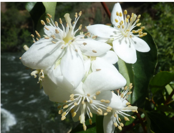
Photo 22. Philadelphus lewisii Pursh var. californicus A. Gray