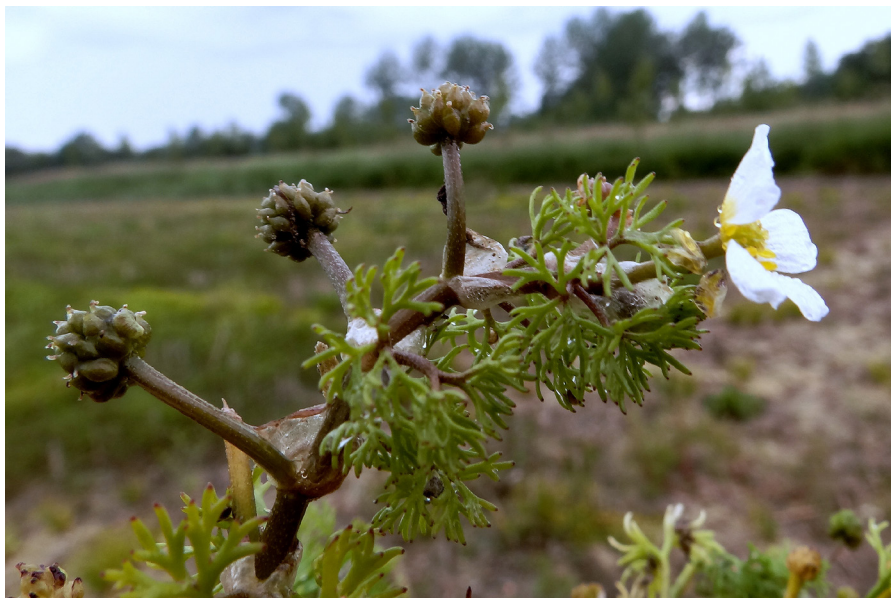
Photo 23c. Ranunculus trichophyllus subsp. trichophyllus