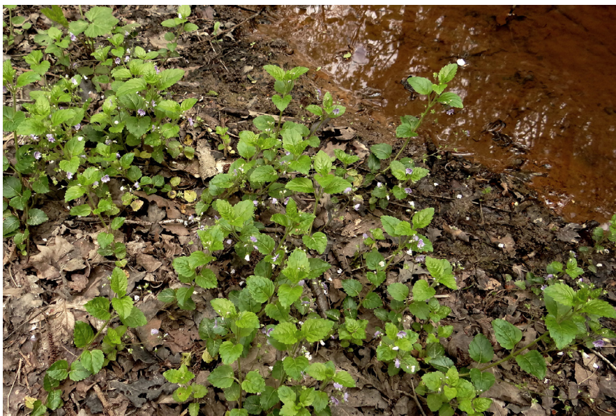
Photo 27. Veronica montana

La Font Bonne, pont du ruisseau La Marguerite - Soubran