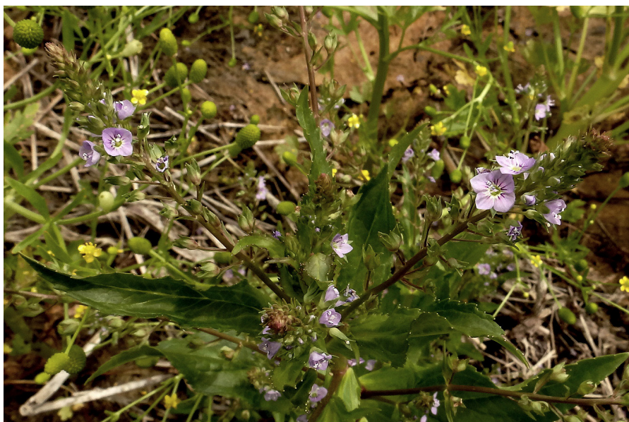
Photo 24b. Veronica x lackschewitzii J.B. Keller

de la RD 25, 06/06/2016 ; les lemnes fertiles, longues de 4 mm tout au plus, évitent de confondre cette sous-espèce réputée nord-atlantique (présente ici en compagnie d' Avellinia festuroides !) avec la forme à lemnes glabres de V. ciliata ; le statut de cette sous-espèce dans la région serait à revoir.