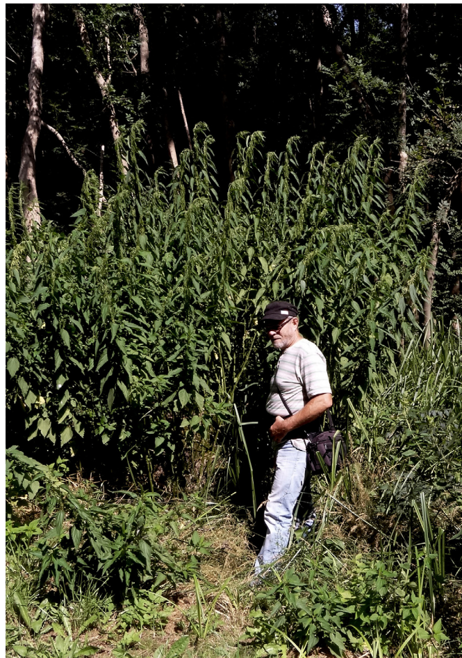
Photo 26. Urtica dioica subsp. galeopsifolia (Opiz) Chrtk

• Zea mays subsp. parviglumis H.H. Iltis & J.F. Doebley (Photo 25) : la téosinte de Balsas, Brives-sur-Charente, parcelle de l'Écluse longeant la RD 135 à la sortie de Brives-sur-Charente, dans une culture de maïs rive droite de la Charente ; la plante se présente sous la forme d'une grande tige de 1,50-2,20 m de hauteur, plus ou moins ramifiée à partir de la base et portant, au sommet des rameaux, une panicule d'épis mâles digités par 4-15, des épis femelles engainés de spathes aussi longues qu'eux, à caryopses en forme de dent, imbriqués sur un rang de grains alternes déhiscents à maturité et surmontés le plus souvent d'un épi mâle dépassant les spathes. Cette espèce originaire du Mexique serait l'ancêtre de nos maïs cultivés mais il est encore trop tôt pour donner un nom définitif à cette sous espèce récemment signalée par Jean-Claude Melet