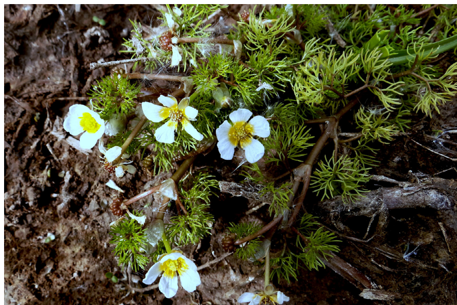
Photo 23b. Ranunculus trichophyllus subsp. trichophyllus , © C. YOU

• Trifolium ornithopodioides L. : Moragne, les Tourettes, tonsure à trèfles à l'entrée d'une prairie mésohygrophile pâturée, quelques dm 2 , 03/06/2016.