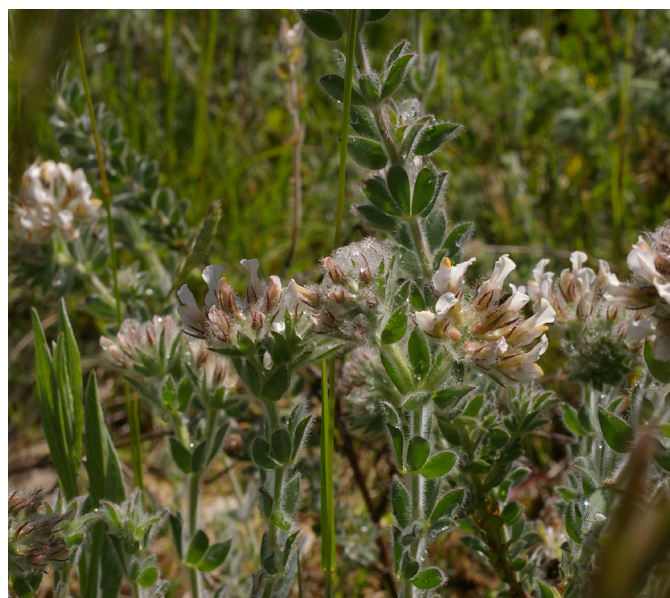
Photo 17. Lotus hirsutus (= Dorycnium hirsutum ), Le Monestier, 2016

• Rhagadiolus edulis Gaertn. : La Tremblade, forêt de la Coubre, parking à l'ouest de la maison forestière de la Bouverie, plusieurs dizaines de pieds dans les pelouses rudéralisées, avec Galium murale , Trifolium suffocatum , Parentucellia latifolia , etc., 28/04/2016.