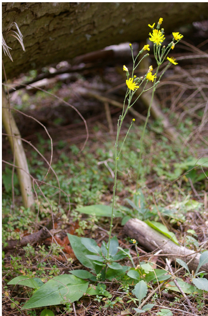
Photo 14. Hieracium subhirsutum (série H. provinciale), Forêt de la Foux, 2015

• Plantago arenaria Waldst. & Kit. : Les Mathes, forêt de la Coubre, secteur du bois de Monsouci, quelques dizaines de pieds sur un talus sablonneux, 18/08/2016 ; l'espèce est assez fréquente sur les layons sableux de l'ensemble de la forêt de la Coubre et nous n'indiquons pas ici les nombreuses autres stations pointées.