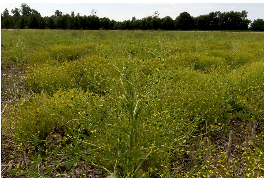
Photo 11. Ancienne culture de maïs exondée colonisée par les renoncules

• Isopyrum thalictroides L. : Cherves-Châtelars, coteau du Châtelars, en-dessous de l'abri rocheux, à l'ouest de la grotte des Fées, 09/04/2015.