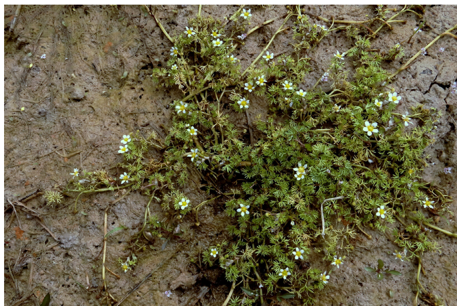
Photo 23a. Ranunculus trichophyllus subsp. trichophyllus