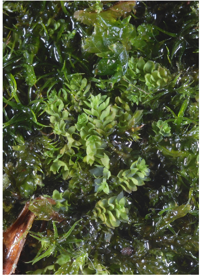
Photo 2. Douinia ovata , escarpements rocheux frais, versant nord du mont Lozère et de l'Aigoual (48 et 30)