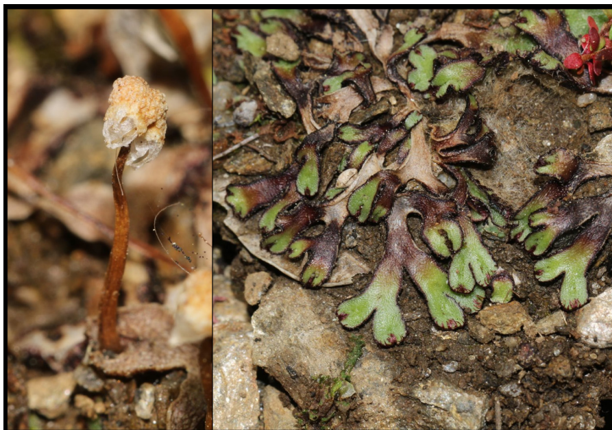
Photo 5. Mannia gracilis , le Cheyla (289 m), Malons et Elze (30), © J.-P. MALAFOSSE

- Génolhac (30130), rochers escarpés en hêtraie 150 m en contrebas et au NE de la tour de Guet des Bouzèdes, alt. 1 320 m, 6/12/2016, herbier ES1821. Il s'agit de la deuxième localité pour le Gard et le PNC. Le cortège des Grimmiacées est remarquable sur ce site : Grimmia longirostris , G. incurva , G. decipiens , G. montana , G. hartmannii ainsi que Racomitrium lanuginosum , R. heterostichum , R. affine et R. sudeticum . On y relève aussi des espèces peu courantes comme Cynodontium strumiferum , Polytrichastrum alpinum , Plagiothecium laetum , Andreaea rothii .