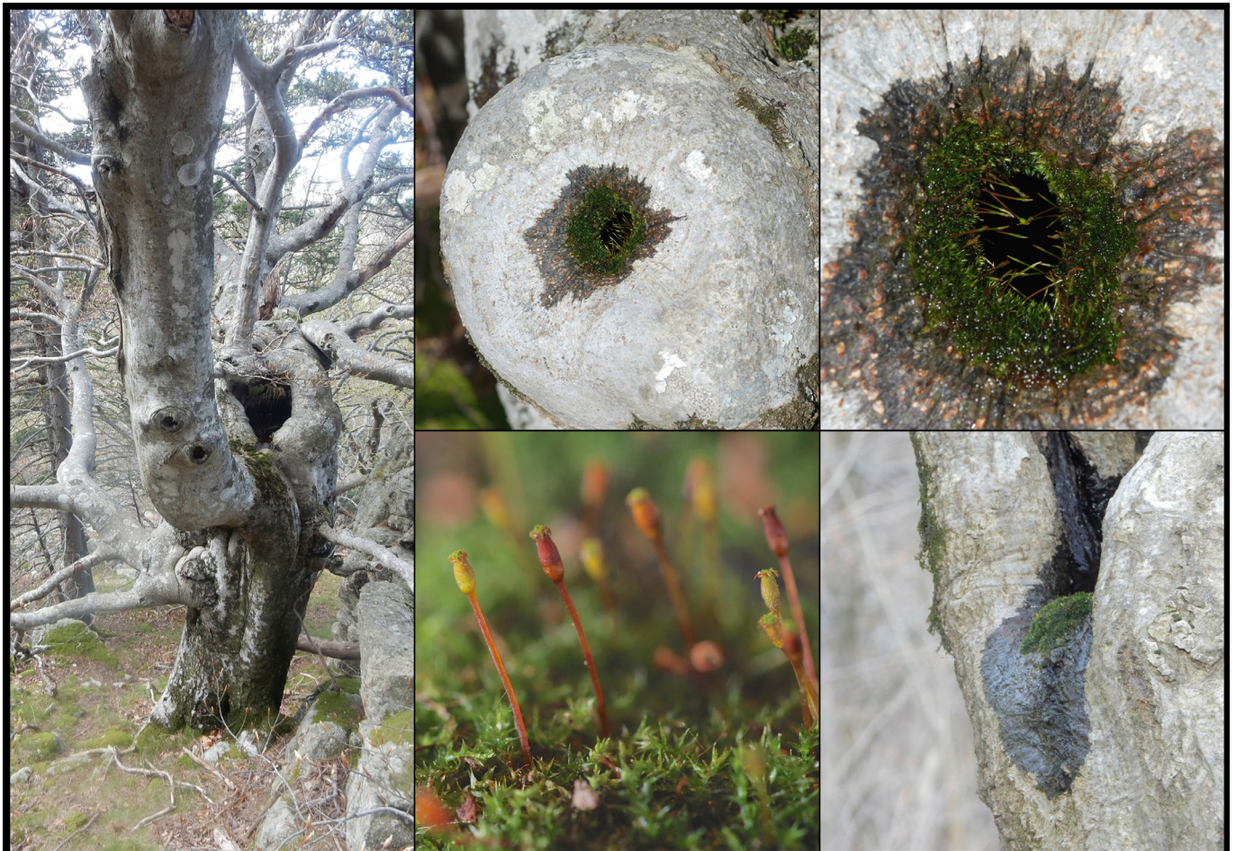
Photo 4. Anacamptodon splachnoides , habitus et habitat, forêt domaniale de Malmontet, mont Lozère est (30), © E. SULMONT

● Tortula atrovirens (Sm.) Lindb. - Vaychis (09325), RD 44, sur paroi rocheuse au sud-est de Vaychis, 17/06/2016. DD, 1923.