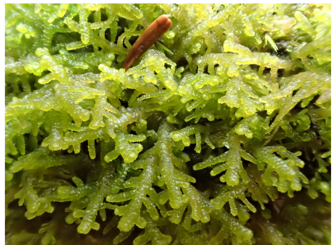
Photo 3b. Lepidozia cupressina (Sw.) Lindenb., détail