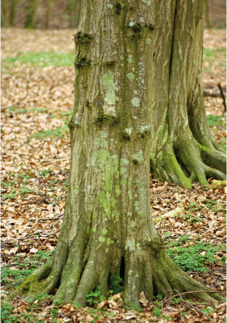
Bild 12: Durch die hohen Stickstoffeinträge aus der Luft in Form von Feinstäuben (Trockendeposition) und über das Niederschlagswasser sind die meisten Stämme unserer Bäume mit einem grünen Schleier einzelliger Algen überzogen. Die früher auf unveralgten Stämmen weit verbreiteten auffälligen Lager weißer Krustenflechten der Gattungen Arthonia , Graphis , Lecanora , Opegrapha , Pertusaria , Thelotrema etc. sind dagegen selten geworden und heute nur noch an wenigen Bäumen zu finden. An der abgebildeten Hainbuche im Vordergrund sind noch einige weißliche Flechtenlager zu erkennen, die auf dem Baum im Hintergrund fehlen.