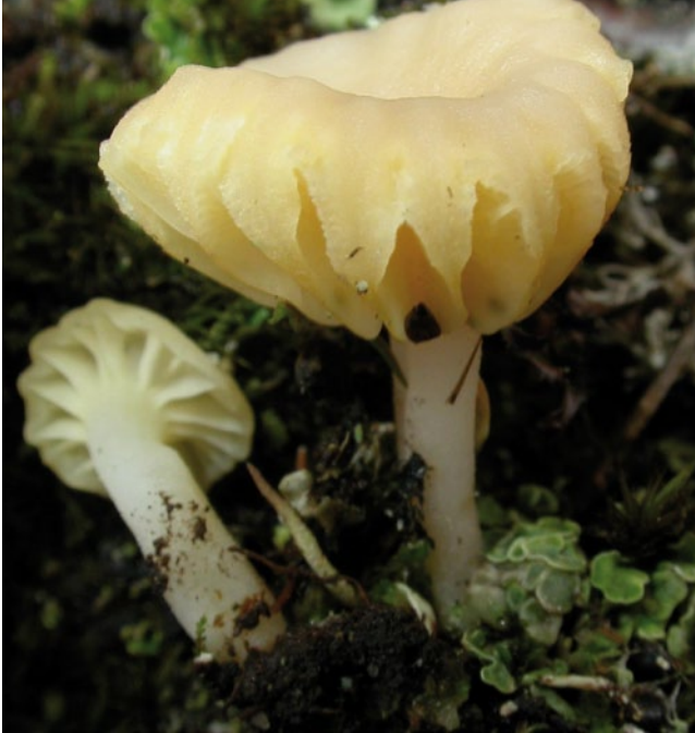
Bild 9: Der Flechten-Nabeling Lichenomphalia hudsoniana galt als verschollen und konnte im Naturschutzgebiet Süderlügumer Binnendünen wieder für Schleswig-Holstein nachgewiesen werden. Er gehört zu den wenigen Flechten, die einen Ständerpilz (Basidiomyceten) als Pilzpartner haben. Der Pilzfruchtkörper ist algenfrei, die Algen leben in einem muschelblättrigen grünen Flechtenlager (unten rechts im Bild) auf humusreichen Sandböden (Foto: M. Lüderitz 2009).

und Wiederausbreitung etlicher auch zuvor gefährdeter und einiger stark gefährdeter Arten wider. Auch macht sich die methodisch neue Bewertung der Rote Liste Kriterien nach LUDWIG et al. (2005) bemerkbar, denn einige sehr seltene Arten, bei denen keine Veränderungen in den Vorkommen festgestellt wurden, werden nun als ungefährdet eingestuft. Ein Vergleich mit der aktuellen Roten Liste der Flechten des benachbarten Bundeslandes Mecklenburg-Vorpommern (LITTERSKI & SCHIEFELBEIN 2007) zeigt jedoch eine ähnliche Verteilung der Arten auf die aktuellen Gefährdungskategorien (Tabelle 8), ein Hinweis, dass die deutlichen Vorgaben im Bewertungsschema nach LUDWIG et al. 2005 vergleichbare Ergebnisse produzieren. Obwohl flächenmäßig kleiner als Mecklenburg-Vorpommern, weist Schleswig-Holstein