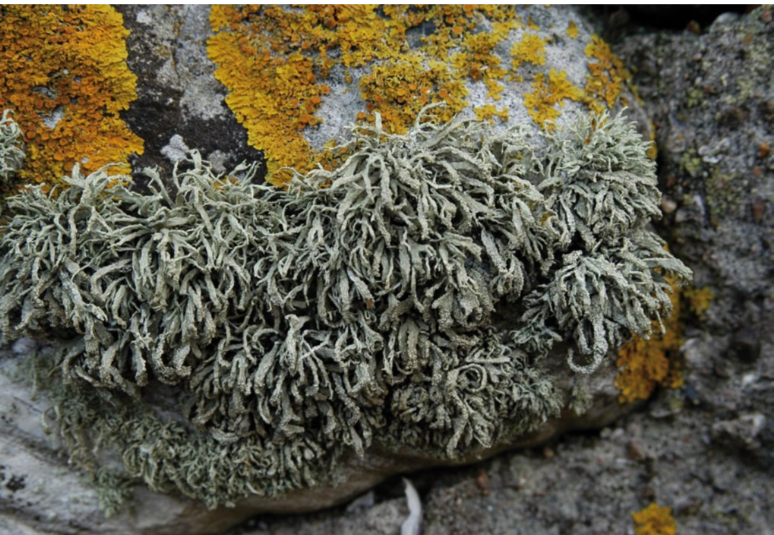
Bild 2: Die Küsten-Astflechte Ramalina siliquosa an einer Gehöftmauer aus Feldsteinen zusammen mit der Gelben Wandflechte Xanthoria parietina auf Föhr.

Beispiel: Ramalina thrausta , eine Reinluftart, deren Vorkommen in Schleswig-Holstein aus dem Sachsenwald östlich von Hamburg aus dem Jahre 1824 belegt ist. Sie ist heute auf montane und boreale Wälder beschränkt und in Norddeutschland seit langem ausgestorben. Bereits ERICHSEN (1957) schreibt, dass das „einstmalige Vorkommen der Art im Sachsenwald dadurch erhärtet wird, dass der noch jetzt ausgedehnte Sachsenwald vor mehr als 100 Jahren ein sehr ursprünglicher Hochwald gewesen ist, in dem jetzt fast nur noch in Bergwäldern zu findende Arten wie Usnea ceratina und Lobaria verrucosa (= L. scrobiculata ) in bester Entwicklung vorkamen. Die moderne Forstwirtschaft hat hier, wie überall, erschreckend aufgeräumt.“ Letzteres bezieht sich auf die Einführung des Kahlschlages und der Nadelholznokulturen im 19. und frühen 20. Jahrhundert.