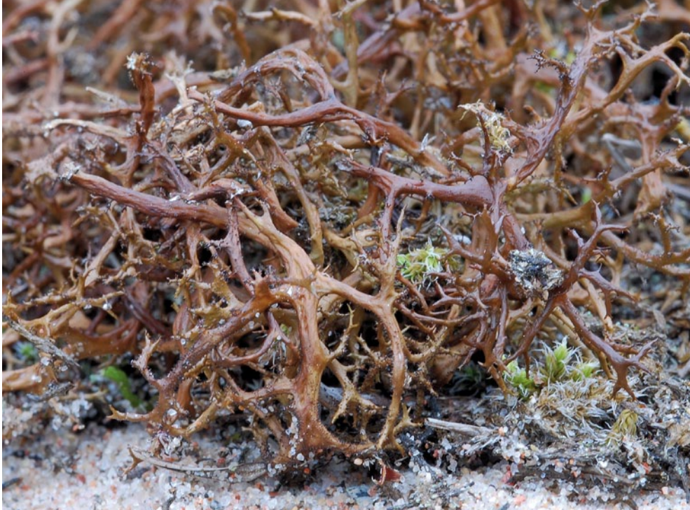
Bild 4: Die Hornflechte Cetraria aculeata ist typisch für lückige und niedrigwüchsige Sand-trockenrasen (Foto: U. Schiefelbein).