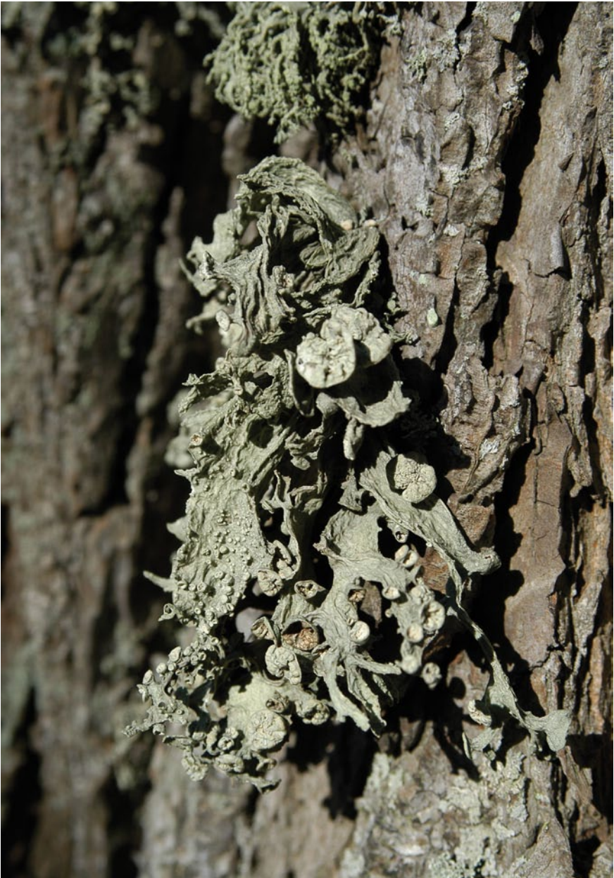
Bild 1: Die Eschen-Astflechte Ramalina fraxinea (RL 2) ist ein Indikator für geringe Luftbelastung und heute nur noch selten an lichtreichen alten Eschen und Ulmen anzutreffen. Sie war früher an Solitär bäumen auf Gehöften und in Alleen verbreitet. Dieses ca. 15 cm lange Exemplar wächst auf einer alten Ulme bei Sehlendorf.