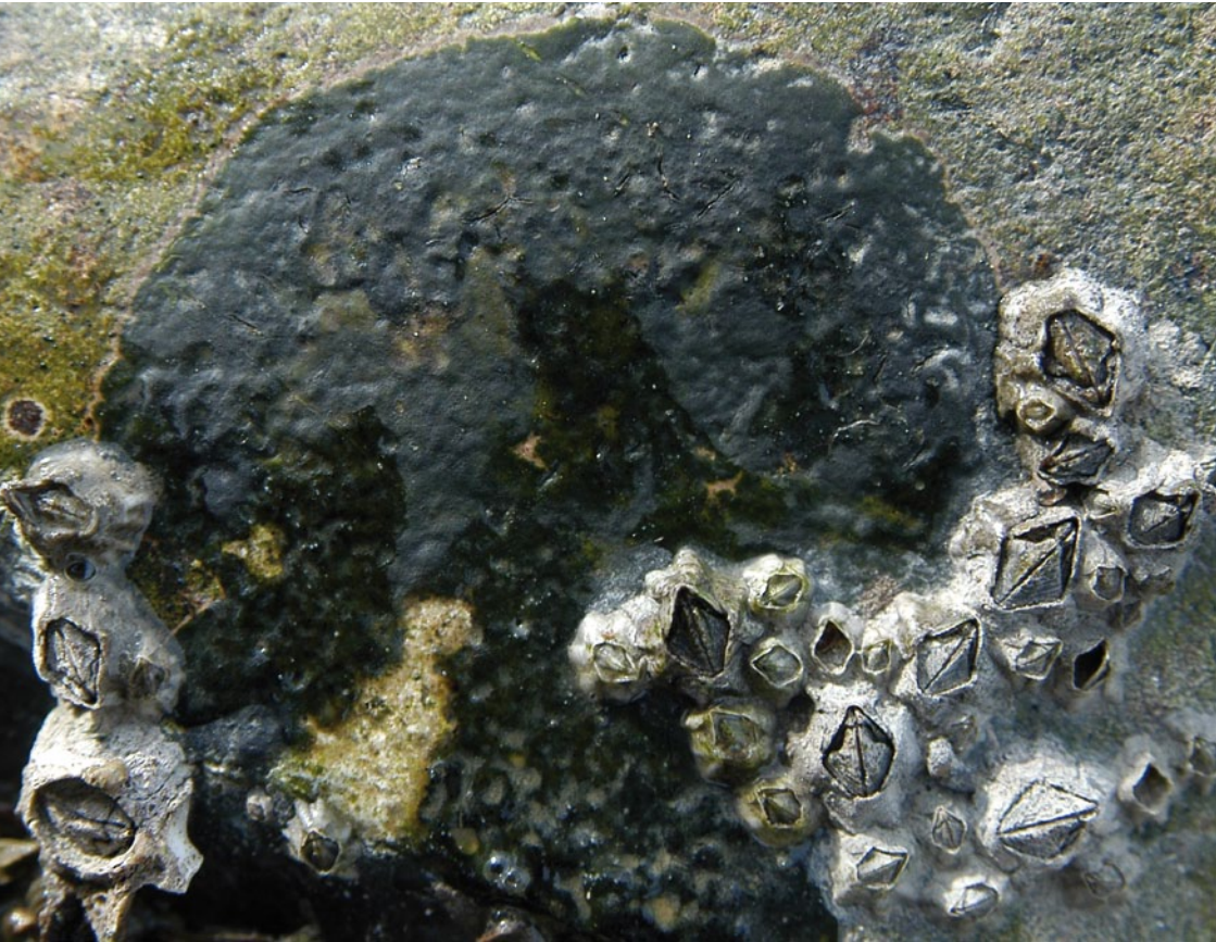
Bild 5: Die dunkelgrüne Meereskrustenflechte Verrucaria mucosa besiedelt die untere Überflutungszone an der Nordseeküste, die nur bei Niedrigwasser trocken fällt. Das dickliche Lager hat einen hellen Saum und kann handtellergroß werden. Die winzige Flechte Collempsidium foveolatum wohnt in den Kalkgehäusen von Muscheln und alten Seepocken und ist nur als kleiner dunkler Punkt erkennbar (Seepocke unten links). Sie ist jedoch an der Küste verbreitet und daher ungefährdet (Trischendam, Foto: C. Dolnik 2009).