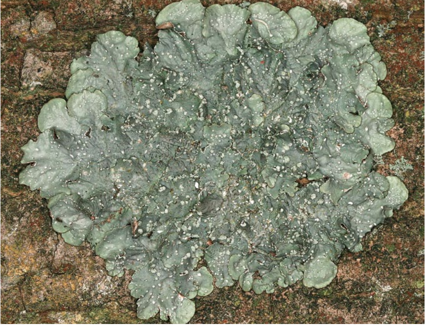
Bild 17: Eine der in Ausbreitung befindlichen wärmeliebenden Arten ist die Blattflechte Punctelia subrudecta.