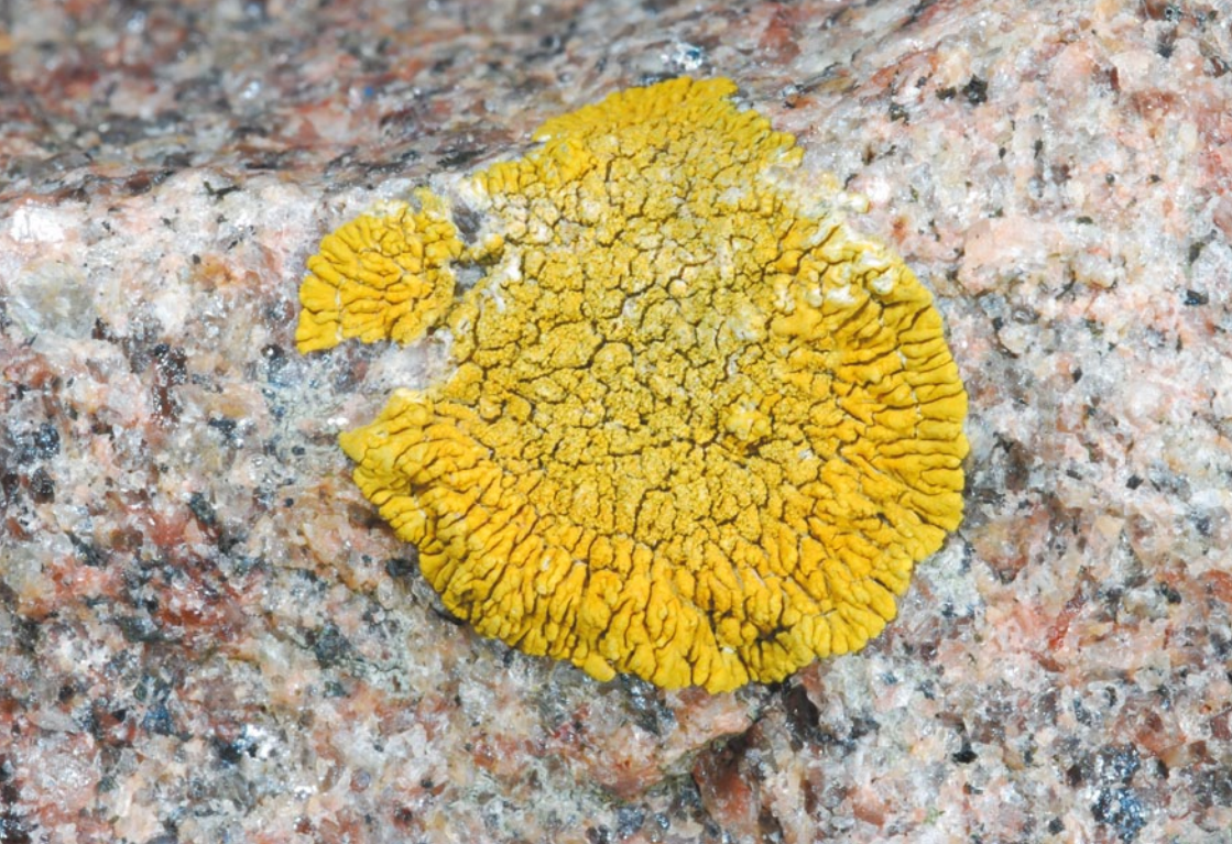
Bild 16: Die Küstenflechte Caloplaca verruculifera wurde 2009 auf Steinen der Küstenbefestigung des Beltringharder Kooges neu für Deutschland nachgewiesen.

Die früher an Ulmen weit verbreitete epiphytische Art Caloplaca luteoalba ist heute in den meisten Bundesländern ausgestorben und aktuell noch aus Baden-Württemberg bekannt (WIRTH 2008). Da sie in Schleswig-Holstein nur auf wenigen alten Bäumen Reliktbestände aufweist und keine Ausbreitungstendenz auf benachbarte jüngere Bäume zu erkennen ist, muss die Art bundesweit als akut vom Aussterben bedroht angesehen werden. Durch das weiterhin zu beobachtende Ulmensterben und eine Überalterung der noch vorhandenen Ulmenbestände ist ein starker Risikofaktor gegeben, der diesen Trend beschleunigt.