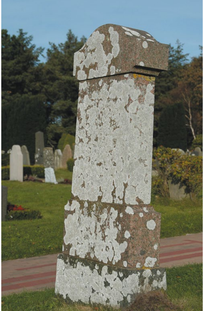
Bild 19: Alter Grabstein auf einem Friedhof auf Föhr, überzogen mit den weißen Lagern der seltenen Krustenflechte Lecanora rupicola (RL 3). Die nur langsam wachsenden Flechtenlager zeigen Beständigkeit und Alter des Grabsteins an und verleihen dem Monument eine eigene Schönheit. Bei genauerer Betrachtung können an solchen Standorten auch weniger auffällige seltene und gefährdete Arten entdeckt werden. (Foto: C. Dolnik 2009).

Standorte ist jedoch in der Regel nur langfristig möglich und bei stark gefährdeten und vom Aussterben bedrohten Arten, insbesondere an Reliktstandorten, unwahrscheinlich. Solchen Reliktstandorten kommt jedoch bei den angestrebten qualitativen Verbesserungen des Umweltzustandes – insbesondere der Luft- und Gewäs-