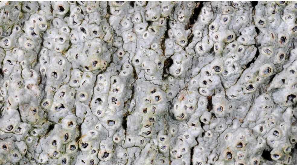
Bild 10: Die borkenbesiedelnde Seepockenflechte Thelotrema lepadinum ist eine Indikatorart für historisch alte Waldstandorte. Sie gilt darüber hinaus als schadstoffempfindlich und weist eine rückläufige Bestandsentwicklung auf.

liche Gesteinsvorkommen wie Findlinge und die wenigen Felsvorkommen in Schleswig-Holstein, zum anderen die durch menschliche Tätigkeit bearbeiteten Steine und Bauwerke wie Grenzsteine, Wegmarken, Grabsteine, Denkmäler, Feldsteinmauern, Küstenbefestigungen, Brücken, Kirchen und andere Bauwerke. Durch Flurbereinigungen wurden viele Gesteine in der Offenlandschaft beseitigt oder im Siedlungsbereich durch Erneuerungen und Renovierungen ersetzt, poliert oder bearbeitet. Bei Renovierungsmaßnahmen werden dabei die Gesteinsoberflächen zum Teil gezielt von Flechten gereinigt (Sandstrahlgebläse oder Hochdruckreiniger) oder alte Natursteinmauern komplett erneuert oder gestrichen. Selbst neue Natursteinmauern brauchen jedoch viele Jahrzehnte, um wieder von zahlreichen Flechten besiedelt werden zu können.