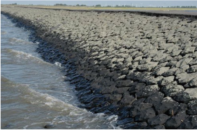
Bild 14: Flechtenzonierung an der Nordseite des Trischendamms (Nordseeküste). Die alten Basaltsteine in der Spritzwasserzone sind nahezu geschlossen von der hellgrauen Krustenflechte Lecanora helicopis überzogen, darunter folgt im oberen Überflutungsbereich eine Zone mit der unscheinbaren schwarzgrauen Krustenflechte Verrucaria erichsenii und anderen Verrucaria -Arten.

Die Salzwasserflechten Collembosidium foveolatum , Lichina confinis , Verrucaria maura (Bild 15), V. mucosa , V. paulula , V. sandstedei und V. striatula haben in Schleswig-Holstein ihren Verbreitungsschwerpunkt, da sie in den benachbarten Bundesländern mit Meeresküste Mecklenburg-Vorpommern, Niedersachsen und Hamburg nur Einzelvorkommen besitzen oder dort ausgestorben sind. Die gesteinsbesiedelnden Küstenflechten sind durch die starke Eutrophierung der Küstengewässer bedroht, in deren Folge die Steine mit einem schmierigen Algenfilm überzogen sind. Auch die Arten Bacidia scopulicola , Caloplaca verruculifera , Ramalina siliquosa , Verrucaria internigrescens und Xanthoria aureola haben ihren Verbreitungsschwerpunkt in terrestrischen Küstenlebensräumen. Caloplaca verruculifera (Bild 16) ist bislang nur von einem Standort in Deutschland auf einem Gesteinsblock zur Küstenbefestigung bekannt und wird erst in Skandinavien oder der westeuropäischen Atlantikküste an Standorten mit natürlichen Festgesteinsvorkommen häufiger.