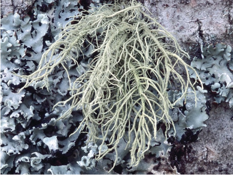
Bild 13: Wie alle Bartflechten ist auch Usnea filipendula (RL 1) nach der Bundesartenschutzverordnung gesetzlich besonders geschützt. Sie besiedelt saure, nährstoffarme Borken und kommt daher überwiegend auf Nadelbäumen vor, im Bild zusammen mit der grauen Blattflechte Hypogymnia physodes.

Für die besonders geschützten Arten gilt, dass deren gewerbliche Nutzung verboten ist, für alle nicht geschützten Arten ist die gewerbliche Nutzung genehmigungspflichtig. Zu den besonders geschützten Arten gehören alle Arten der Gattungen Anaptychia , Cetraria (inkl. Tuckermanopsis ), Cladonia sect. Cladina , Lobaria , Parmelia und der Familien Ramalinaceae ( Ramalina ) und Usneaceae ( Bryoria , Cetraria , Evernia , Vulpicida , Usnea ). Hierzu gehört zum Beispiel die Isländische Moosflechte ( Cetraria islandica ), deren Extrakte in Hustenmitteln verwendet werden, sowie die Rentierflechten. Als Referenzliste für die taxonomische Benennung der Flechten wird Bezug genommen auf WIRTH et al. (1996), wodurch beispielsweise nicht nur die Gattung Parmelia , sondern auch alle heute in den Gattungen Flavoparmelia , Melanelia , Melanelixia , Melanohalea , Parmelina , Pleurosticta , Punctelia und Xanthoparmelia aufgeführten Arten besonders geschützt sind. Ramalinaceae wird hier auf