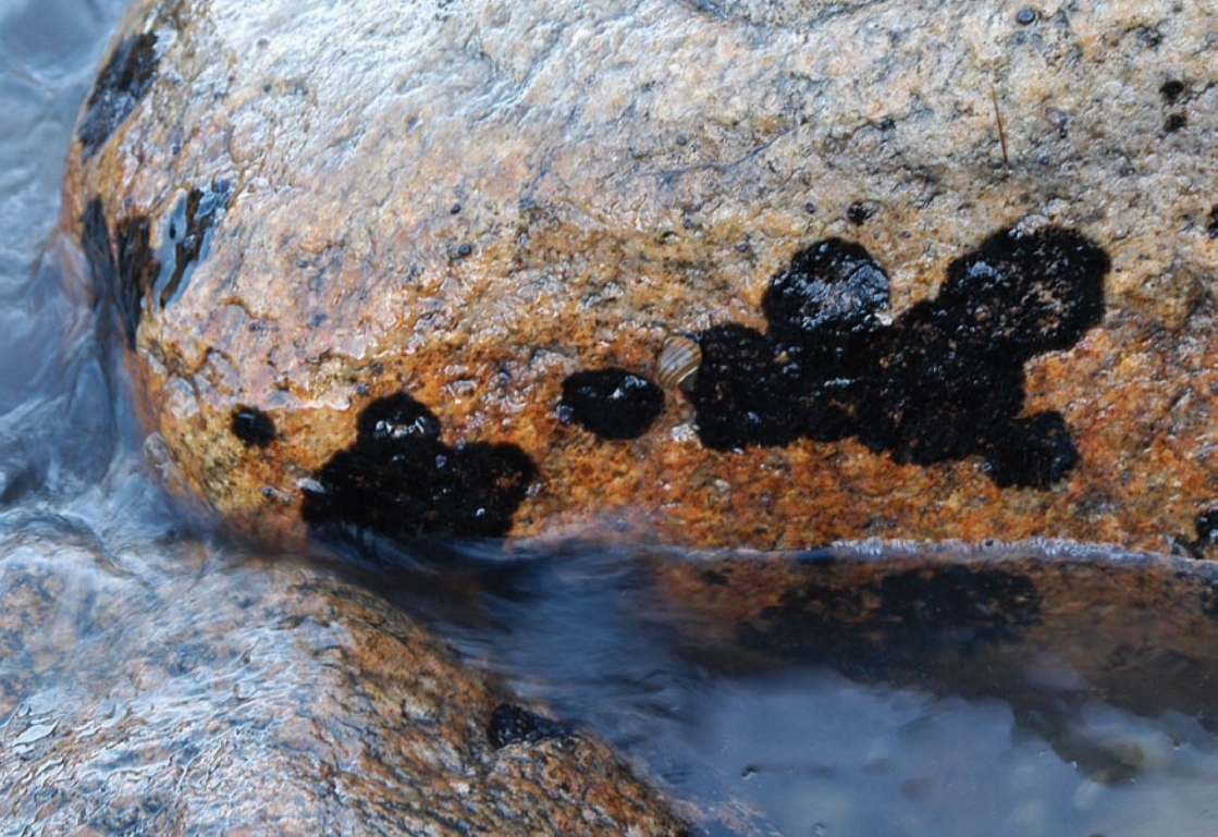
Bild 15: Nur noch an wenigen Steinen im Überflutungsbereich der Nord- und Ostsee kommt die Schwarze Meeresflechte Verrucaria maura vor (RL 3), davon liegen die meisten bundesdeutschen Standorte in Schleswig-Holstein. Durch Eutrophierung der Küstengewässer und damit einhergehende Veralgung von Steinen ist die Art gefährdet. (Foto: C. Dolnik 2009, Ostsee bei Bülk).

Eine andere Gruppe bilden Arten mit stark ozeanischem Verbreitungsschwerpunkt wie Enterographa crassa , Normandina acroglypta , Ramalina lacera und Schismatomma graphidioides . Während sich die Bestände von Enterographa crassa besonders an der Ostseeküste erholen konnten, ist Normandina acroglypta bisher nur von der Nordseeinsel Föhr bekannt. Ramalina lacera und Schismatomma graphidioides sind akut vom Aussterben bedroht und kommen bundesweit nur noch auf Gehölzen in unmittelbarer Küstennähe der Ostsee vor. Auch die in Skandinavien verbreitete Art Cyphelium notarisii , ist derzeit nur noch von der schleswig-holsteinischen Ostseeküste bekannt (JACOBSEN 1992).