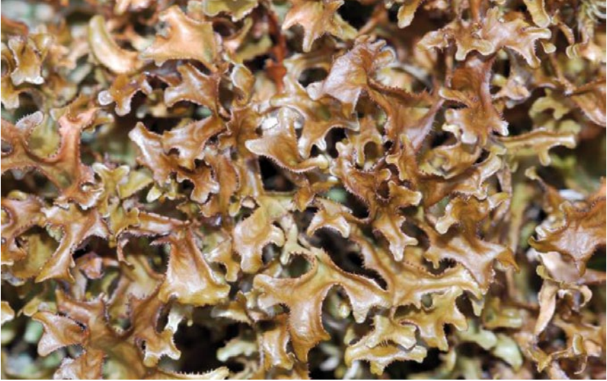
Bild 3: Die Isländische Moosflechte Cetraria islandica war früher in Heiden, Dünen und Sandtrockenrasen nicht selten. Durch Bestandsrückgänge ist sie heute stark gefährdet.