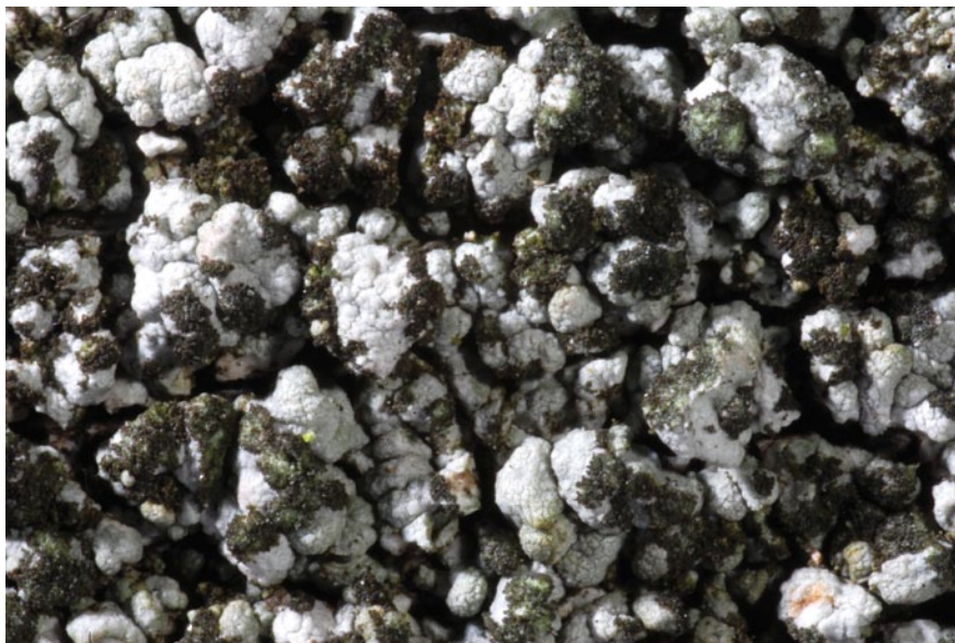
Bild 6: Thelomma ocellatum kommt in Schleswig-Holstein nur steril vor und fällt durch schwarzbraune Sorale an den dicht gedrängten grauen Areolen des Flechtenlagers auf. Durch die Sorale werden für die vegetative Vermehrung staubfeine Körnchen aus Flechtenpilz und Flechtentalge an die Umgebung abgegeben.

Beispiel: Thelomma ocellatum ist eine bei uns nur steril vorkommende, unscheinbare Krustenflechte. Sie ist in Schleswig-Holstein bisher nur sehr selten auf Eiche und Totholz gefunden worden. Von ERICHSEN (1957) wird sie nicht erwähnt, wodurch keine Aussagen zur langfristigen Bestandsentwicklung getroffen werden können. Da sie in den Nachbargebieten Schleswig-Holsteins vorkommt, wird vermutet, dass sie im Gebiet ursprünglich ist und die Bestände durch Verlust von unbehandeltem Holzwerk und alten Eichen zurückgegangen sind. Die Art wurde von JACOBSEN & ERNST (1987) neu für Schleswig-Holstein nachgewiesen.