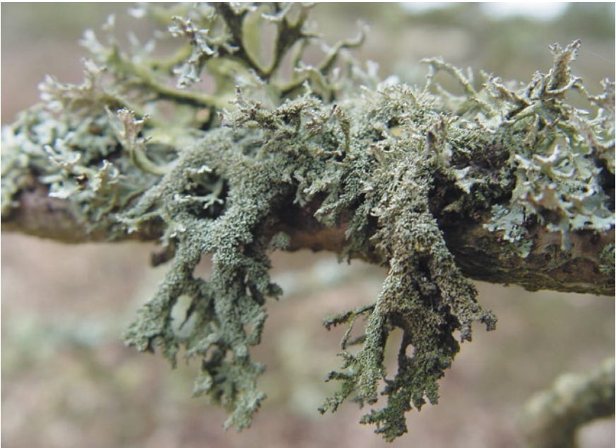
Bild 18: Arten mit Kühlepräferenz wie die Strauchflechte Pseudevernia furfuracea gehen auffällig zurück.