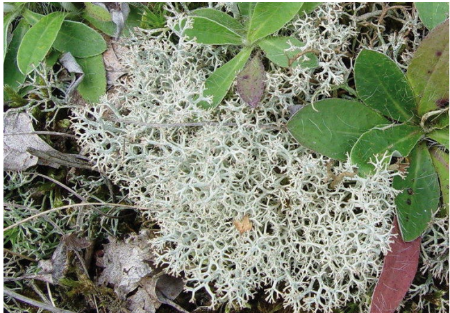
Bild 7: Die Rentierflechte Cladonia portentosa besiedelt nährstoffarme Böden, auf denen sie ausgedehnte weiße Polster bilden kann – hier in einem Sandtrockenrasen im Naturschutzgebiet Schachtholm, zusammen mit dem Kleinen Habichtskraut ( Hieracium pilosella ) und der grauen Cladonia rangiformis (links im Bild).

Beispiel: Die Allseitswendige Rentierflechte Cladonia portentosa ist unsere häufigste Rentierflechte und in Trockenrasen, Dünen, Heiden und Mooren stellenweise noch verbreitet. Doch sind die Bestände mittlerweile stark ausgedünnt. Als Besiedler nährstoffarmer Böden wird sie bei fortschreitender flächenhafter Eutrophierung der Landschaft durch mit Stickstoffverbindungen belastete Luft und Niederschläge weiter im Bestand zurückgehen.