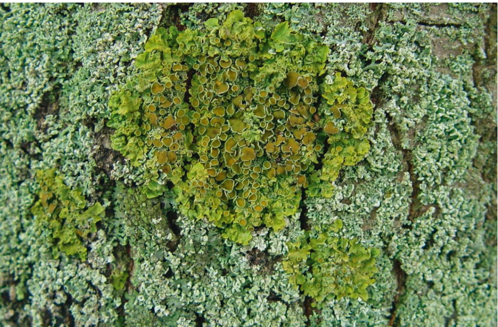
Bild 11: Nitrophytische Flechten am Stamm einer Linde in Kiel. Neben der auffällig gelben Wandflechte ( Xanthoria parietina ) bilden die kleine hellgraue Blattflechte Physcia tenella und die dunkelgraue Blattflechte Phaeophyscia orbicularis einen dichten Rasen.

sa) oder dem Land-Reitgras ( Calamagrostis epigejos ) dominiert werden und die auf steigende Stickstoffeinträge in das Ökosystem zurückzuführen sind (REMKE et al. 2009). Die starke Eutrophierung fördert besonders eine Gruppe einzelliger und fädiger Mikroalgen, die auch als Luftalgen bezeichnet wird, und die in zunehmende Konkurrenz zu Flechten tritt. Diese Mikroalgen überziehen vielerorts Baumstämme, Steine und auch Sandböden und Torfe mit einem grünen Schleier. Die meisten Flechten sind diesen Algen konkurrenzunterlegen. Die einstmals verbreiteten silbergrauen, mit zahlreichen weißen Flechtenlagern überzogenen Buchenstämme unserer Wälder erscheinen heute grün-veralgt und meist flechtenfrei. Ähnliches gilt auch für den Rückgang unserer Süßwasser- und Küstentflechten. Steine in und an Bächen und Flüssen sowie im Hafengebiet der Küsten sind oft mit einem grünen Algenüberzug versehen und flechtenfrei; alle heimischen Süßwasserflechten sind heute als gefährdet einzustufen.