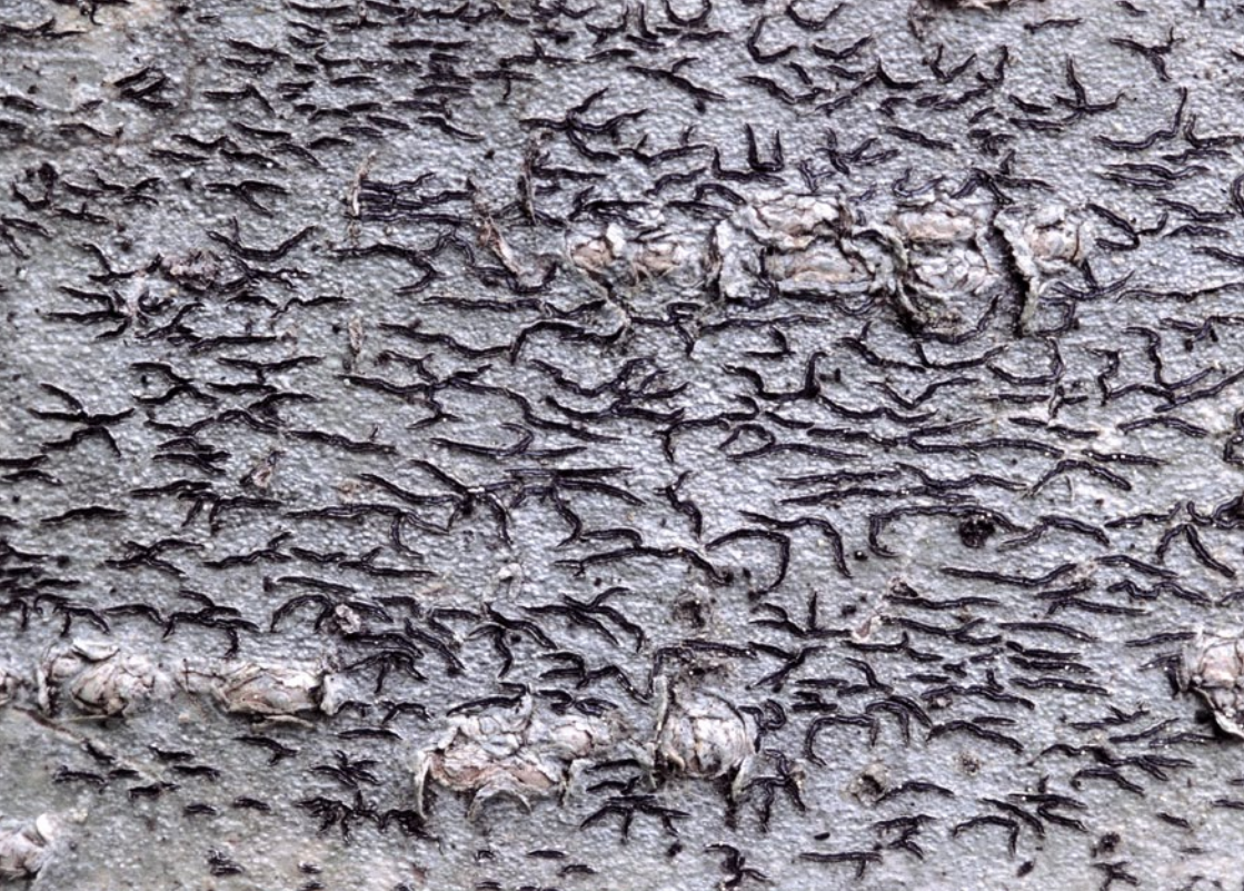
Bild 8: Die Schriftflechte Graphis scripta ist auf glattrindigen Borken von Laubbäumen in Wäldern verbreitet. Die schwarzen Fruchtkörper auf dem weißlichen Flechtenlager erinnern an Schriftzeichen.