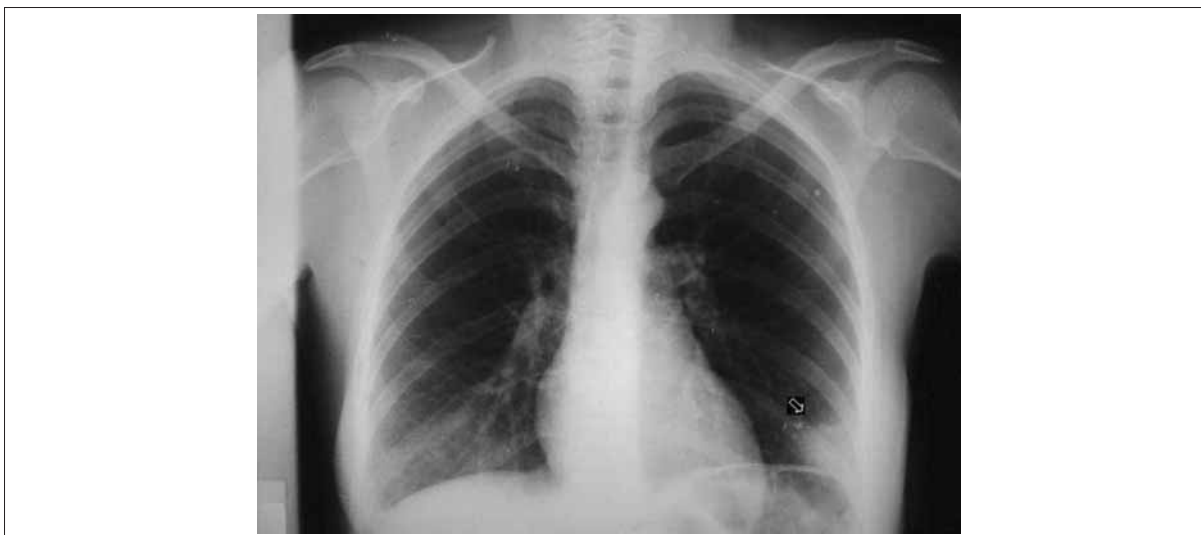
Figura 1. Radiografía de tórax. Joroba de Hampton (flecha)