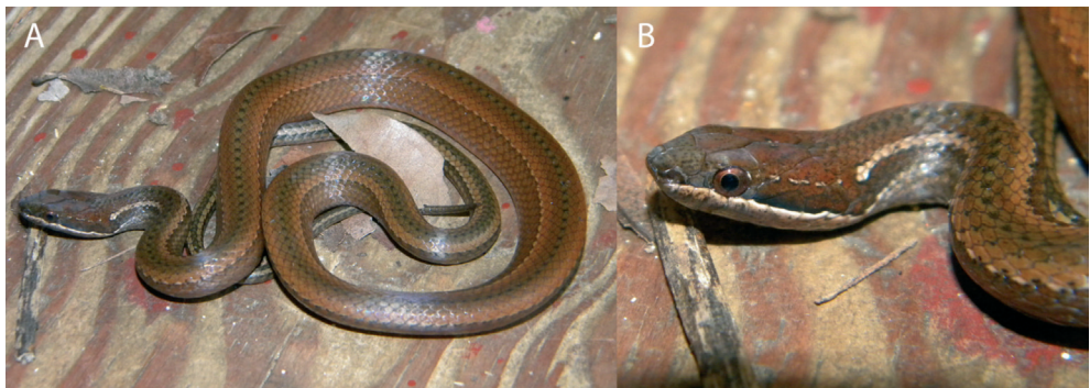
Figura 4. Coniophanes andresensis : a) cuerpo general, b) detalle de la cabeza (ICN-R 12196).

En las exploraciones realizadas a otros puntos como en Manuel Pond, Jack Pond, Clay Maunt, Clark Pomare Hill, Harmony Hall Hill, Shingle Hill, Orange Hill, El Jardín Botánico, alrededores de Free Town, el sector de la Cueva de Morgan, Lever Hill, Pepper Hill, Tom Hooker y la Punta Sur, no se encontraron serpientes de esta especie. Aunque se buscó en hábitats donde se podrían