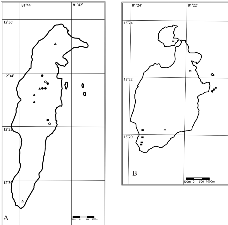
Figura 1. Localidades de ejemplares capturados en las islas de San Andrés (A) y Providencia (B). Triángulos pertenecen a registros de Coniophanes andresensis , Círculos pertenecen a registros de Mabuza berengeriae y rectángulos son registros de M. pergravis . Símbolos abiertos son registros de literatura y observaciones realizadas durante la salida.

Las categorías de riesgo o amenaza que se siguieron para la evaluación de las especies fueron las de la IUCN, propuestas por la