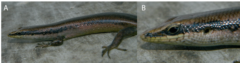
Figura 3. Mabuya pergravis : a) cuerpo general, b) detalle de la cabeza (ICN-R 12136).

Mabuya pergravis es una especie arbórea principalmente (no se observaron especímenes en el suelo) que se puede encontrar en zonas de cultivo, borde de bosque, dentro del mismo bosque secundario en regeneración y sobre troncos podridos al borde del camino. No se observaron especímenes cerca de las casas, en construcciones abandonadas ni en las piñuelas que se encontraban a la orilla de los caminos o a los lados de las casas.