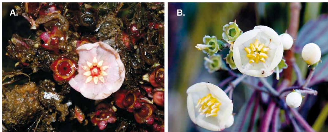
Figura 1. Comparación de flores de K. imbricata y Killipia . A. Killipia verticalis; B. Killipia imbricata.

Arbusto de 1,5–3 m; entrenudos de 1,3–1,9 cm, teretes. Ramas, peciolo e inflorescencia con cubierta densa purpura, marrones al secar, estriados; tricomas filiformes levemente adpresos de 0,4-0,8 mm. Hojas del mismo tamaño en cada nudo en ocasiones desiguales una de la otra en longitud. Peciolo teretes de 1,0–2,5 cm y 1,0–2,0 mm de diámetro. Lámina de 2–7 x 1–3 cm, ovadas, oblongovadas u oblongoelípticas, de textura cartácea quebradiza; margen denticulado-espínulosa; base obtusa a redondeada; ápice agudo o levemente acuminado; haz glabra, con el retículo de la nervadura impreso; envés con cubierta similar a los peciolo en la nervadura. Nerviación con 2 pares de venas secundarias acompañando a la vena media, basales; con 32–35 venas terciarias aledañas a la vena media y distanciadas 1,3–1,8 mm en la parte media de la lámina; nerviación terciaria formando