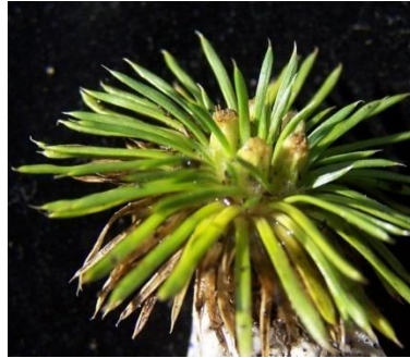
Figura 3. Novenia acaulis (Wedd. ex Benth.) Freire & Hellwig.