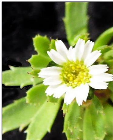
Figura 11. Chaetanthera peruviana A. Gray.