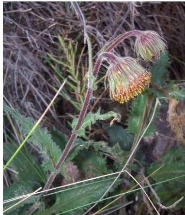
Figura 21. Senecio rhizomatus Rusby.