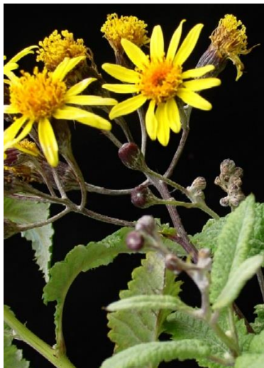
Figura 14. Lomanthus subcandidus (A. Gray) B. Nord.