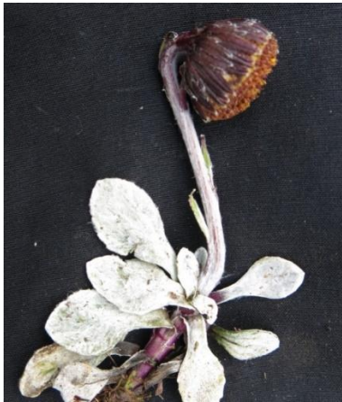
Figura 20. Senecio modestus Wedd.