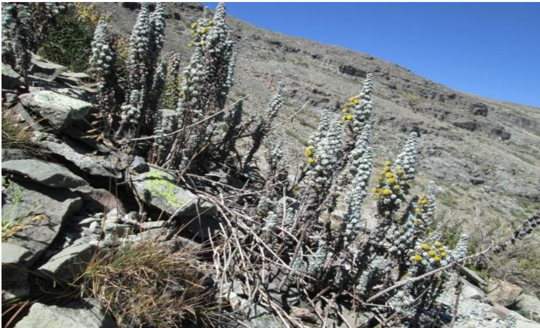
Figura 22. Xenophyllum staffordiae (Sandwith) V.A. Funk.