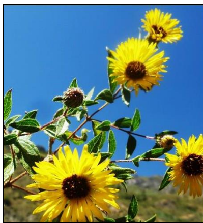
Figura 9. Chionopappus benthamii S.F. Blake.