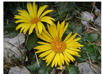
Figura 10. Paranephelius uniflorus Poepp. & Endlicher.