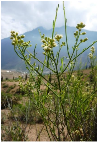
Figura 2. Baccharis spartea Benth.