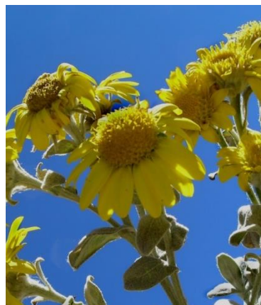
Figura 19. Senecio hohenackeri Sch.Bip. ex Wedd.