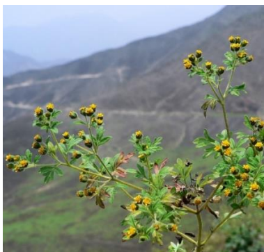
Figura 8. Villanova oppositifolia (Lag.) S.F. Blake.