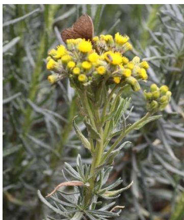
Figura 17. Senecio collinus DC.