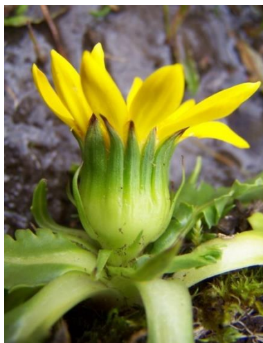
Figura 16. Senecio breviscapus DC.