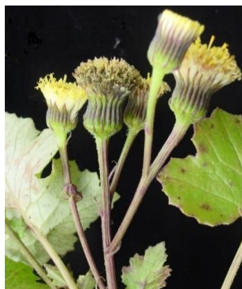
Figura 18. Senecio gracilipes A. Gray.