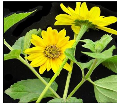
Figura 6. Heliopsis buphthalmoides (Jacquin) Dunal.