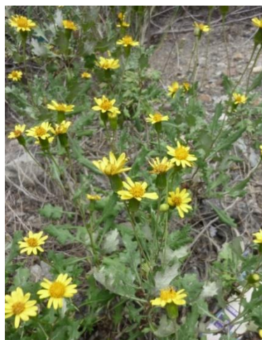
Figura 15. Lomanthus tovarii (Cabrera) B. Nord. & Pelsler.