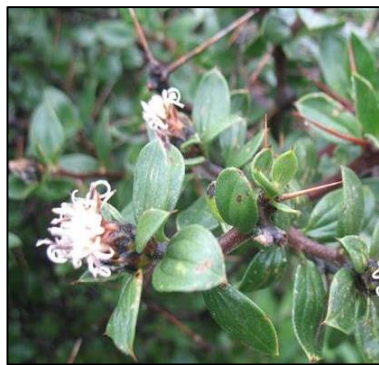
Figura 5. Dasyphyllum ferox (Wedd.) Cabrera.