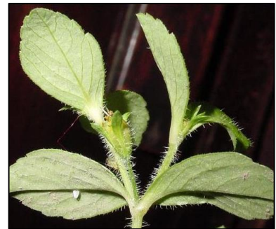
Figura 7. Heterosperma ovatifolium Cav.