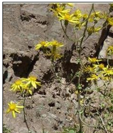
Figura 13. Lomanthus cantensis (Cabrera) P. Gonzáles.