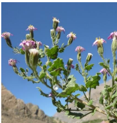
Figura 12. Jungia axillaris (Lag. ex DC.) Spreng.