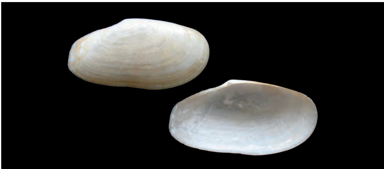
Figura 7. Macoma (Psammacoma) elytrum Keen, 1958; Longitud, 27,8 mm; altura, 14,0 mm.

Nuestros ejemplares son juveniles, pues esta especie puede exceder los 27 mm de longitud (Olsson 1961, Keen 1971). La concha es sólida algo alargada y de forma oblicua, los picos son subcentrales y los umbos bajos, el extremo anterior es más corto