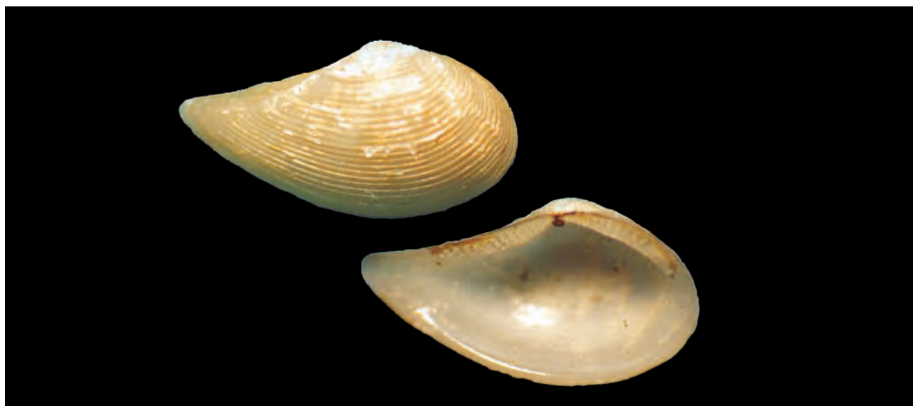
Figura 3. Saccella laeviradius (Pilsbry & Lowe, 1932); Longitud, 6,2 mm; altura, 3,3 mm.