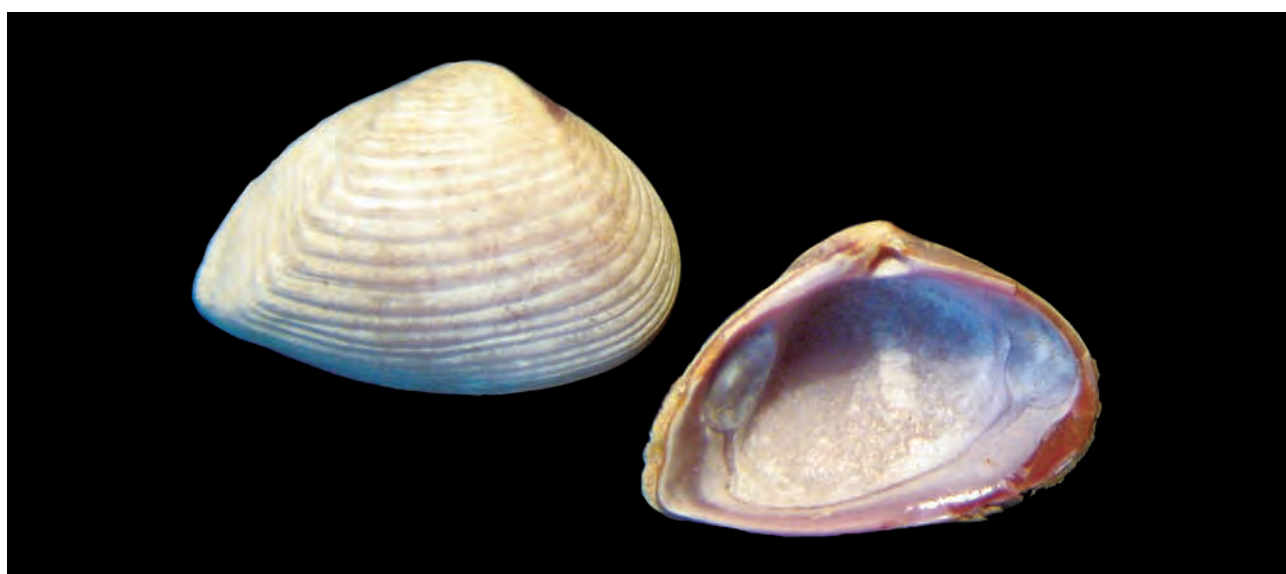
Figura 10. Caryocorbula amethystina Olsson, 1961; Longitud, 7,0 mm; altura, 4,7 mm.