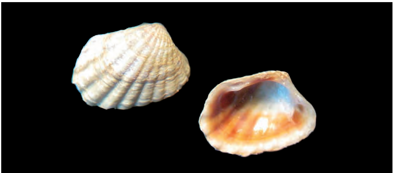
Figura 6. Carditella (Carditella) naviformis (Reeve, 1843); Longitud, 5,0 mm; altura, 2,8 mm.