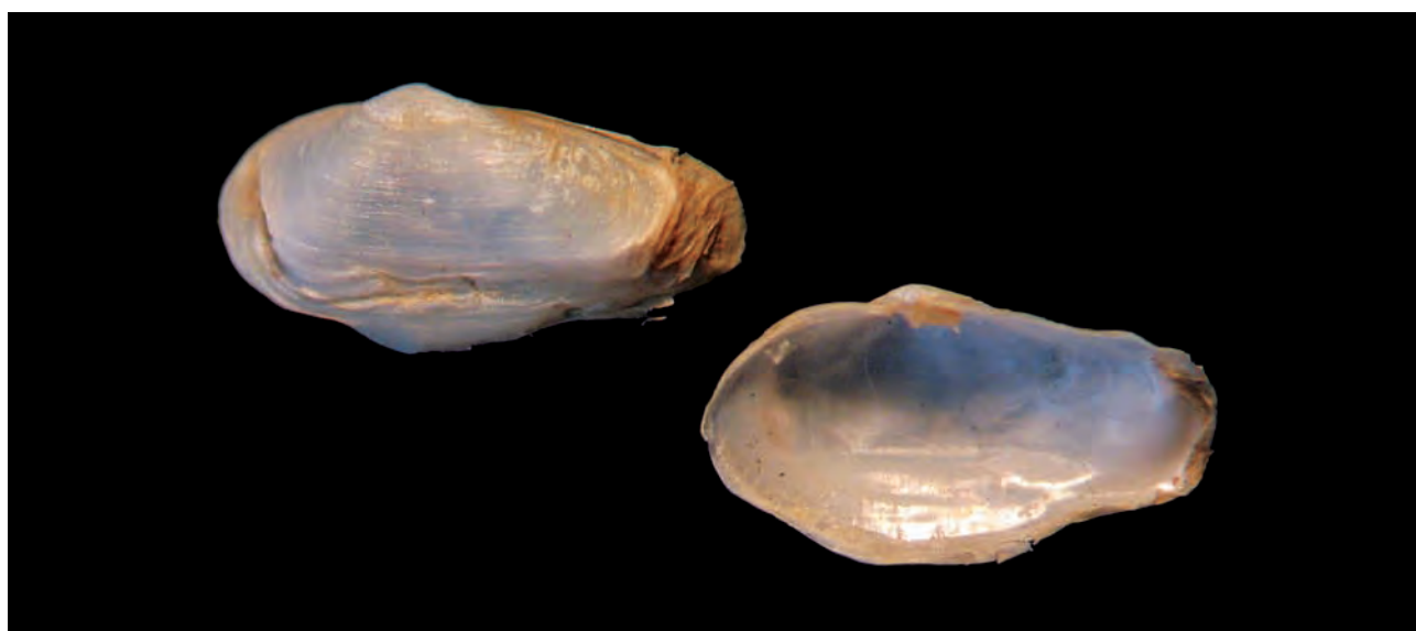
Figura 9. Sphenia fragilis (H. Adams & A. Adams, 1854); Longitud, 5,0 mm; altura, 2,8 mm.