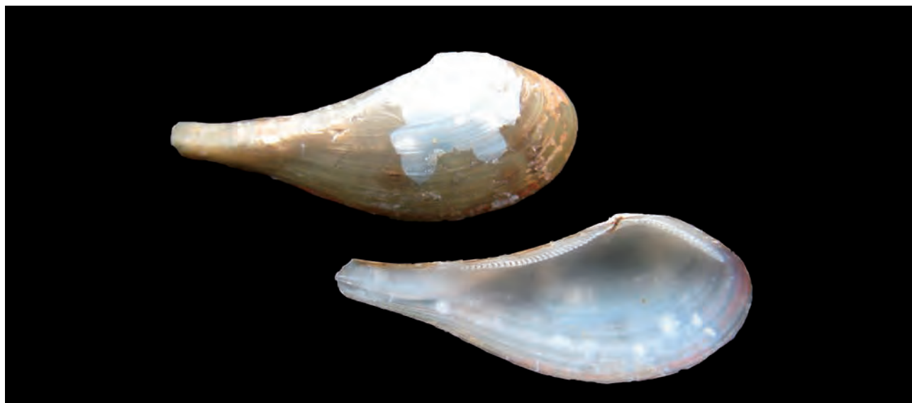
Figura 2. Nuculana (Nuculana) loshka , (Dall, 1908); Longitud, 17,0 mm; altura, 7,0 mm.