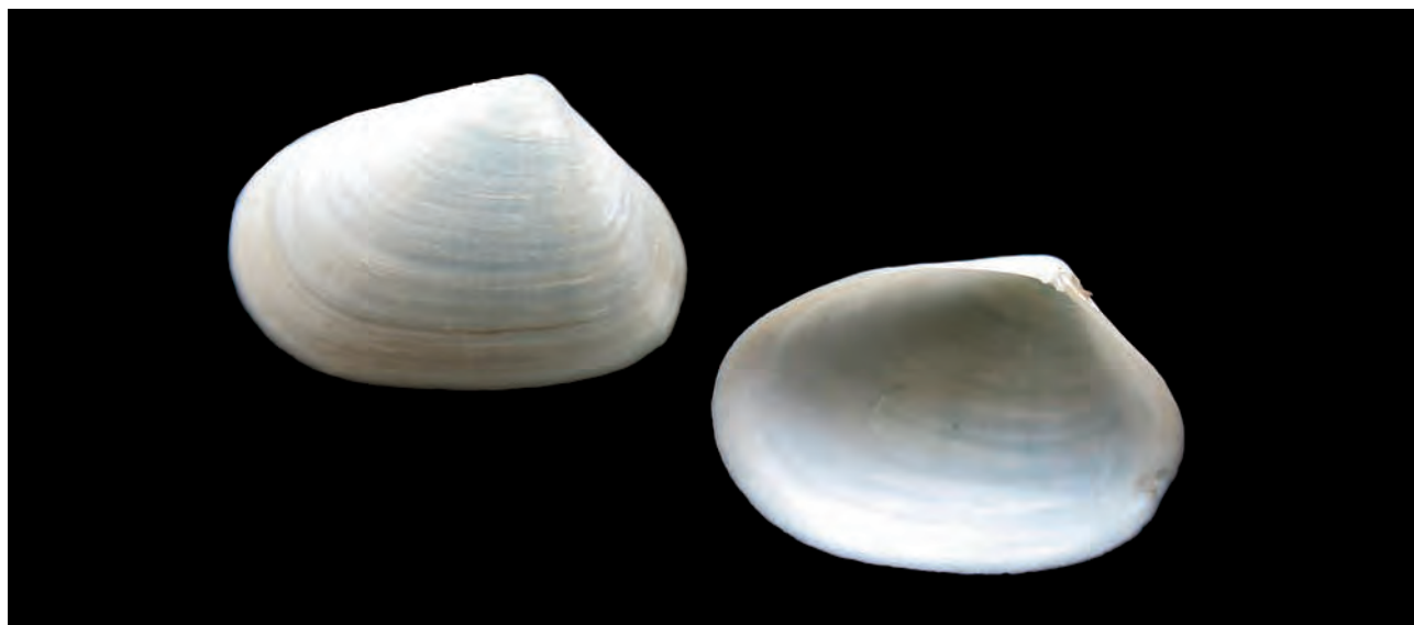
Figura 8. Psammotreta (Psammotreta) pura (Gould, 1853); Longitud, 15,3 mm; altura, 10,5 mm (ejemplares juveniles, procedentes de Sechura).