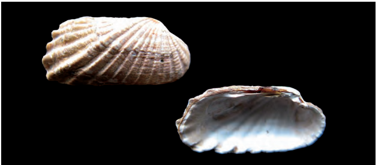
Figura 5. Carditamera radiata (G. B. Sowerby I, 1833); Longitud, 14,0 mm; altura, 6,5 mm.