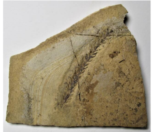
Lebachia piniformis A, Organisation d'une branche, B, les feuilles stériles C feuilles fertiles