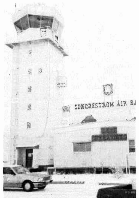
Kangerlussuaq armimittarfiani napasuliaq nakkutillivik Namminersornerullutik Oqartussat tigusaasa siullersaraat. Sakkutooqarfup sinneran ukioq ataaseq qaangiuppat tiguneqassaaq.