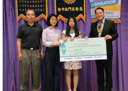
RYE派遣學生捐贈RYE委員會運作基金