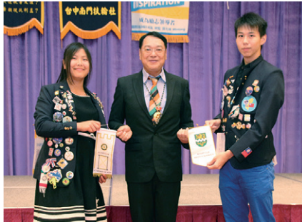
RYE歸國學生交換社旗