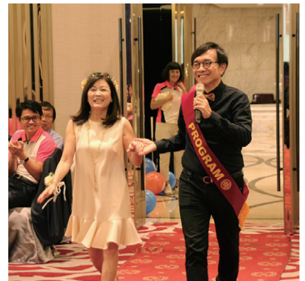
八月份結婚週年走紅地毯

14日)、Fumin社友(8月16日)、Kneader夫人(8月19日)、Ortho社友(8月29日)、Surgeon夫人(8月29日)、Tony社友(8月31日)、Packing社長致贈生日禮品。