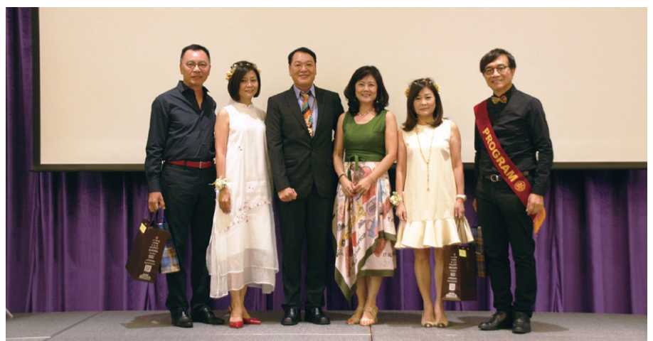
八月份結婚週年慶