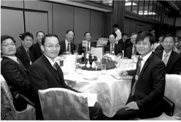
惠來社授證一週年慶典聯合例會