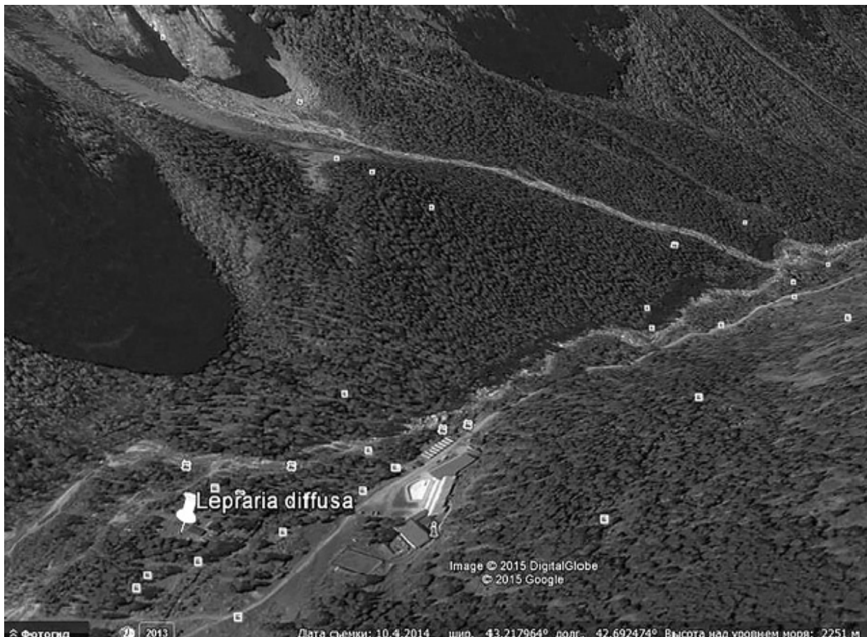
Рис. 2. Баксанское ущелье и долина реки Адылсу