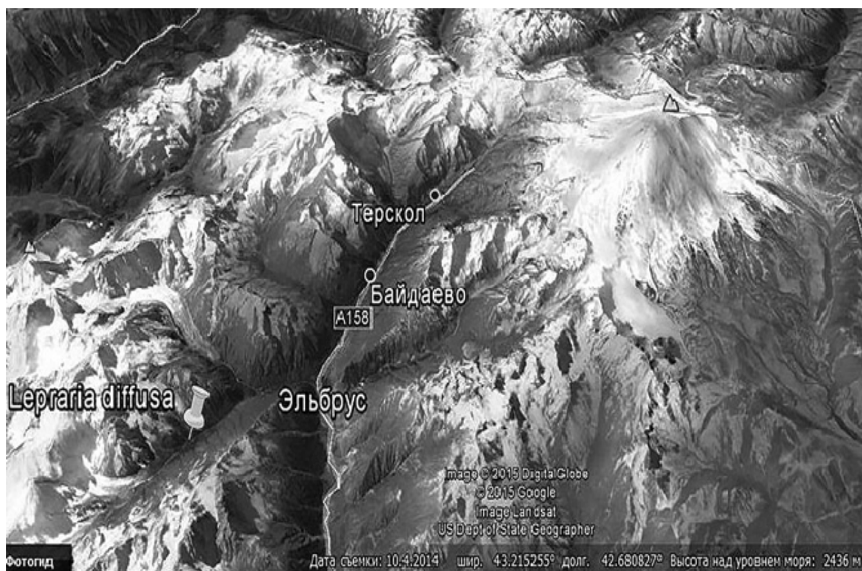
Рис. 1. Основные населенные пункты на территории Национального парка и место находки Lepraria diffusa

территории определяются очень сложным рельефом, значительной разницей абсолютных высот над уровнем моря и влиянием ледников. Самый холодный месяц – февраль с температурами от -17,7^{\circ}\text{C} в высокогорьях (4100 м над ур. м.) до -3,4^{\circ}\text{C} в долинах (1467 м); самый теплый – август: от 17,0^{\circ}\text{C} в долинах (1467 м) до 0,2^{\circ}\text{C} в высокогорьях (4100 м). С ростом высоты происходит увеличение относительной влажности воздуха: на высоте 3700 м она составляет 73 %. В течение года преобладают западные и северо-западные ветры, а на пике Терскол – западные и юго-западные. За год в среднем выпадает 791 мм осадков, большая часть их приходится на период с апреля по октябрь. С ростом высоты количество осадков увеличивается. Летние осадки имеют ливневый характер и часто сопровождаются грозами. Микроклимат также меняется в зависимости от экспозиции склона: на южных склонах он более теплый и сухой, на северных – холодный и влажный. Атмосферное давление в среднем составляет 610 мм рт.ст.